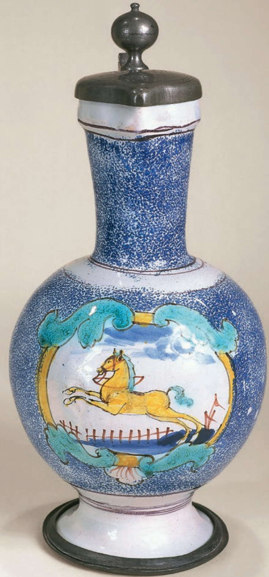
25. Hanauer Fayenceenghalskrug um 1740, der mit bunten Scharfffeuerfarben bemalt ist, H. 28 cm