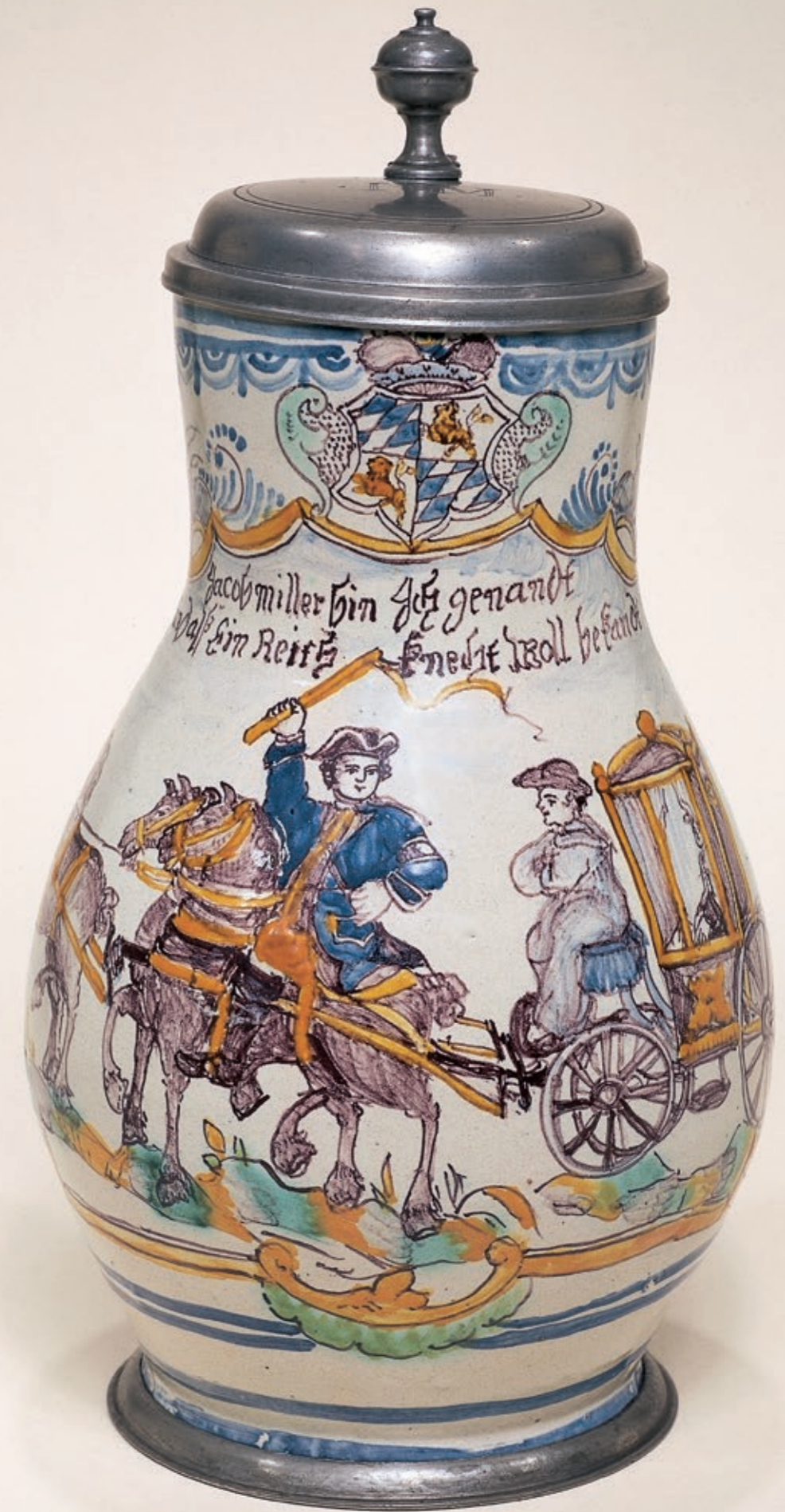
45. Salzburger Fayencekrug 1785 datiert, der mit bunten Scharfffeuerfarben bemalt ist, H. 28 cm