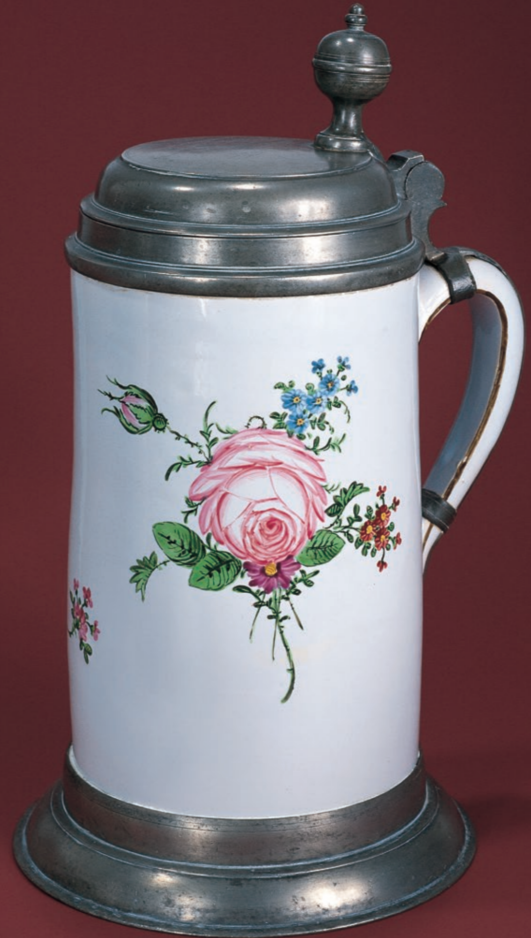
42. Proskauer Fayencewalzenkrug um 1790, Sprottauer Zinnmontierung, H. 30 cm