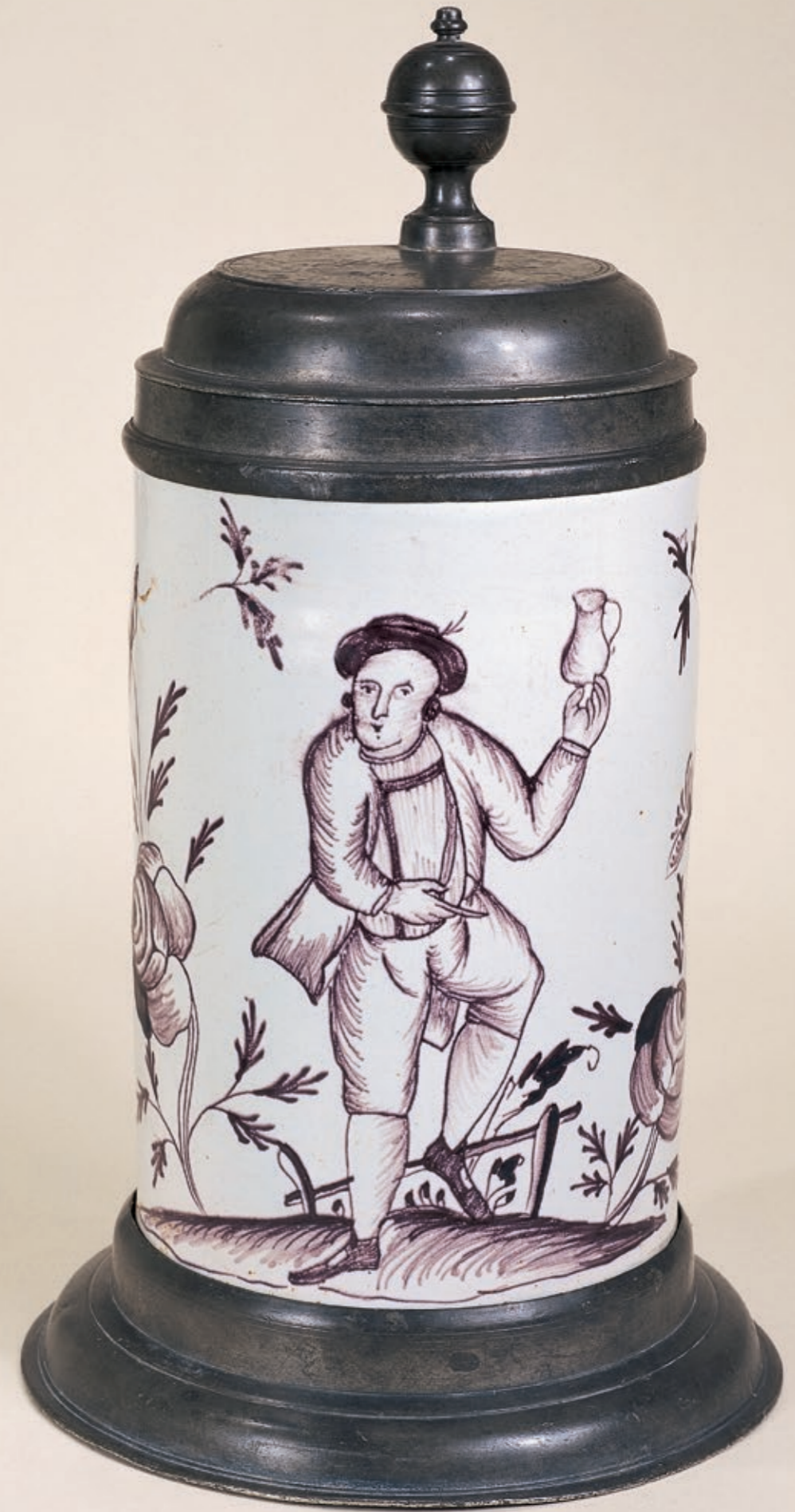
20. Frankfurter (Oder) Fayencewalzenkrug um 1780, mit Manufakturmarke „F/H“, H. 25 cm