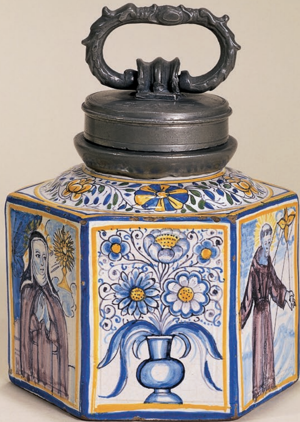
33. Niederösterreichische Fayenceflsche um 1750, mit bunter Scharfffeuermalerei, H. 16 cm