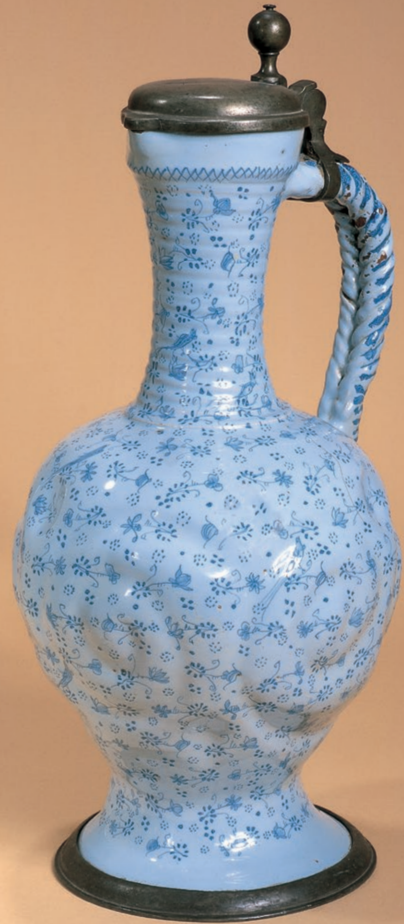
4. Ansbacher Vögeleskrug um 1720, Georg Christian Oswald zugeschrieben, H. 38 cm