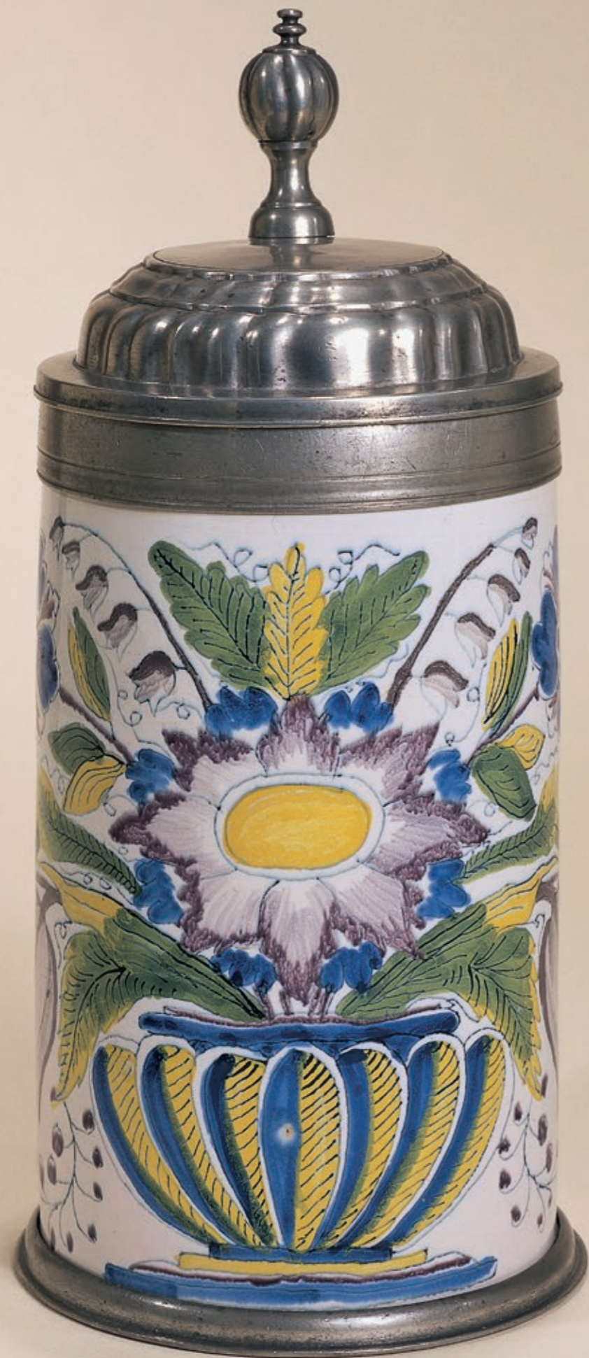
49. Schrattenhofener Fayencewalzenkrug in bunter Scharfffeuermalerei um 1770, H. 25 cm