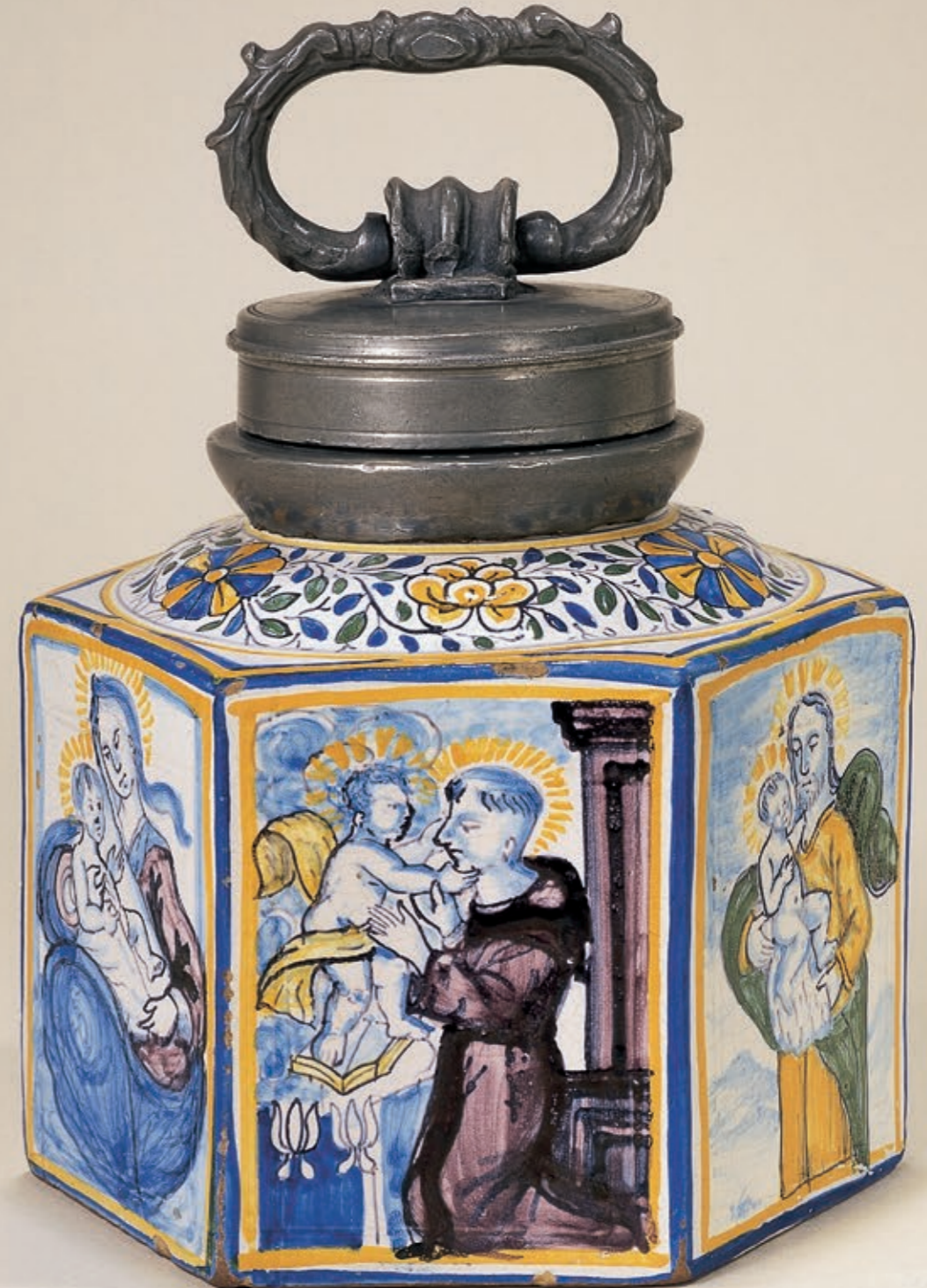
Die sechs Seiten sind mit fünf verschiedenen Heiligenmotiven und einer Blumenvase bemalt.