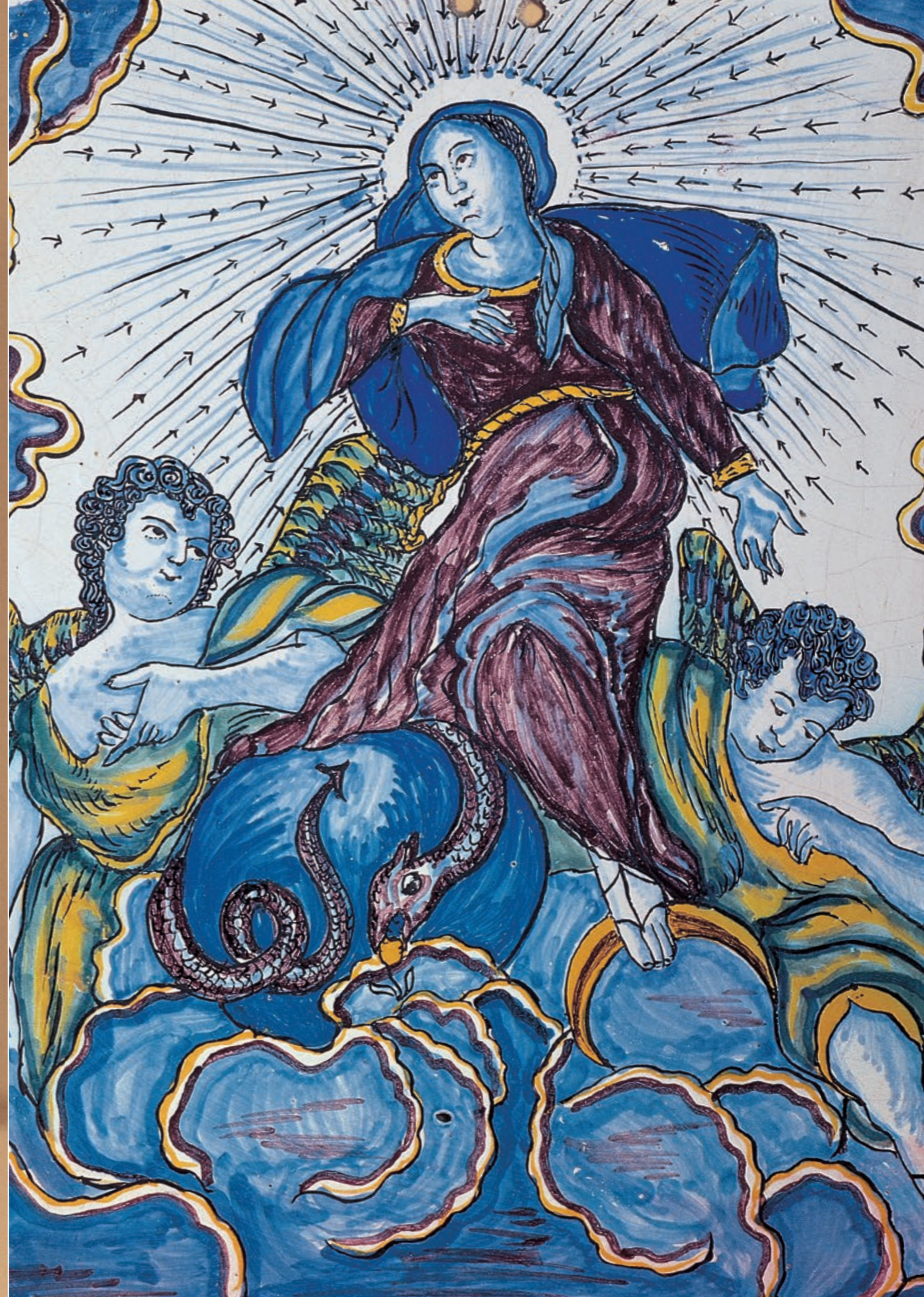
23. Gmundner Fayencebildplatte der „Blauen Periode“ datiert 1754, H. 34 cm