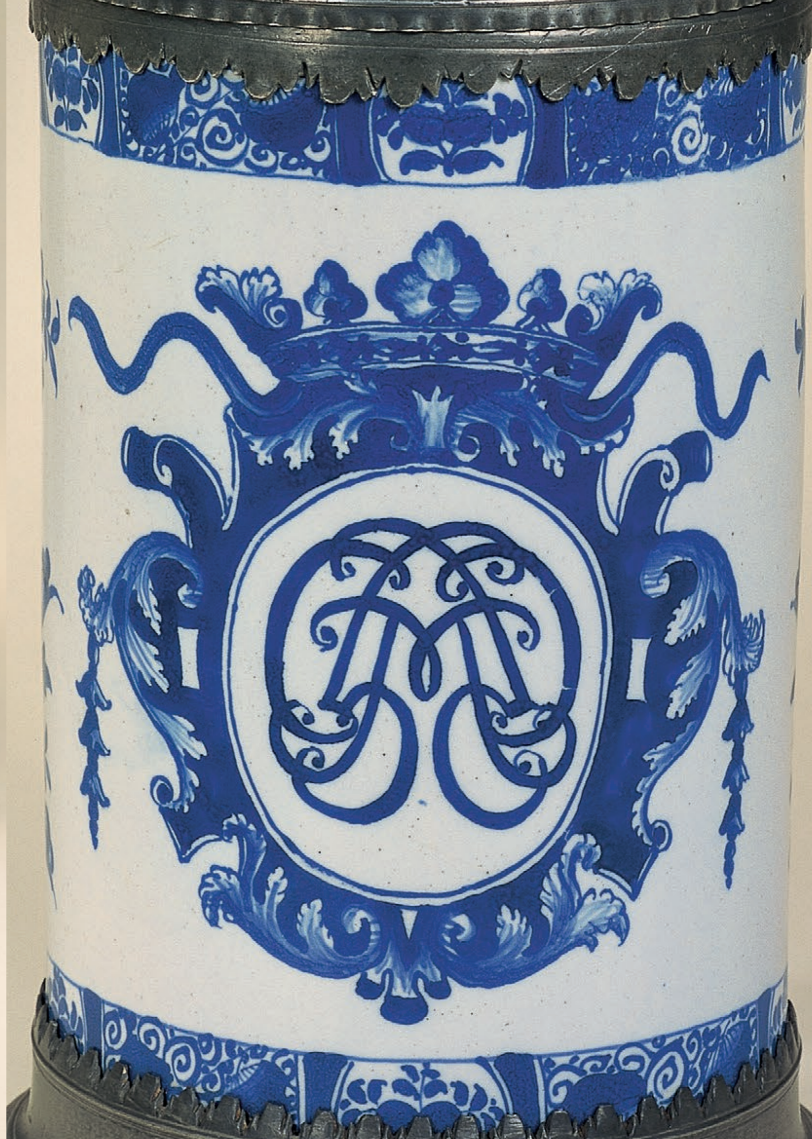
5. Bayreuther Fayencewalzenkrug um 1730, Manufaktur- und Malermarken „BK N“, H. 30 cm