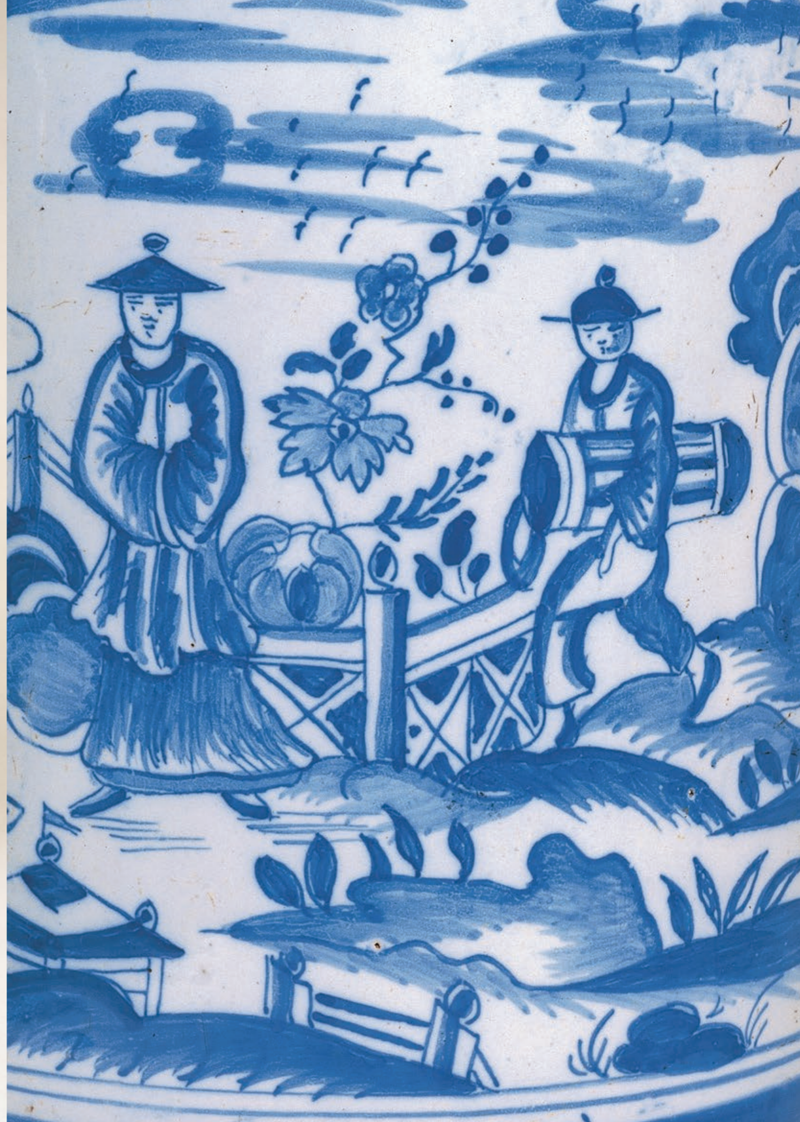
12. Dorotheenthaler Fayencekrug um 1740, auf dem Boden die Malermarke „To“, H. 34 cm