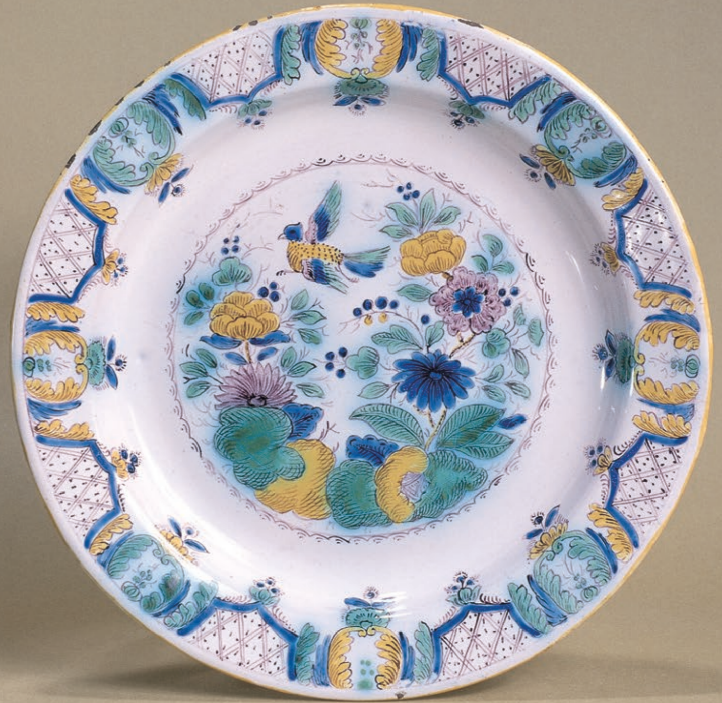
39. Nürnberger Fayenceteller um 1730, P. C. Schwab zugeschrieben, D. 26 cm