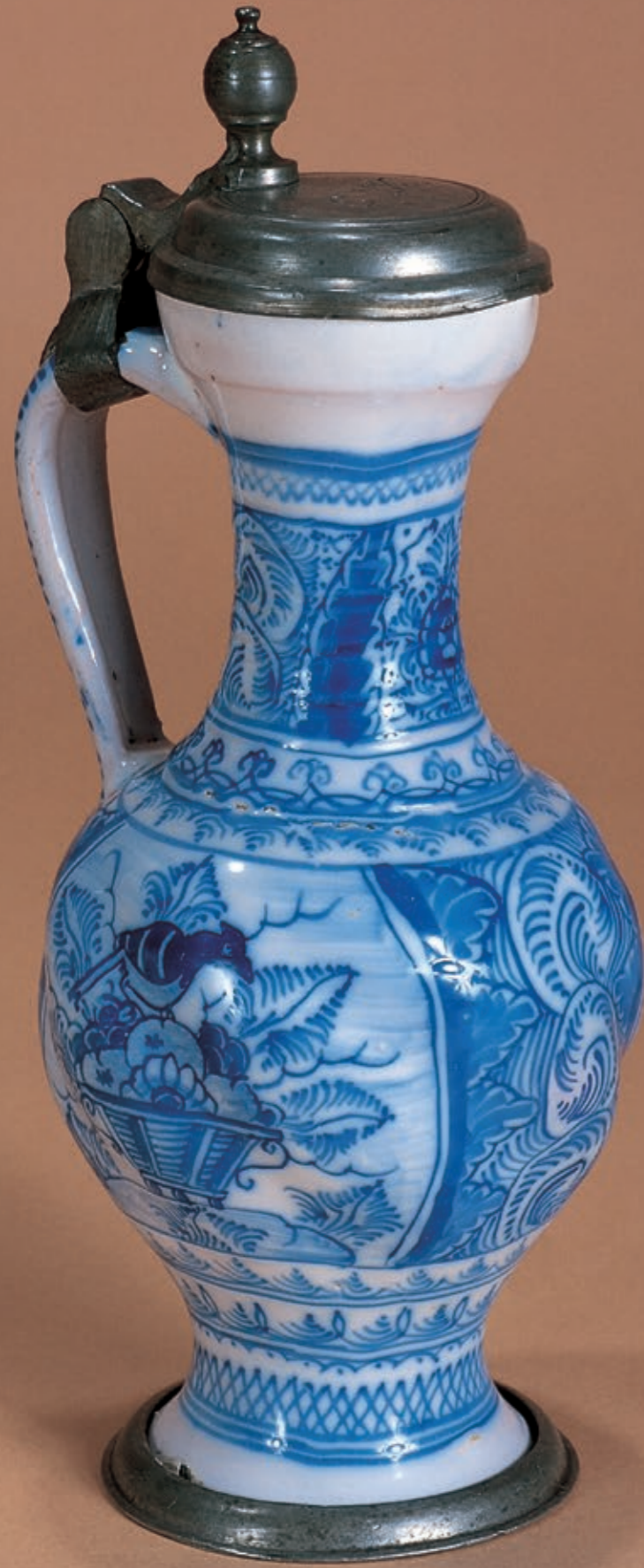
30. Künersberger Enghalskrug mit kobaltblauer Scharfffeuermalerei um 1750, H. 21 cm