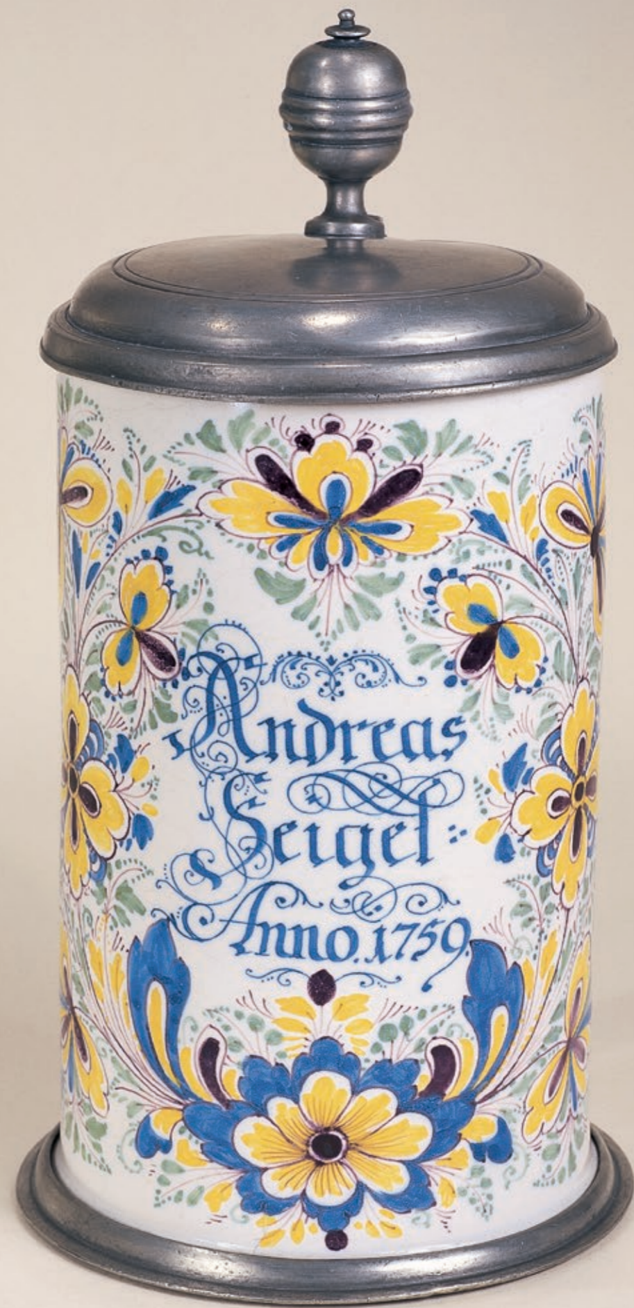
37. Nürnberger Walzenkrug 1759 datiert, der mit bunten Scharfffeuerfarben bemalt ist, H. 24 cm