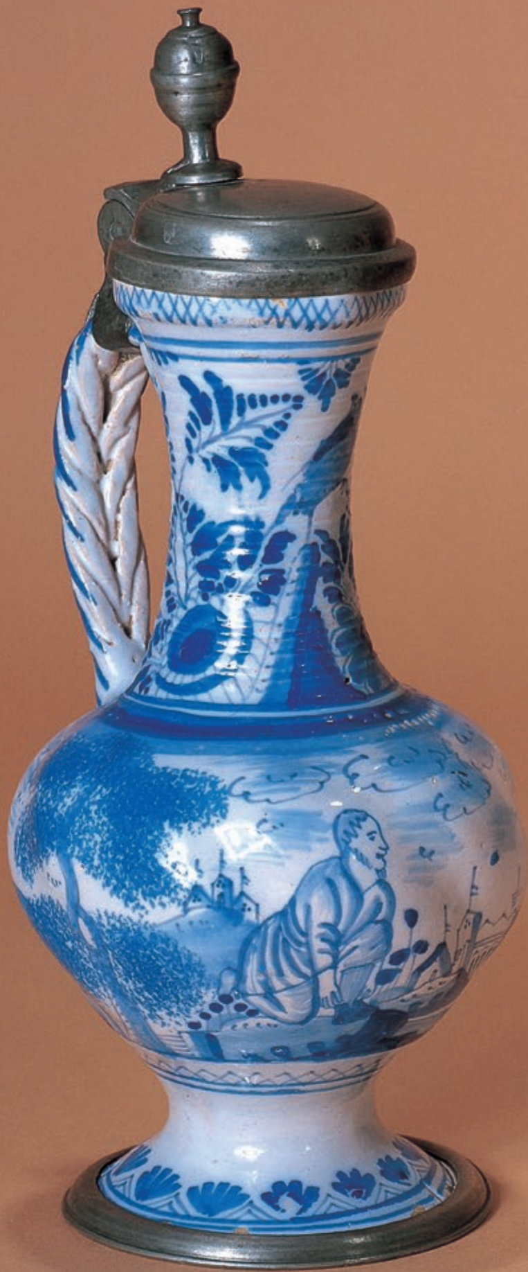
3. Ansbacher Fayenceenghalskrug in feiner blauer Scharfffeuermalerei um 1730, H. 23 cm