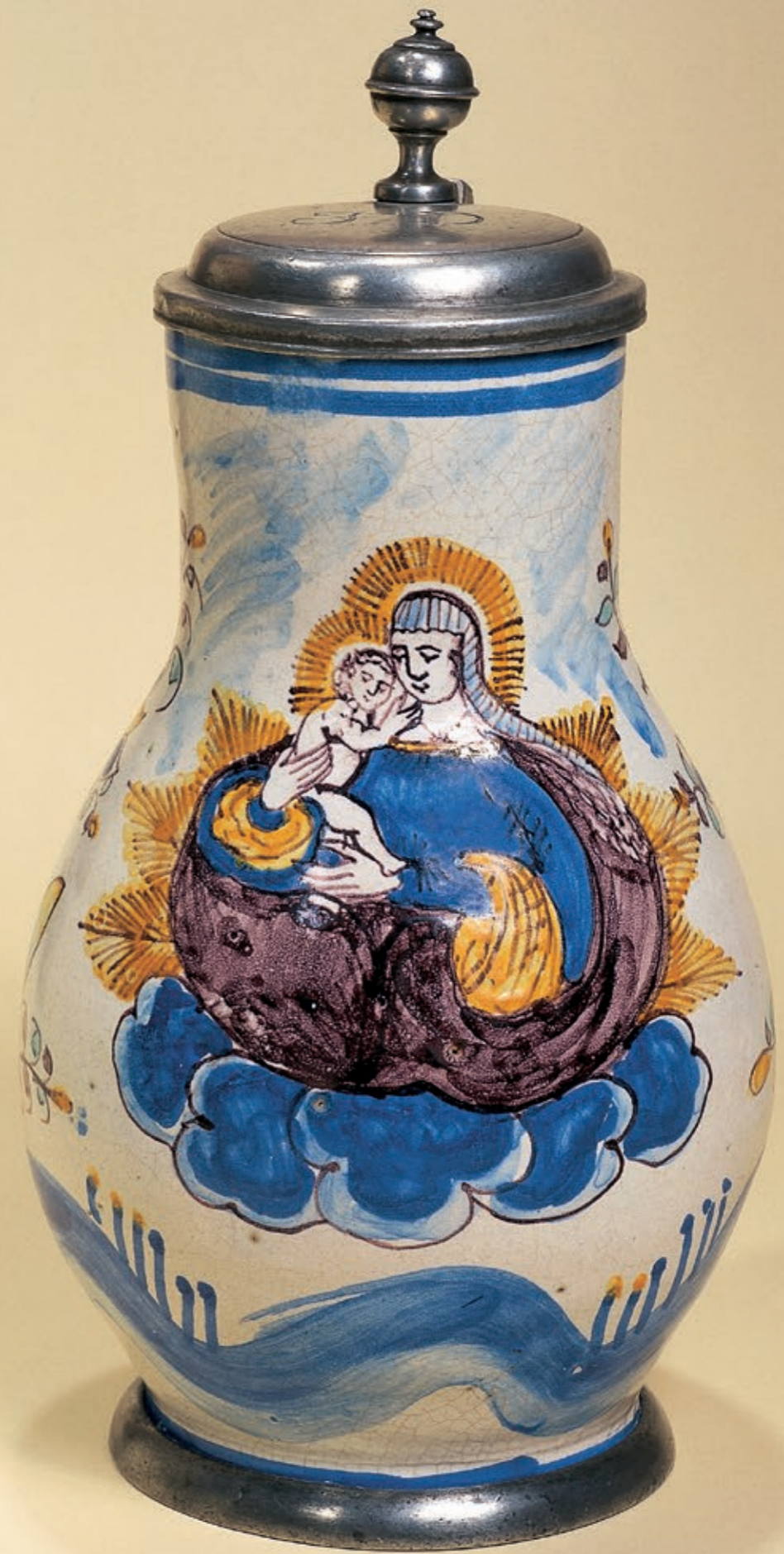
44. Salzburger Fayencebirnkrug aus der Werkstatt Thomas Obermillner um 1690, H. 25 cm