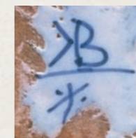
29. Künersberger Fayencebirnkrug um 1750, mit der Manufakturmarke „KB“, H. 17,5 cm