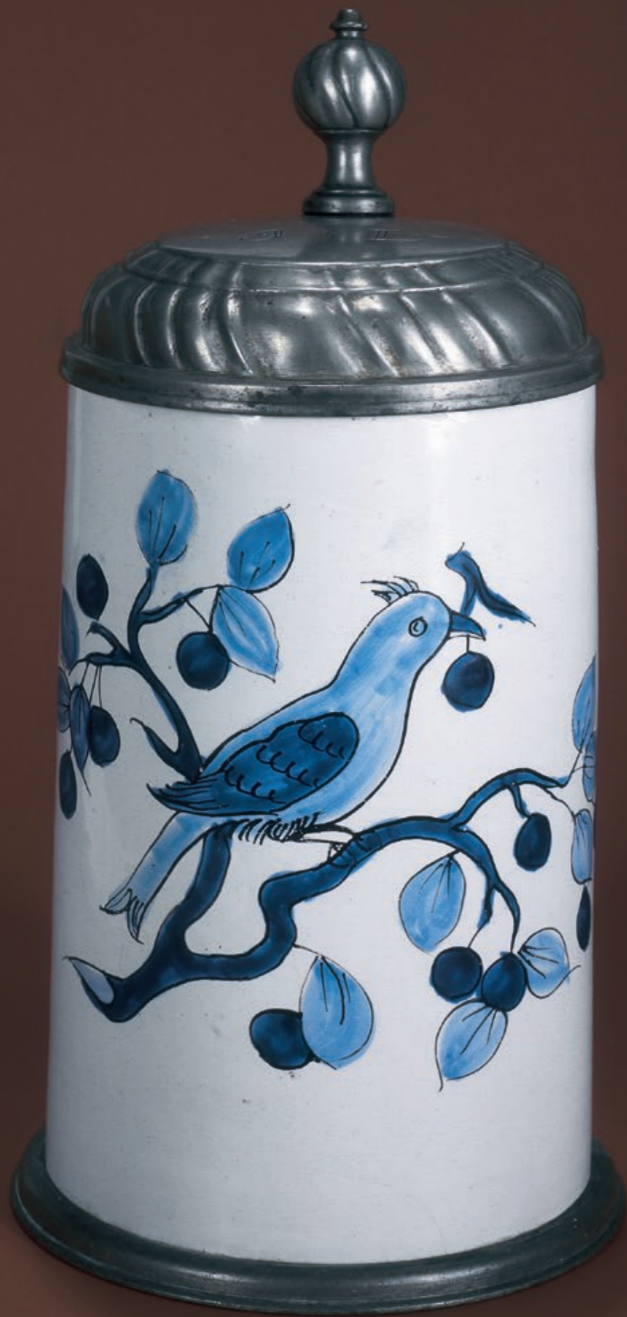
51. Schrezheimer Fayencewalzenkrug in blauer Scharfffeuermalerei um 1770, H. 23 cm