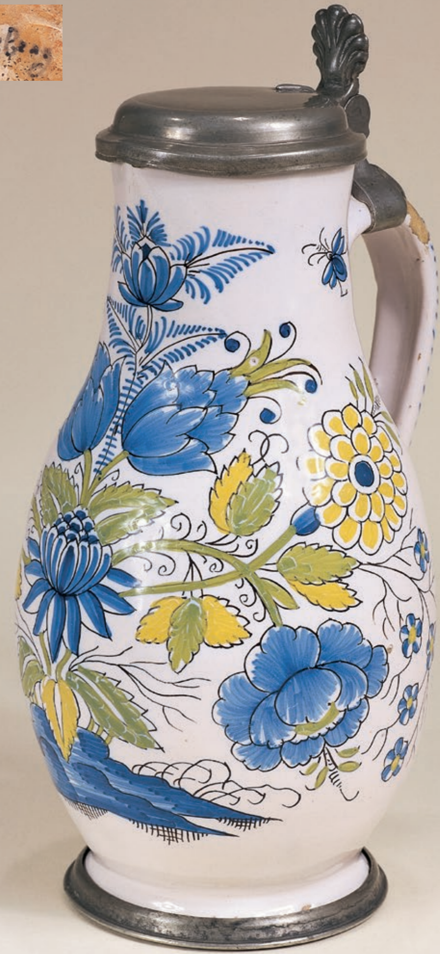
31. Künersberger Fayencebirnkrug um 1750, mit der Marke „Künersberg“, H. 25 cm