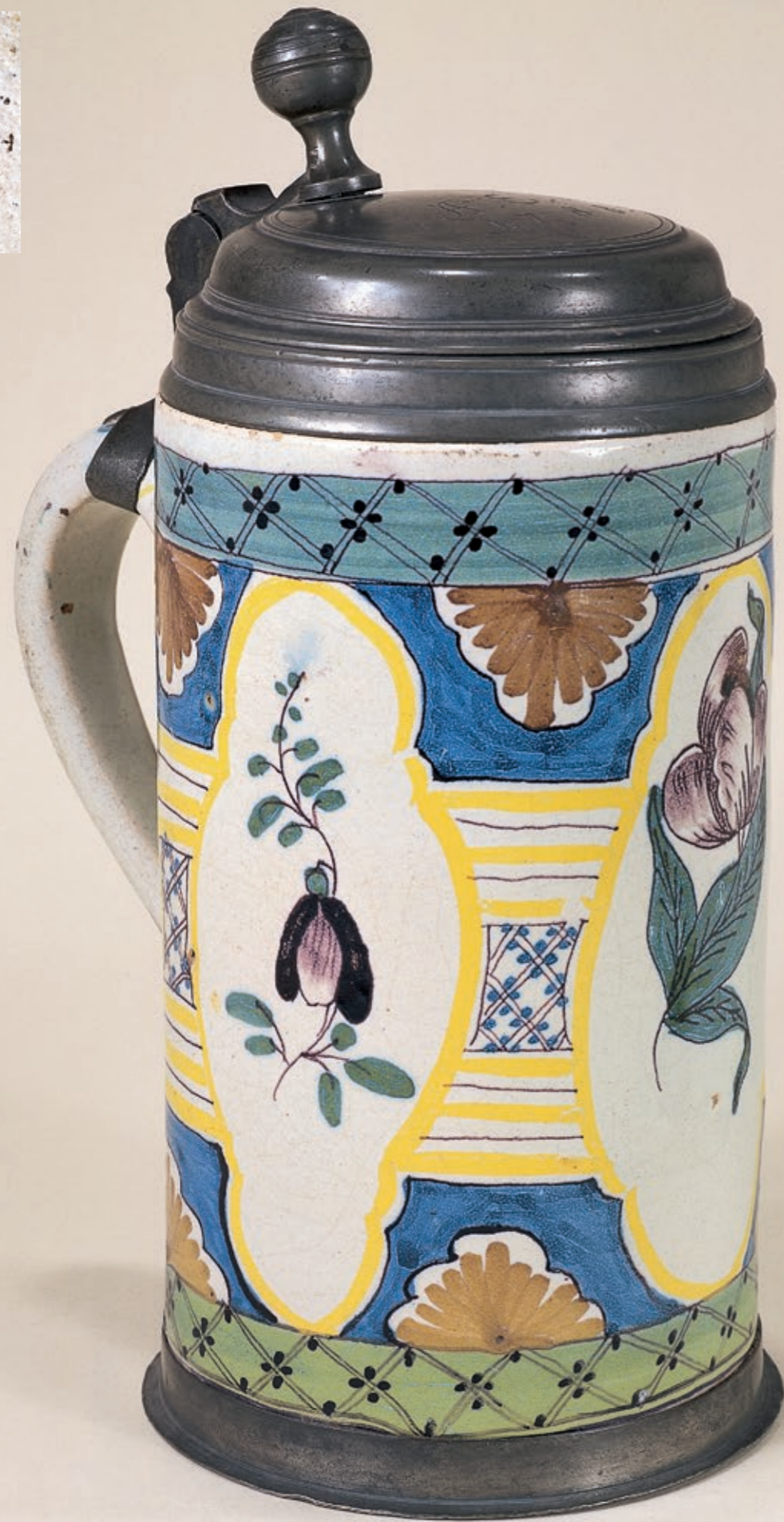
19. Frankfurter (Oder) Fayencewalzenkrug um 1788, mit Manufakturmarke „F/H/1“, H. 26 cm