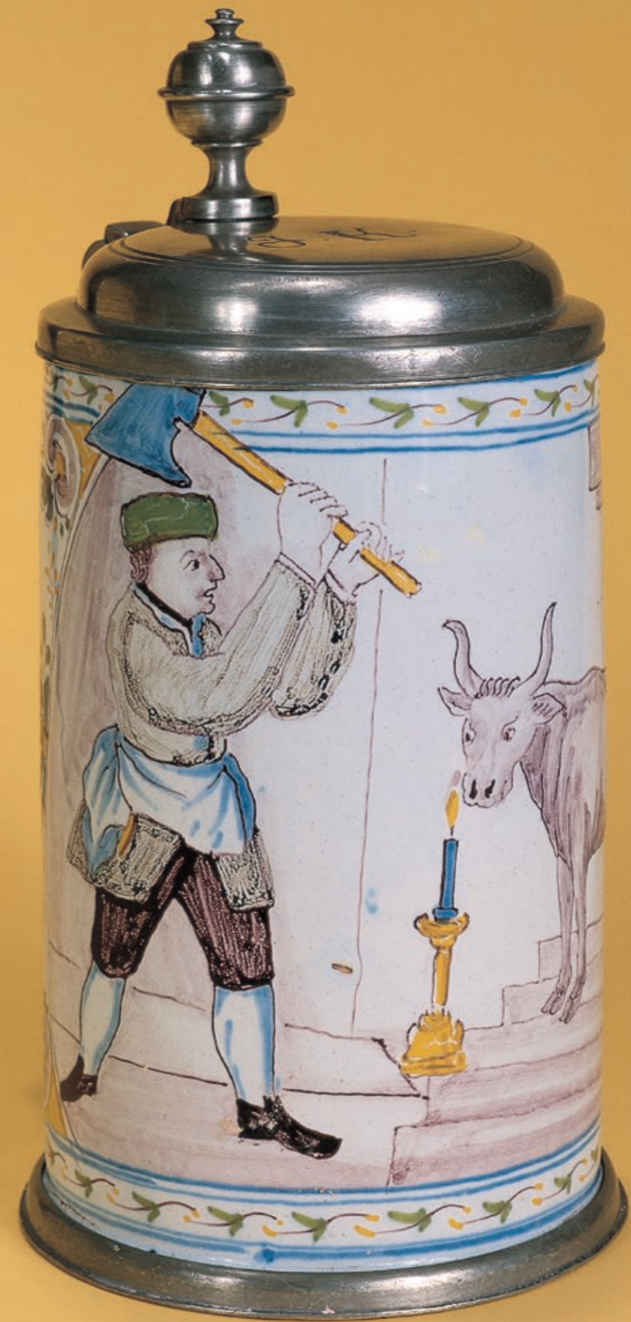
52. Schrezheimer Zunftkrug der Metzger in blauer Scharfffeuermalerei um 1780, H. 22 cm