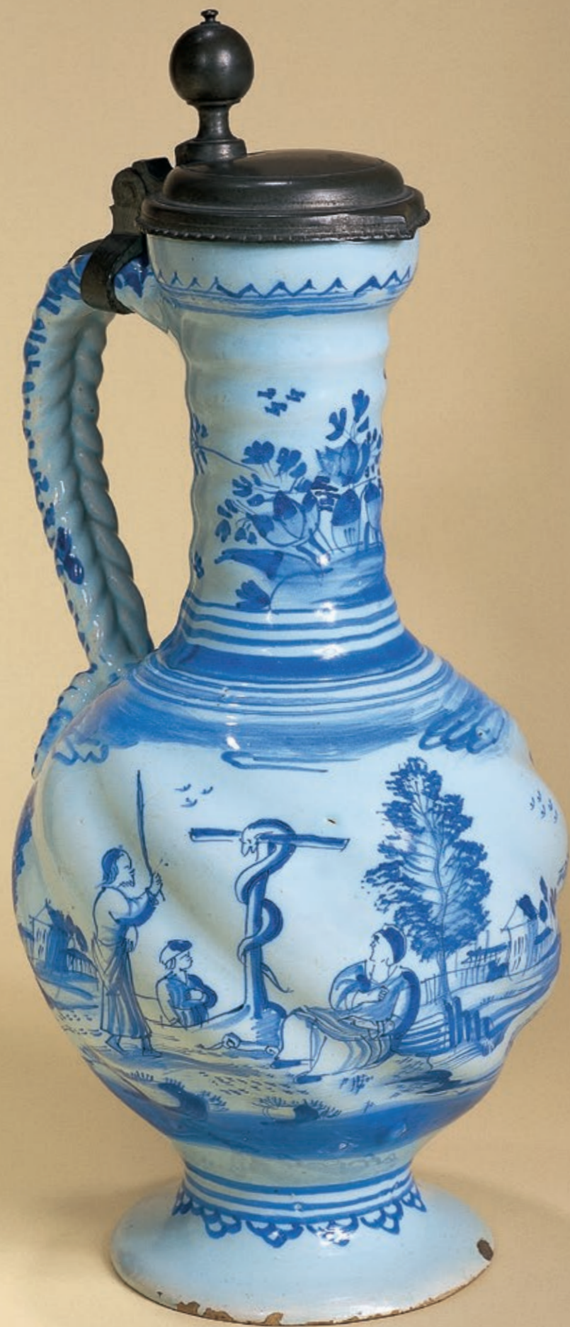
26. Hanauer Fayenceenghalskrug mit zwei biblischen Szenen um 1710, H. 30 cm