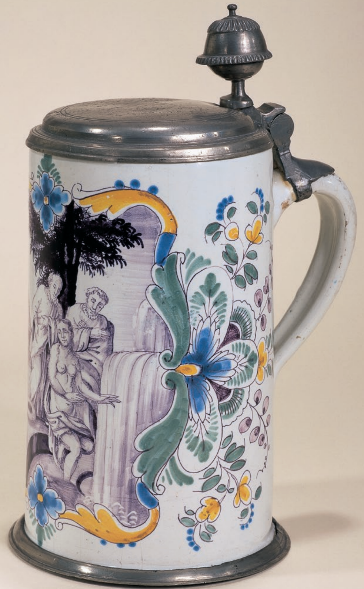
40. Nürnberger Fayence um 1750, mit Malermarke „i“, Nürnberger Zinnmontierung, H. 25 cm