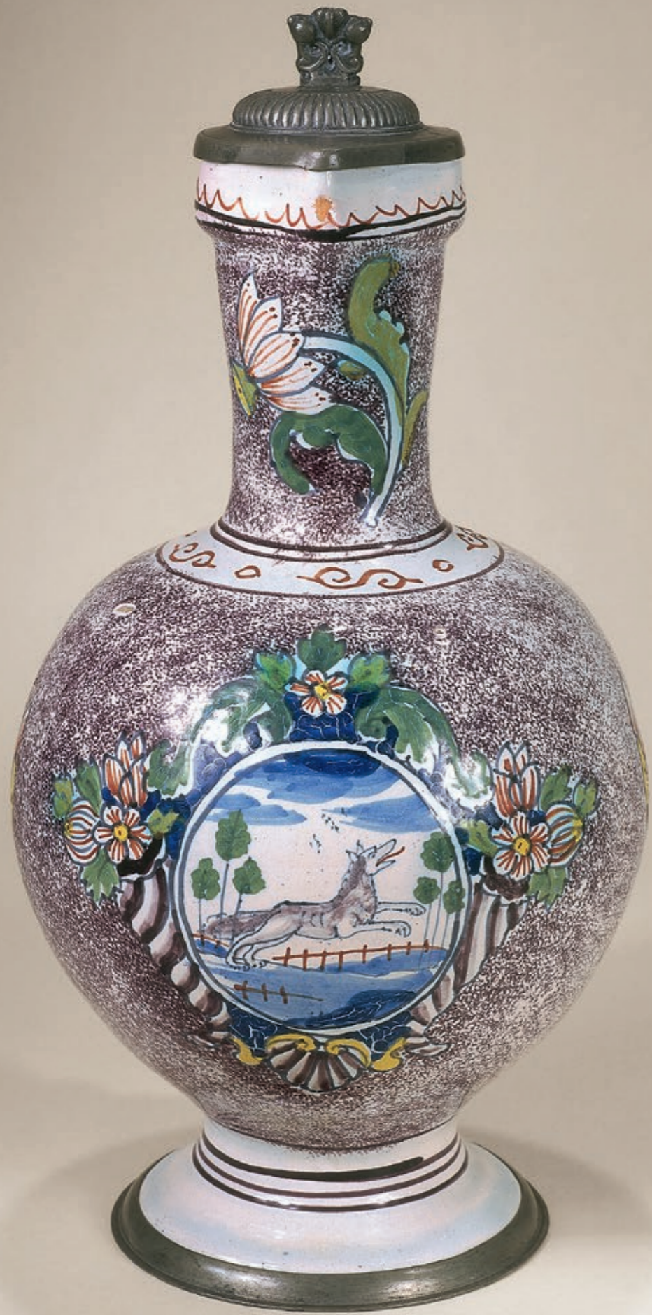
24. Hanauer Fayenceenghalskrug um 1740, der mit bunten Scharfffeuerfarben bemalt ist, H. 30 cm