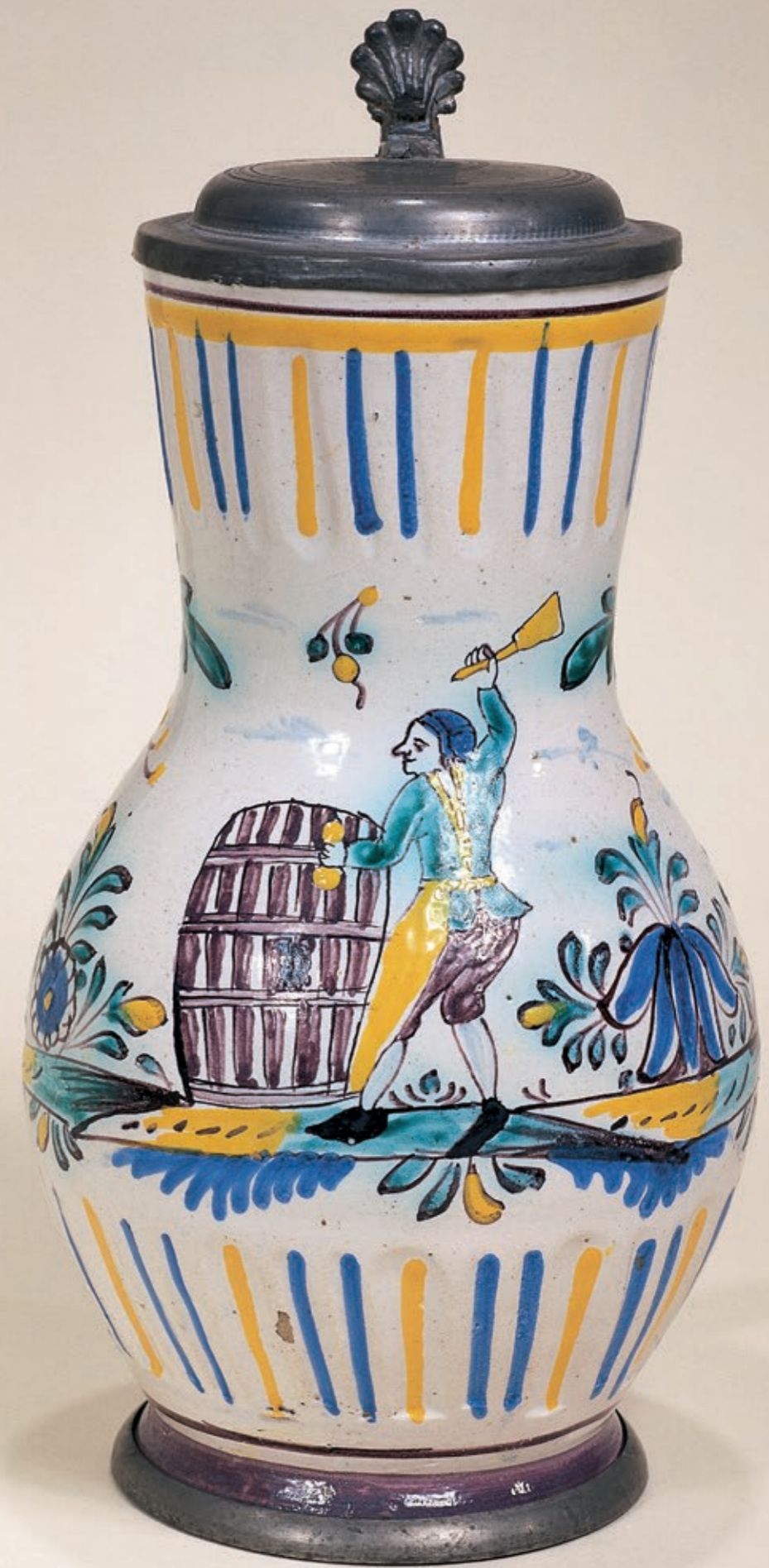
35. Niederösterreichischer Zunftkrug um 1780, mit bunter Scharffeuermalerei, H. 22 cm