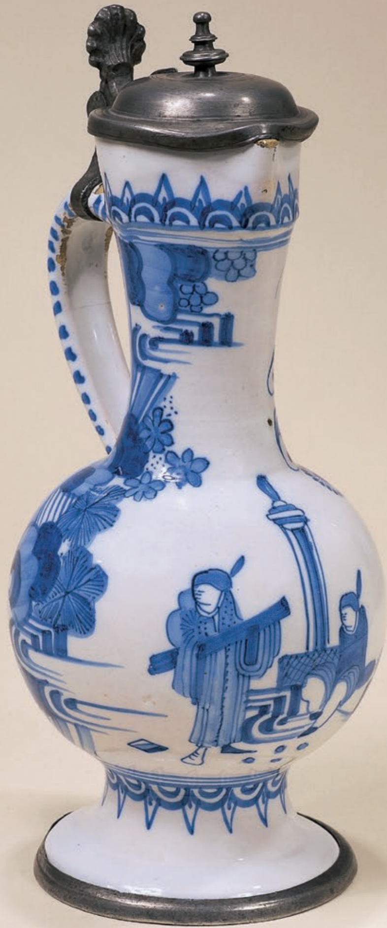
17. Frankfurter Enghalskrug um 1690, mit Chinesen in blauer Scharfffeuermalerei, H. 25 cm