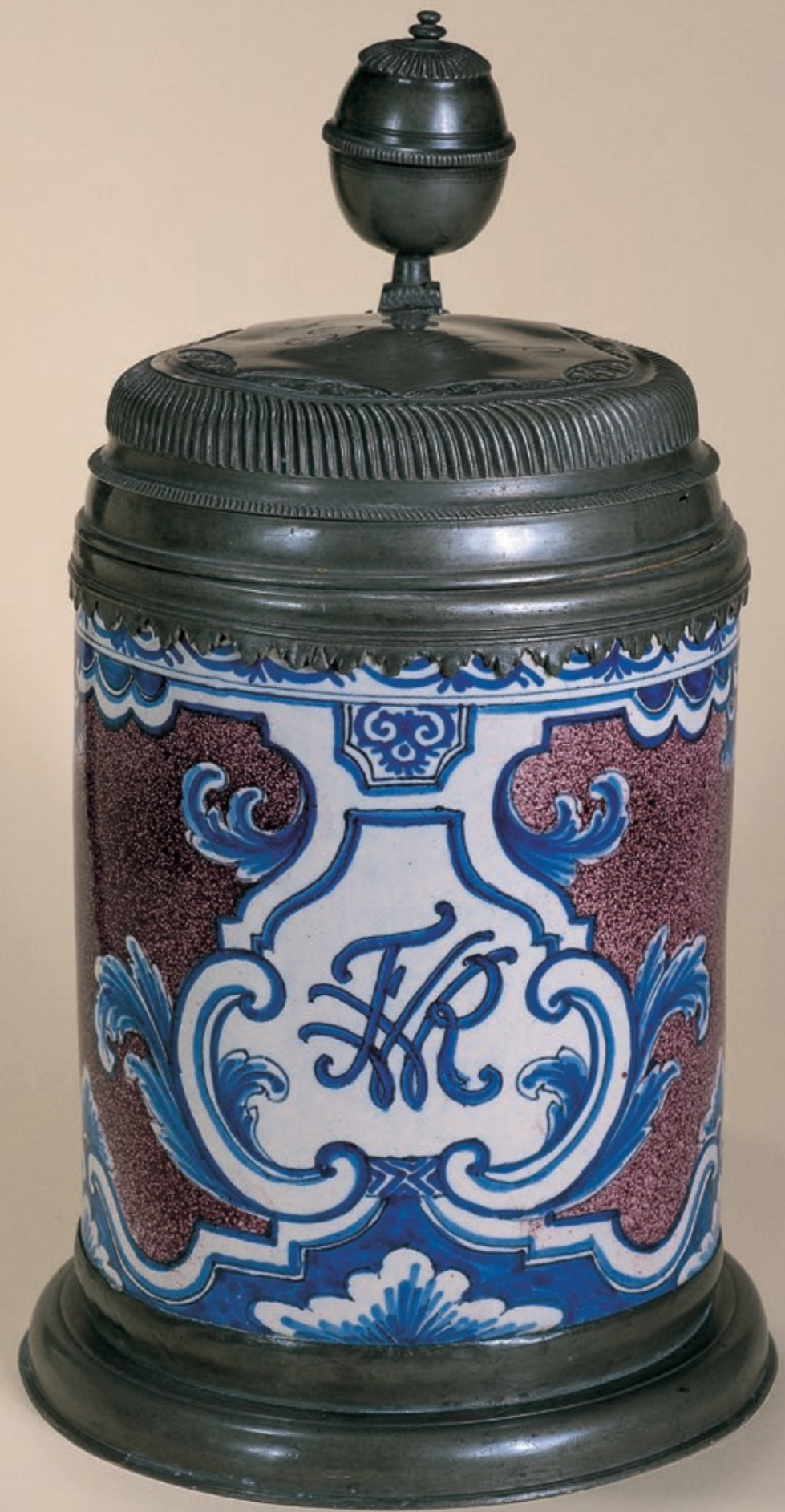
9. Berliner Fayencewalzenkrug um 1720, Manufaktur Gerhard Wolbeer, H. 29 cm