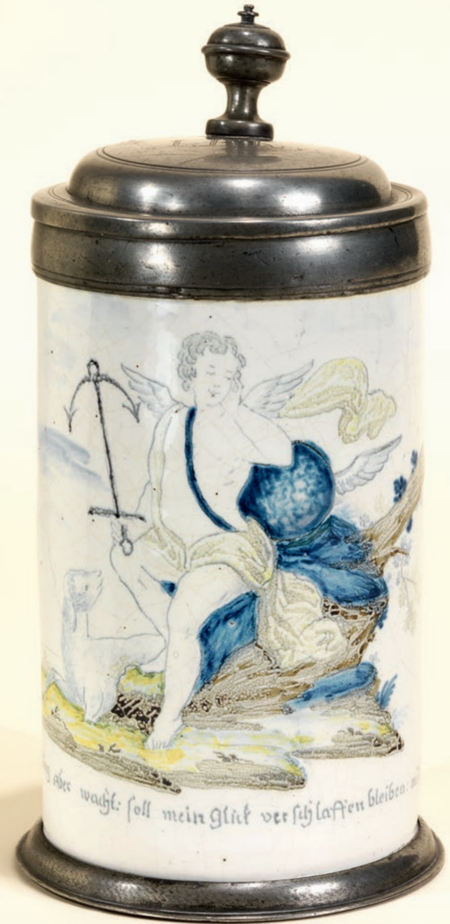
22. Friedberger Fayencekrug um 1760, der mit bunten Scharffeuerfarben bemalt ist, H. 23 cm