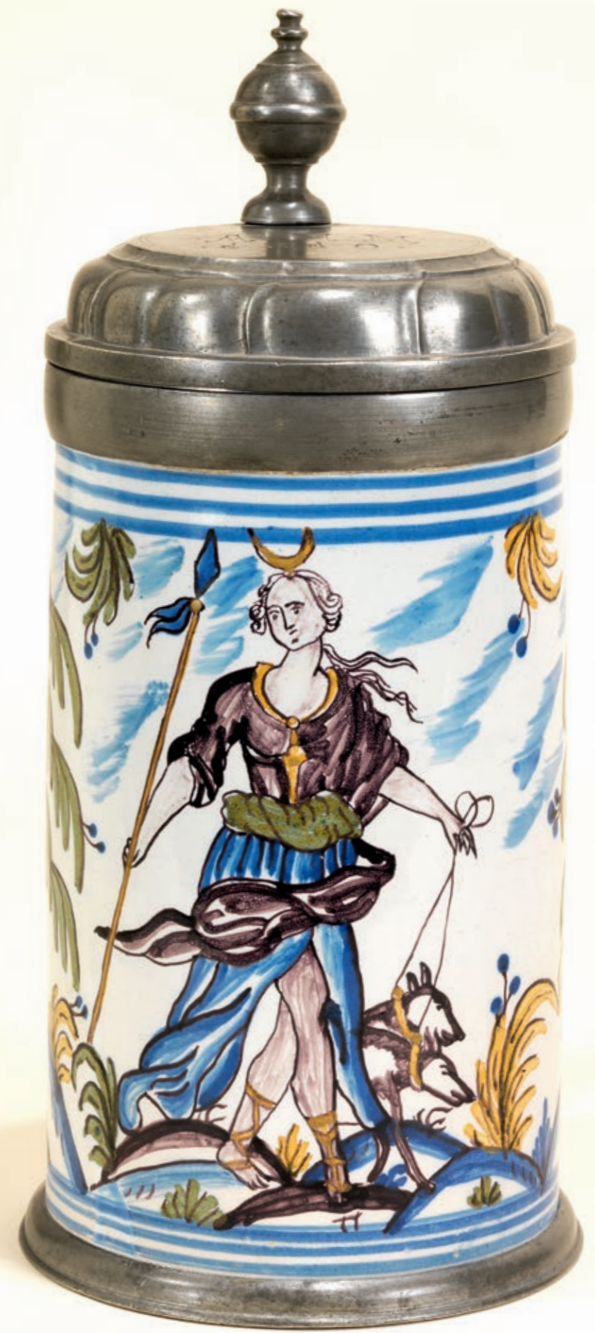
7. Bayreuther Fayencekrug um 1780, der mit bunten Scharfffeuerfarben bemalt ist, H. 26 cm