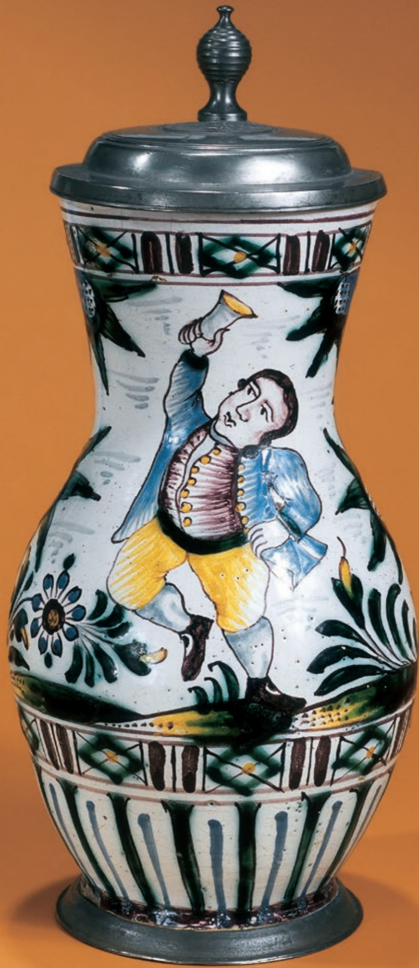
34. Niederösterreichischer Fayencebirnkrug um 1780, Malermarke „I P“, H. 24 cm