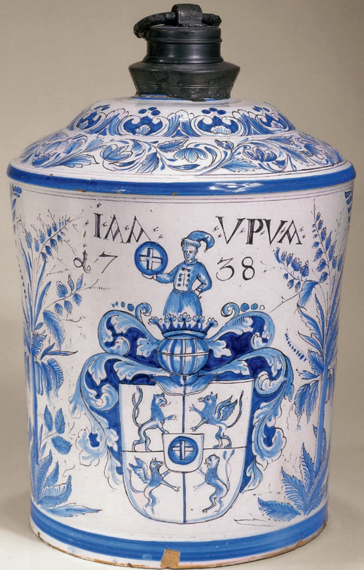
32. Niederösterreichische Fayenceflasche 1738 datiert, mit Scharfffeuermalerei, H. 36 cm