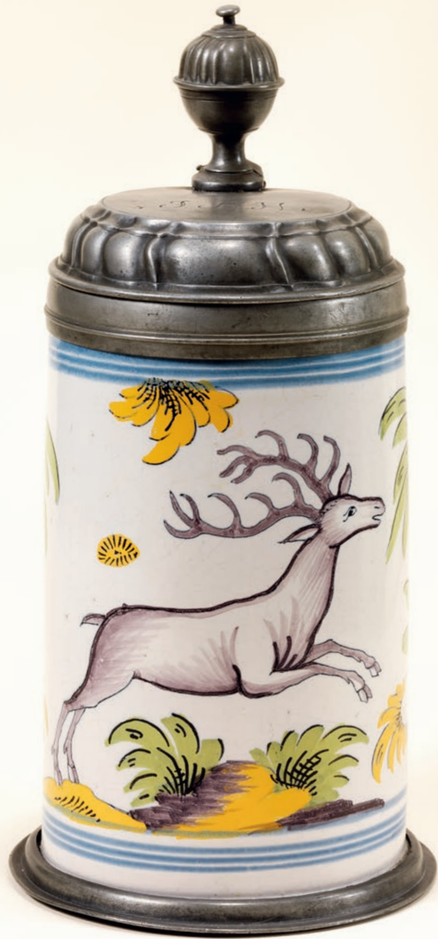
6. Bayreuther Jagdkrug um 1760, auf dem Boden die Manufakturmarke „BPF“, H. 25 cm