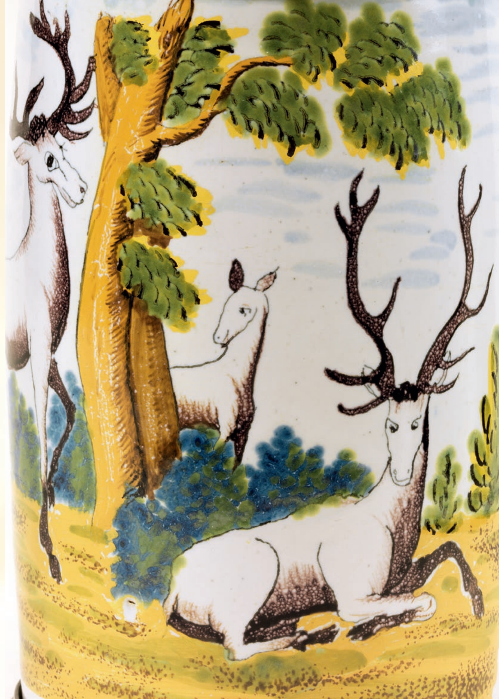
11. Crailsheimer Hirschjagdkrug der „Gelben Familie“ in Scharfffeuermalerei um 1790, H. 23 cm