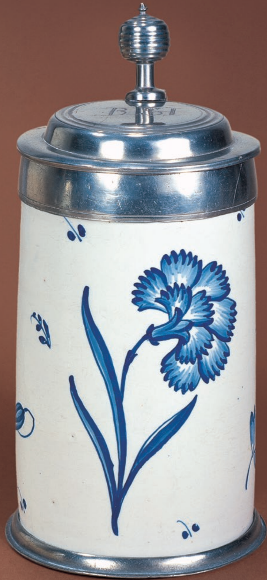
46. Schrattenhofener Fayencewalzenkrug in blauer Scharfffeuermalerei um 1770, H. 23 cm