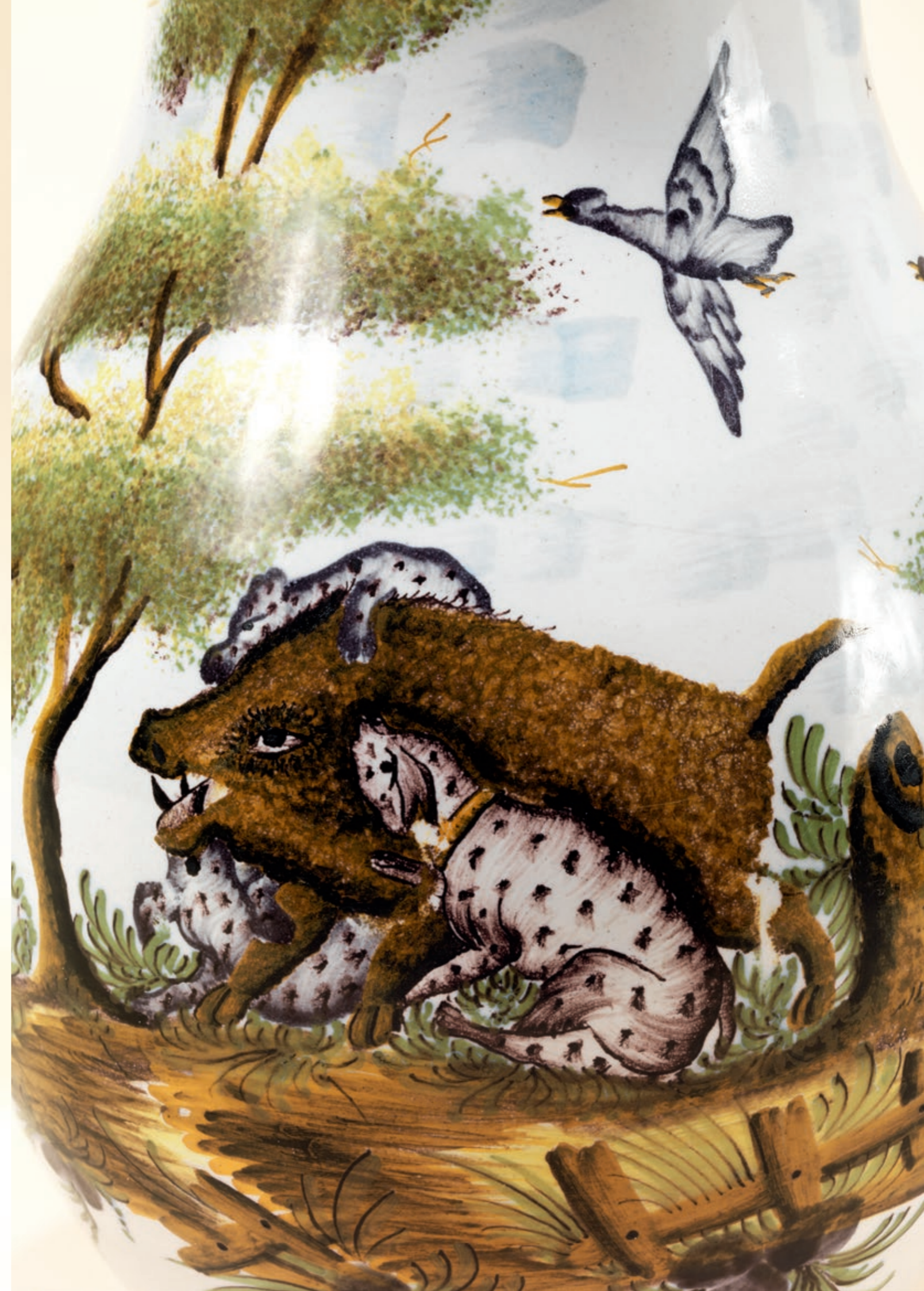
27. Kelsterbacher Wildschweinjadtkrug um 1770, mangane Manufakturmarke „HD“, H. 32 cm