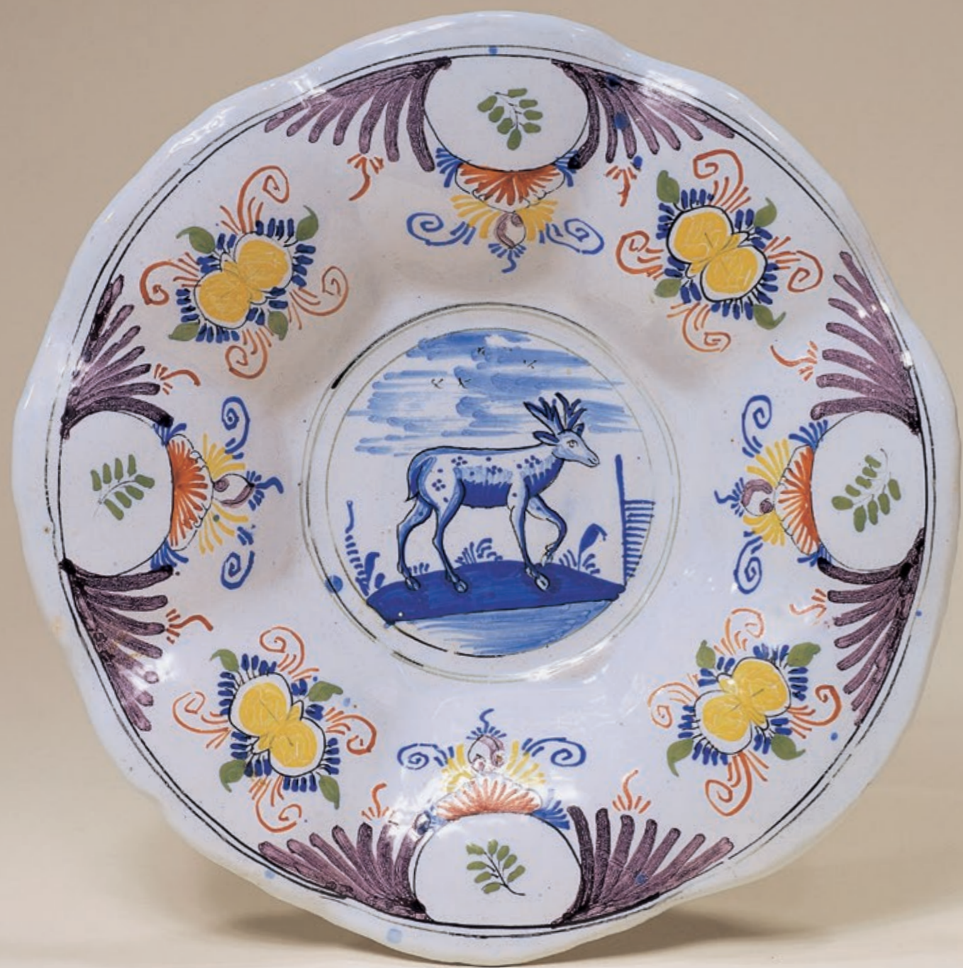
13. Dorotheenthaler Fayenceplatte um 1740, die mit Scharfffeuerfarben bemalt ist, D. 25 cm