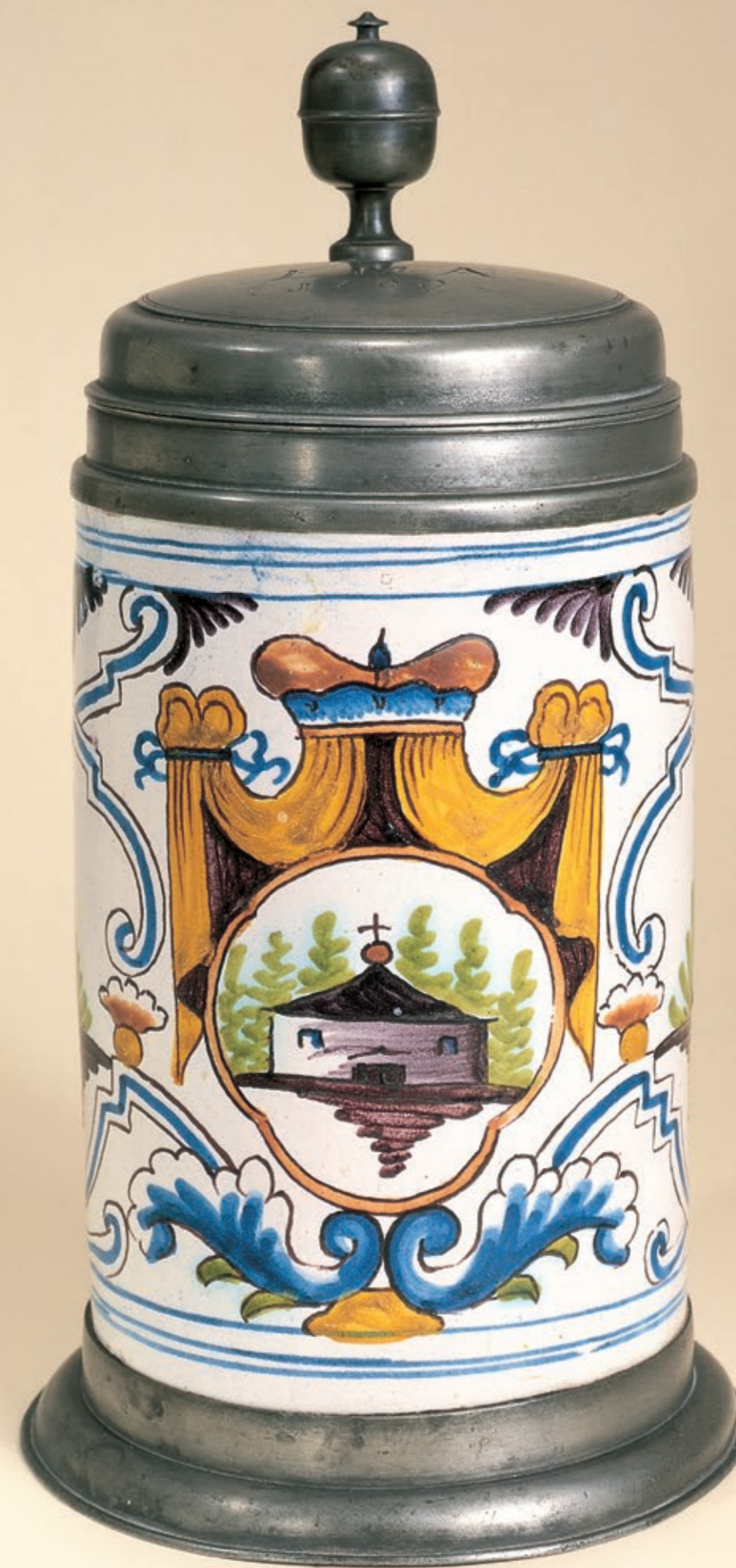
14. Dresdener Fayencewalzenkrug 1799 datiert, Manufaktur Messerschmidt, H. 29 cm