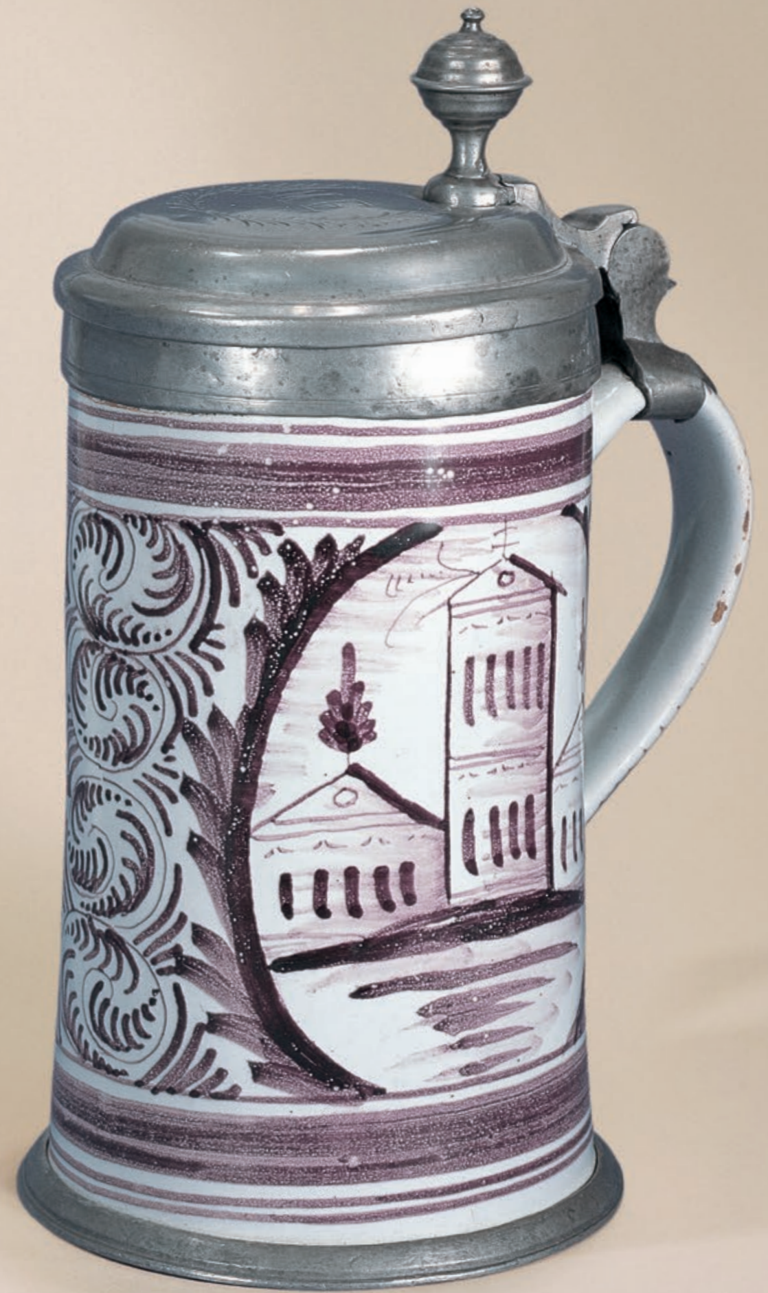
47. Schrattenhofener Fayencewalzenkrug in manganer Scharfffeuermalerei um 1780, H. 22 cm