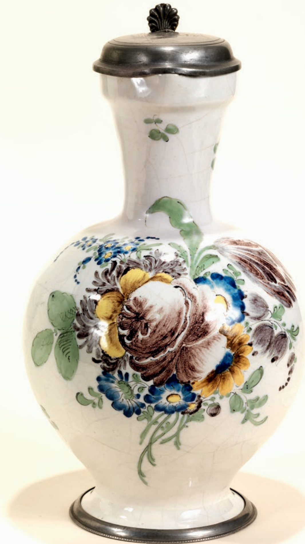
16. Flörsheimer Enghalskrug um 1780, auf dem Boden die Manufakturmarke „FFF“, H. 31 cm