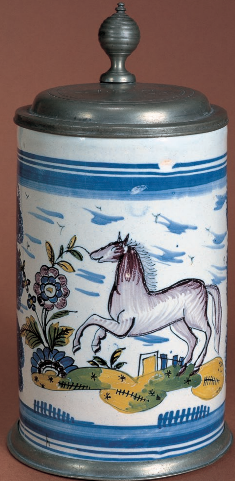
50. Schrattenhofener Fayencewalzenkrug in bunter Scharfffeuermalerei um 1770, H. 23 cm