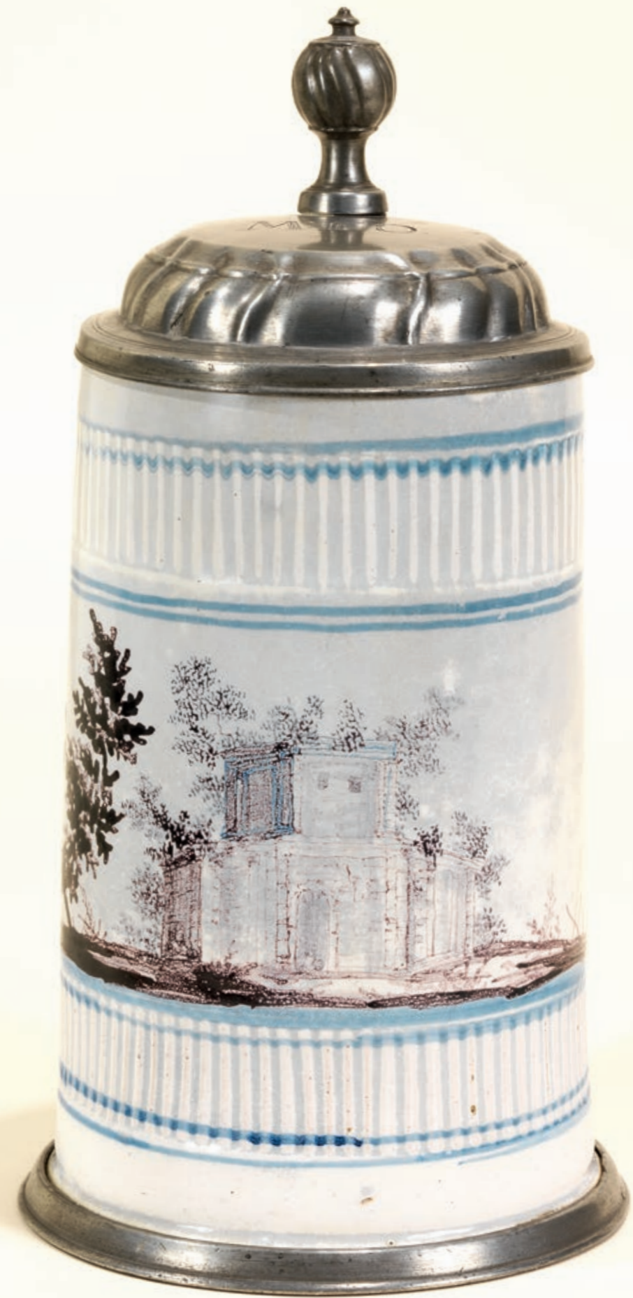
2. Amberger Fayencewalzenkrug um 1770, manganene Manufakturmarke „AB“, H. 23 cm