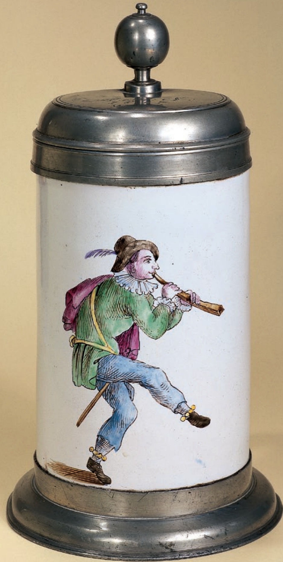
41. Proskauer Musikantenkrug um 1827, der mit bunten Muffelfarben bemalt ist, H. 24 cm Publiziert: Renate Scholz, Humpen und Krüge: Trinkgefäße 16. bis 20. Jh., Seite 100