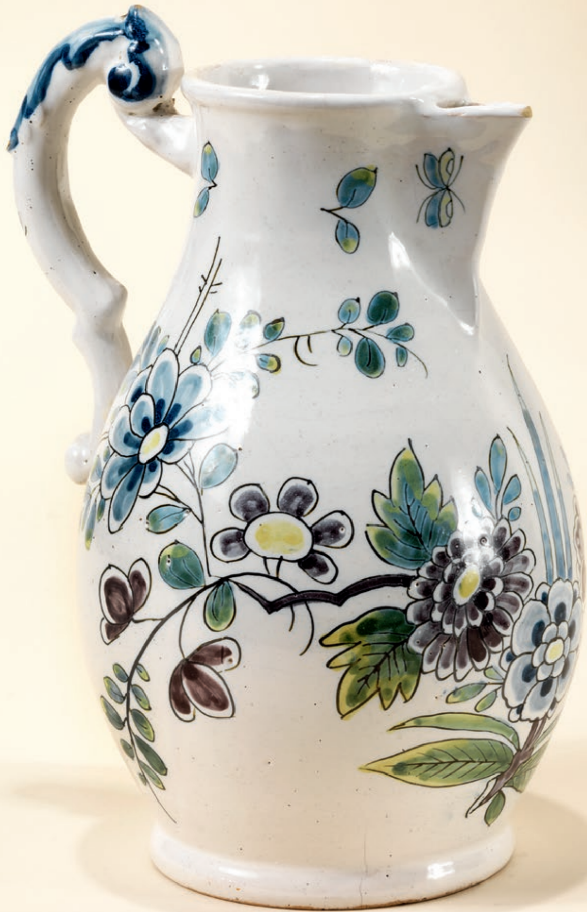
21. Friedberger Kaffeekanne um 1756, die mit bunten Scharffeuerfarben bemalt ist, H. 21 cm