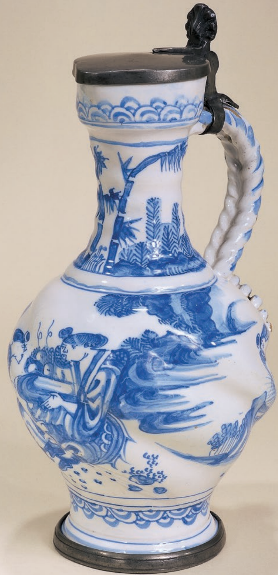
18. Frankfurter Enghalskrug um 1680, mit Chinesen in blauer Scharfffeuermalerei, H. 27 cm