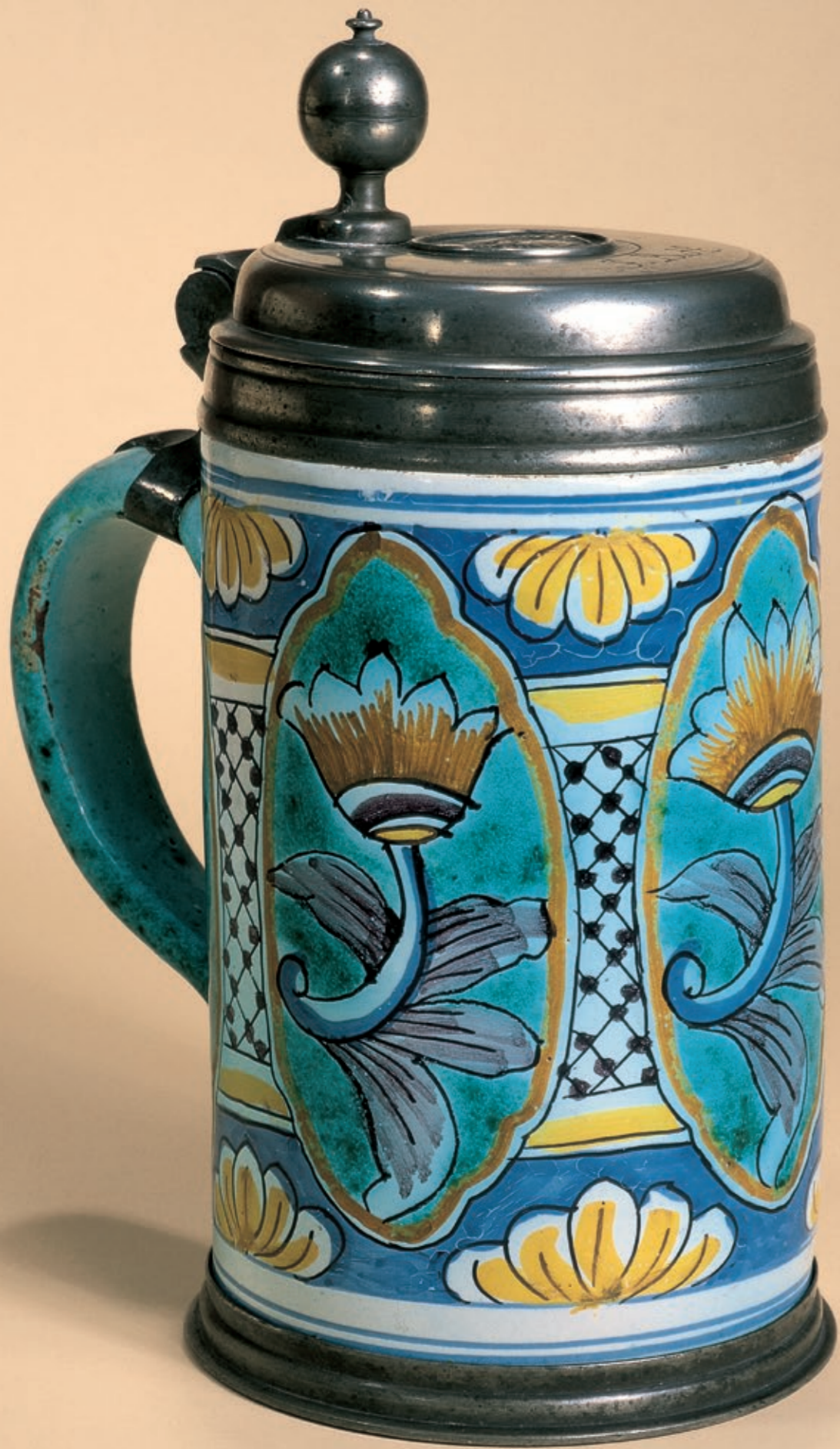
8. Berliner Pilasterkrug um 1730, Manufaktur Cornelius Funcke, H. 25 cm