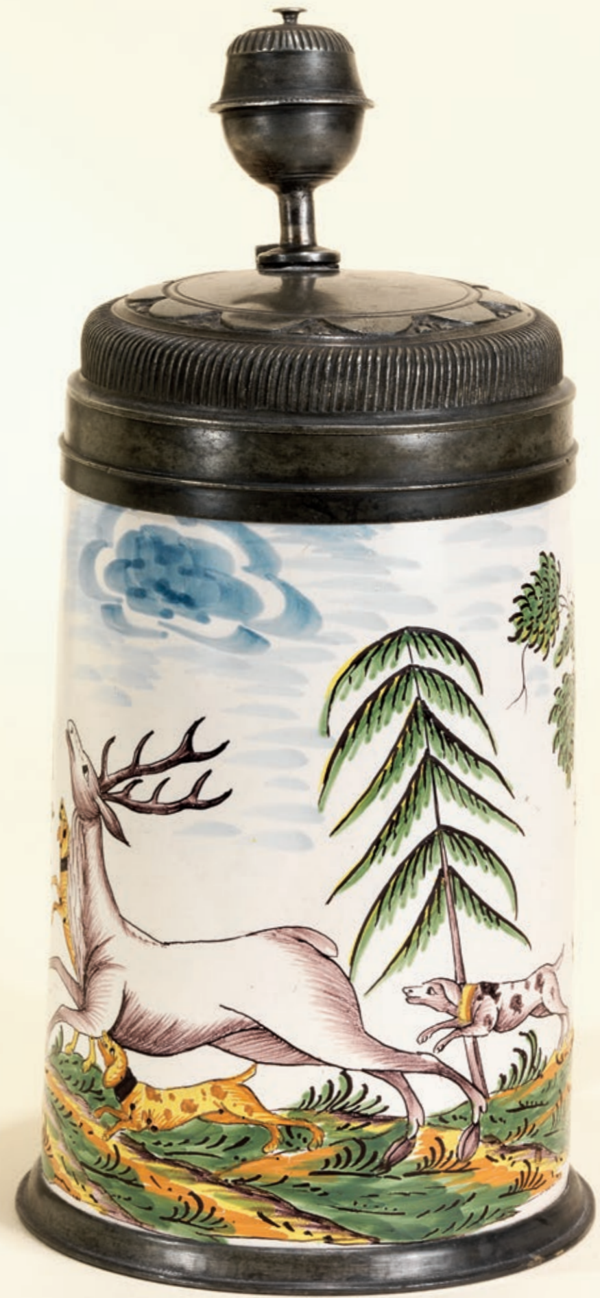
10. Crailsheimer Hirschjagdkrug um 1775, der mit bunten Scharfffeuerfarben bemalt ist, H. 25 cm