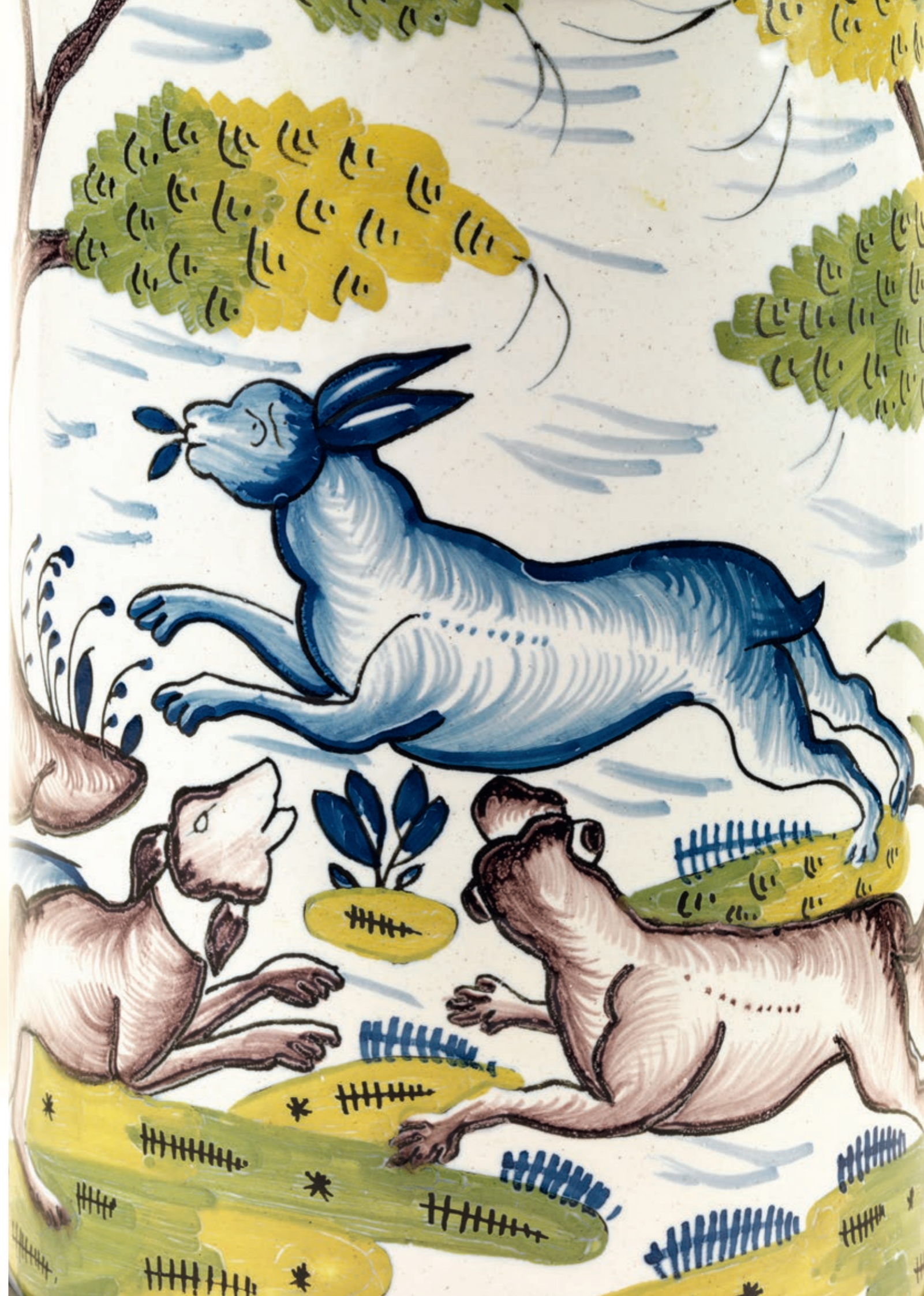
48. Schratthofener Hasenjagdkrug um 1770, der mit Scharfffeuerfarben bemalt ist, H. 23 cm