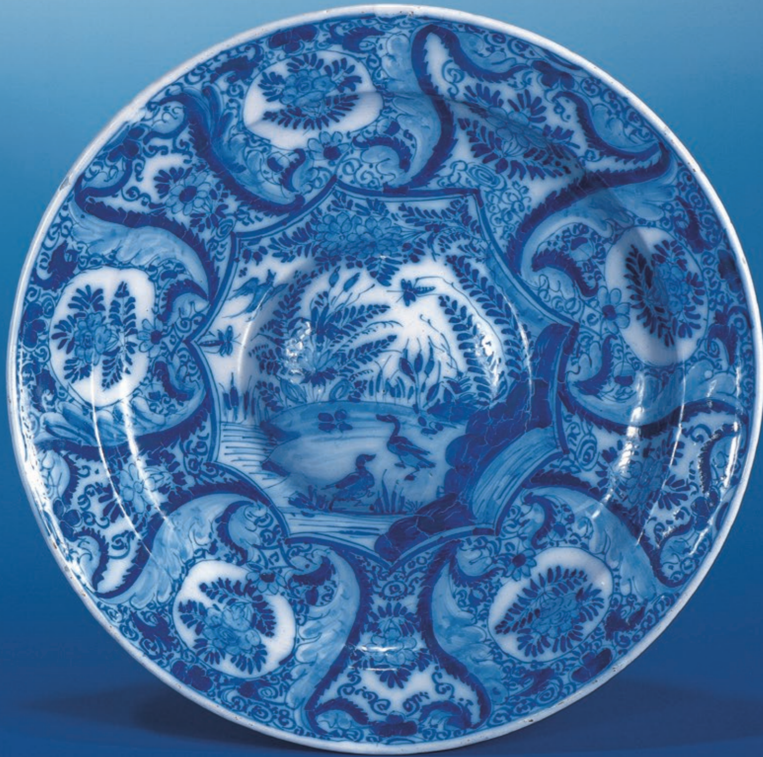
38. Nürnberger Fayencebuckelplatte in blauer Scharfffeuermalerei um 1730, D. 35 cm