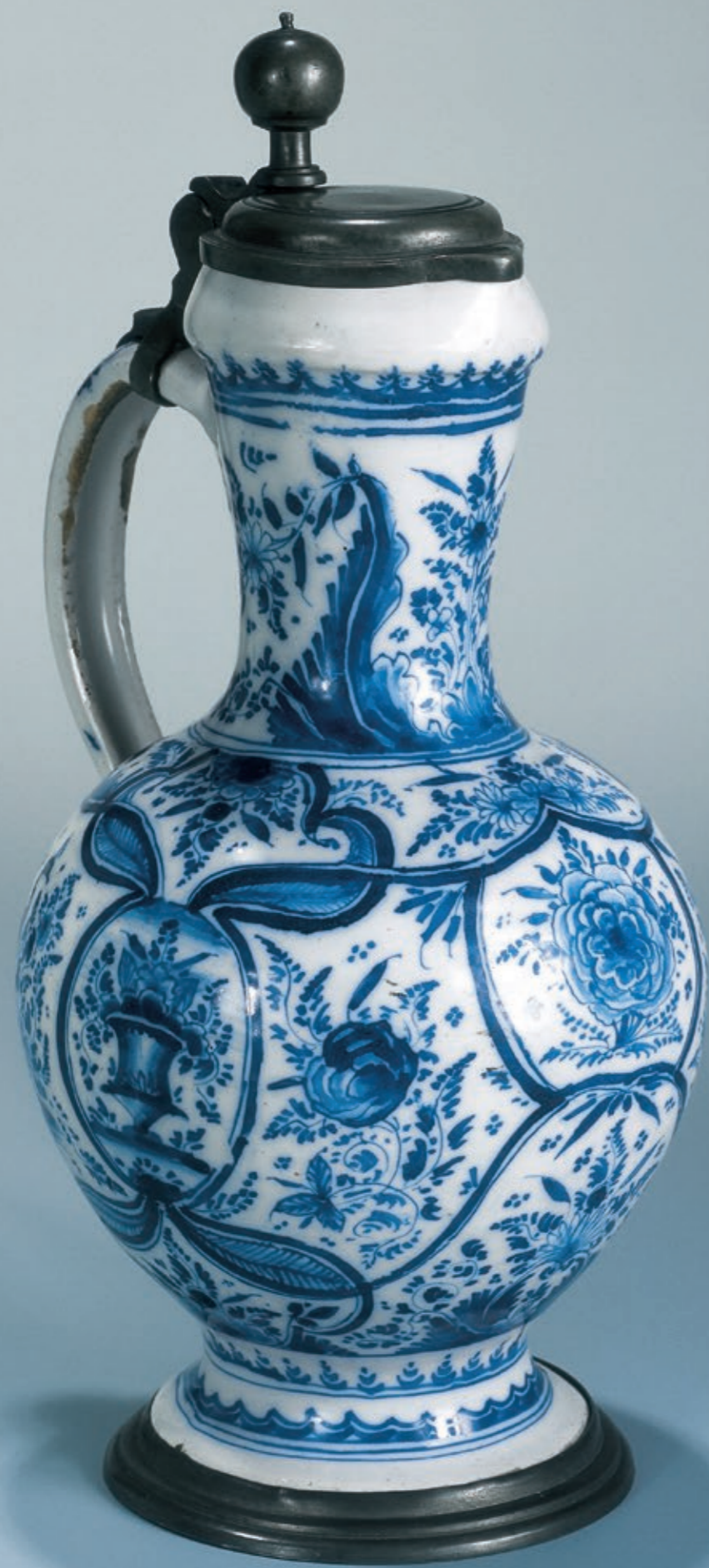
36. Nürnberger Fayenceenghalskrug in blauer Scharfffeuermalerei um 1730, H. 28 cm