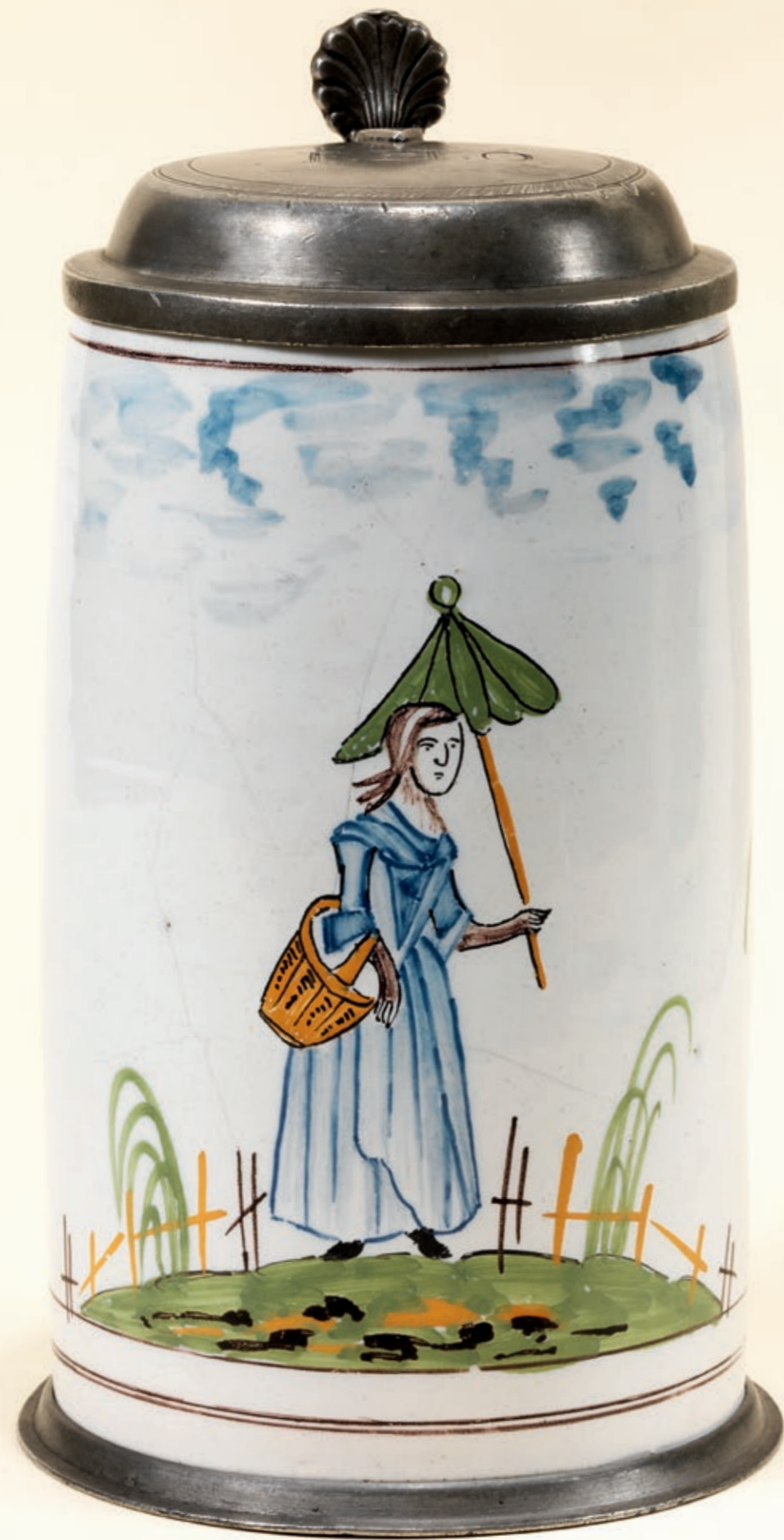
15. Flörsheimer Walzenkrug um 1780, auf dem Boden die Manufakturmarke „FFF“, H. 21 cm