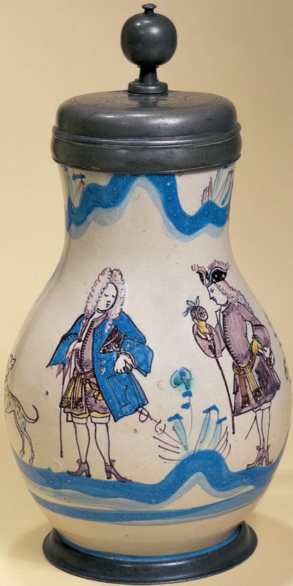
43. Salzburger Fayencebirnkrug aus der Werkstatt Thomas Obermillner um 1680, H. 26 cm