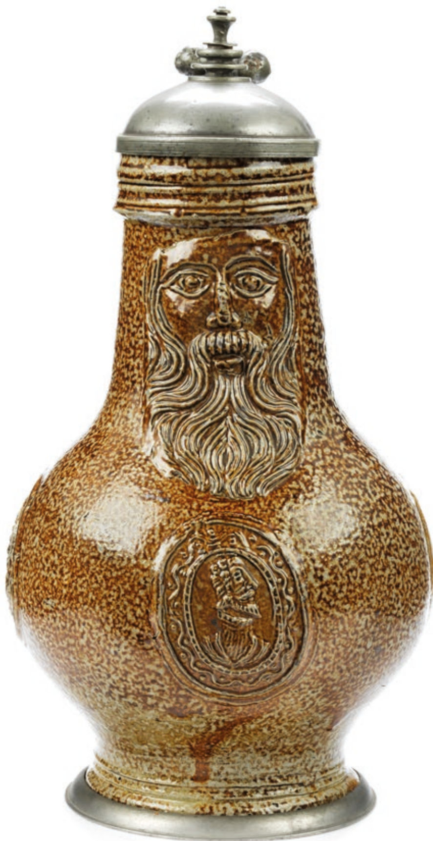
39. Kölner Bartmannskrug um 1580, der mit Reliefaufgaben verziert ist, H. 24 cm