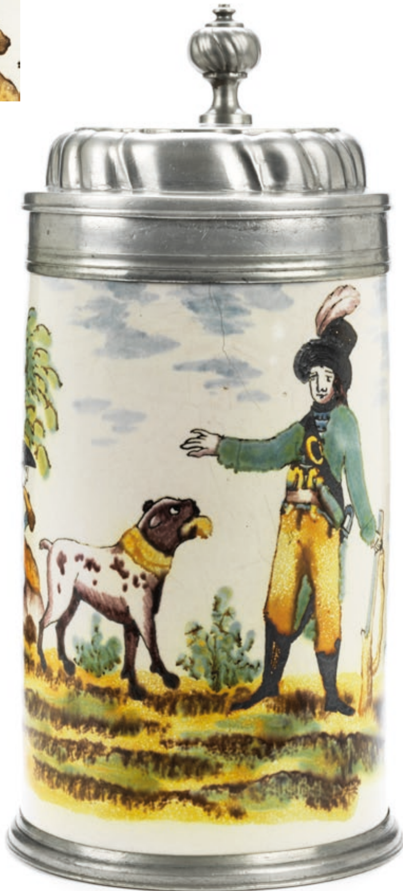
5. Crailsheimer Jagdkrug um 1800, der „Gelben Familie“ in Scharfffeuermalerei, H. 24 cm