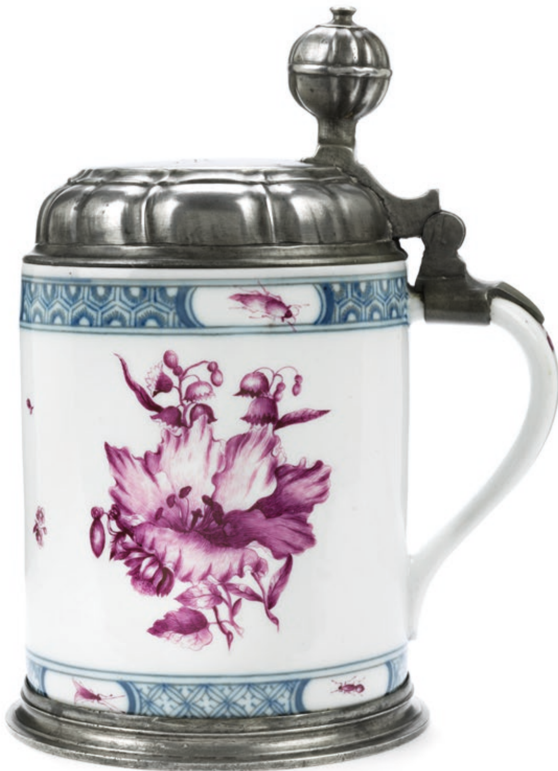
32. Meißeener Porzellanhumpen um 1740, auf dem Boden blaue Schwertermarke, H. 20 cm