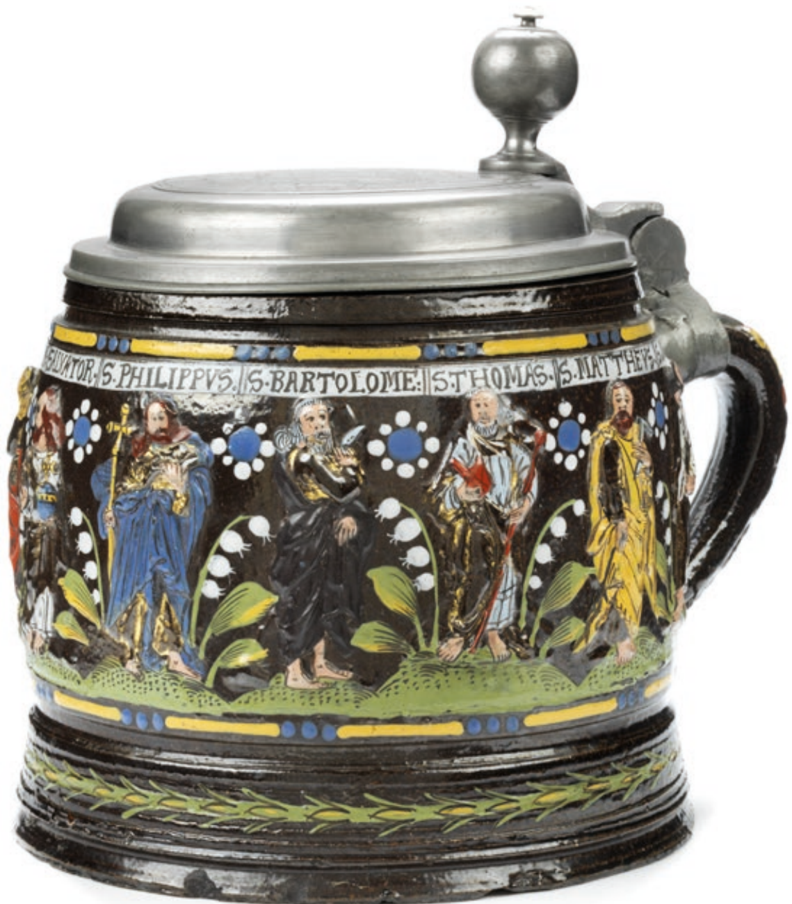
36. Creußener Apostelkrug 1661 datiert, der mit bunten Emailfarben bemalt ist, H. 17 cm