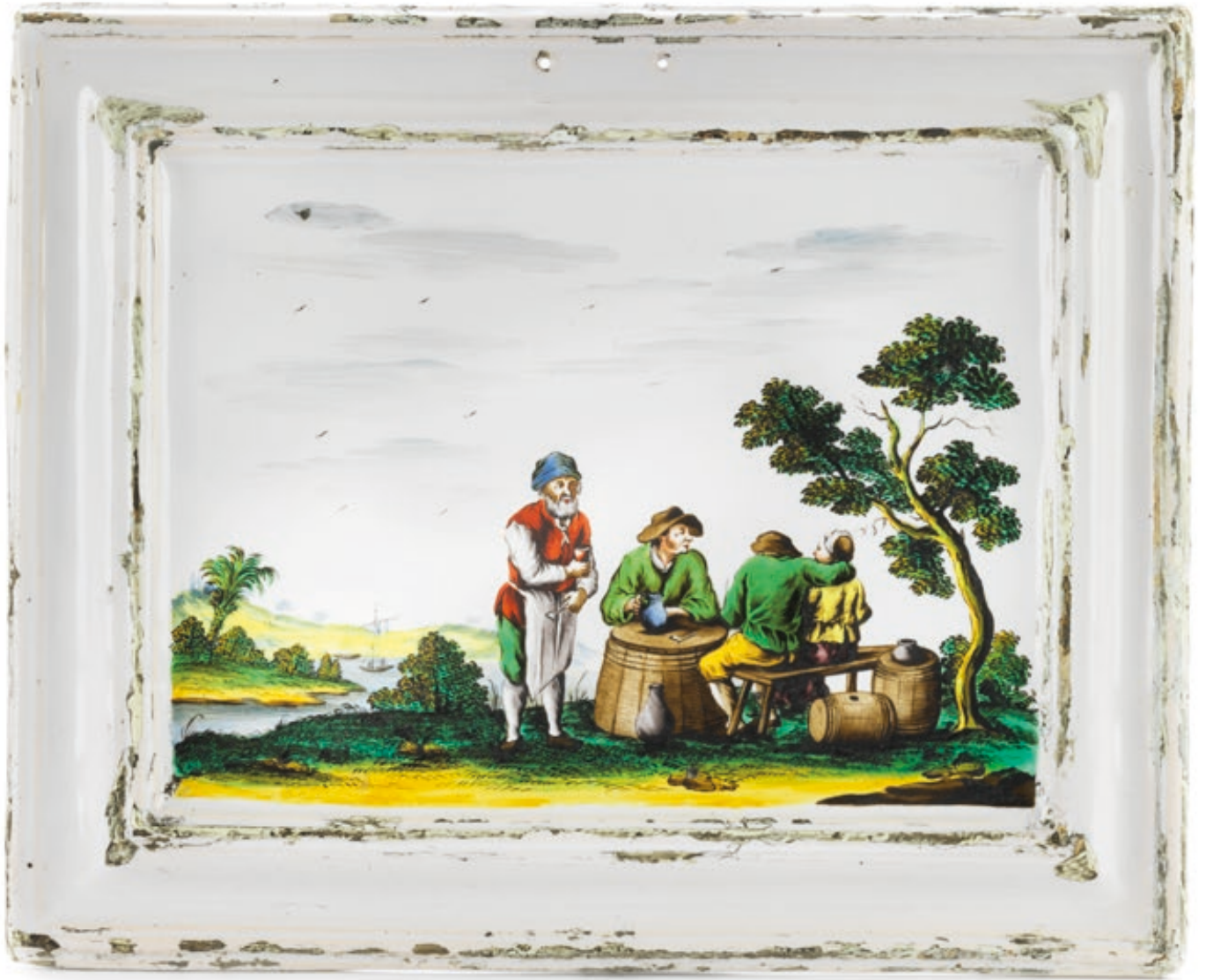
16. Künersberger Bildplatte um 1750, die in Augsburg von einem Hausmaler mit bunten Muffelfarben bemalt wurde, H. 23 cm und B. 28 cm