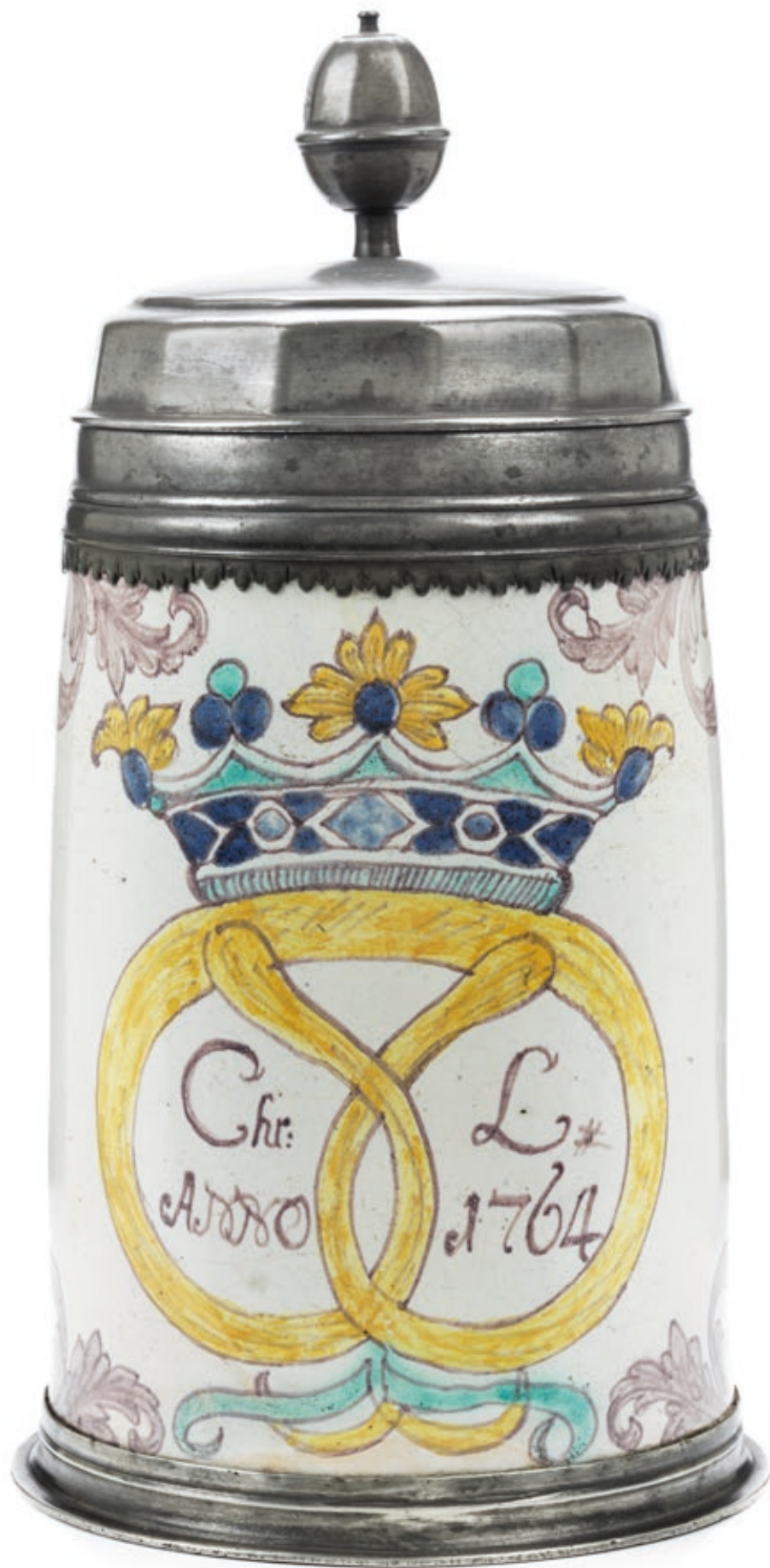
23. Norddeutscher Bäckerkrug 1764 datiert, der mit bunten Scharfffeuerfarben bemalt ist, H. 27 cm