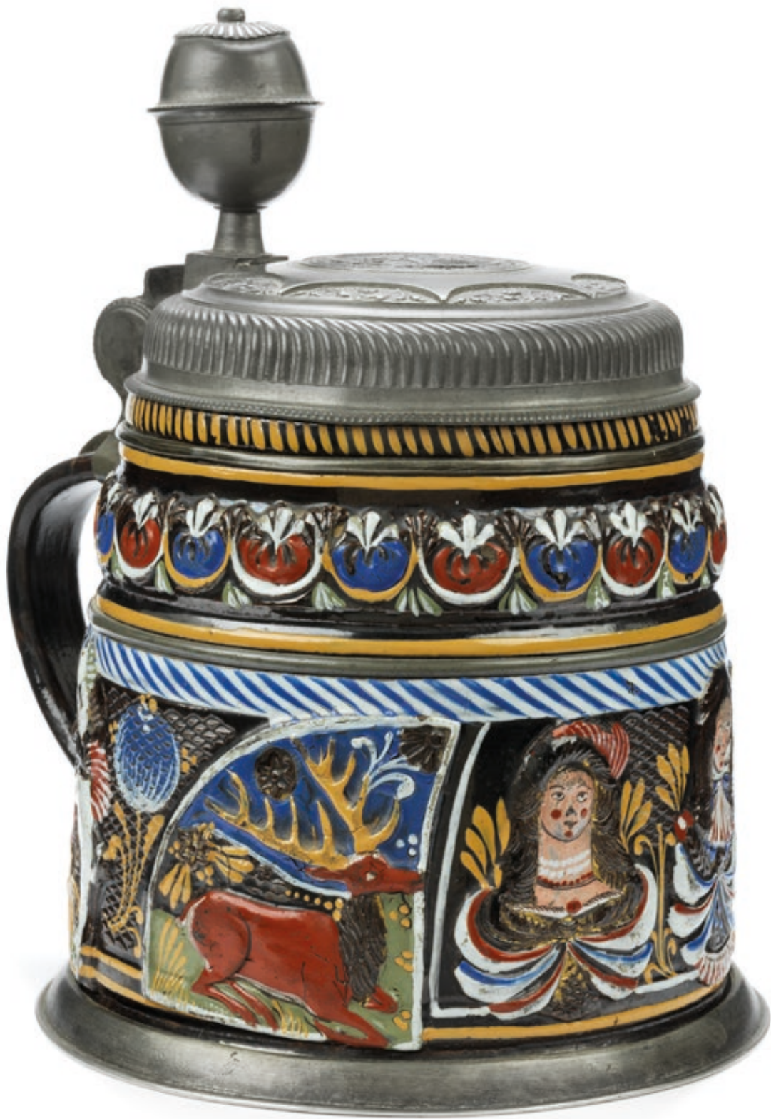
37. Dippoldiswalder Jagdhumpen um 1680, der mit bunten Emailfarben bemalt ist, H. 21 cm