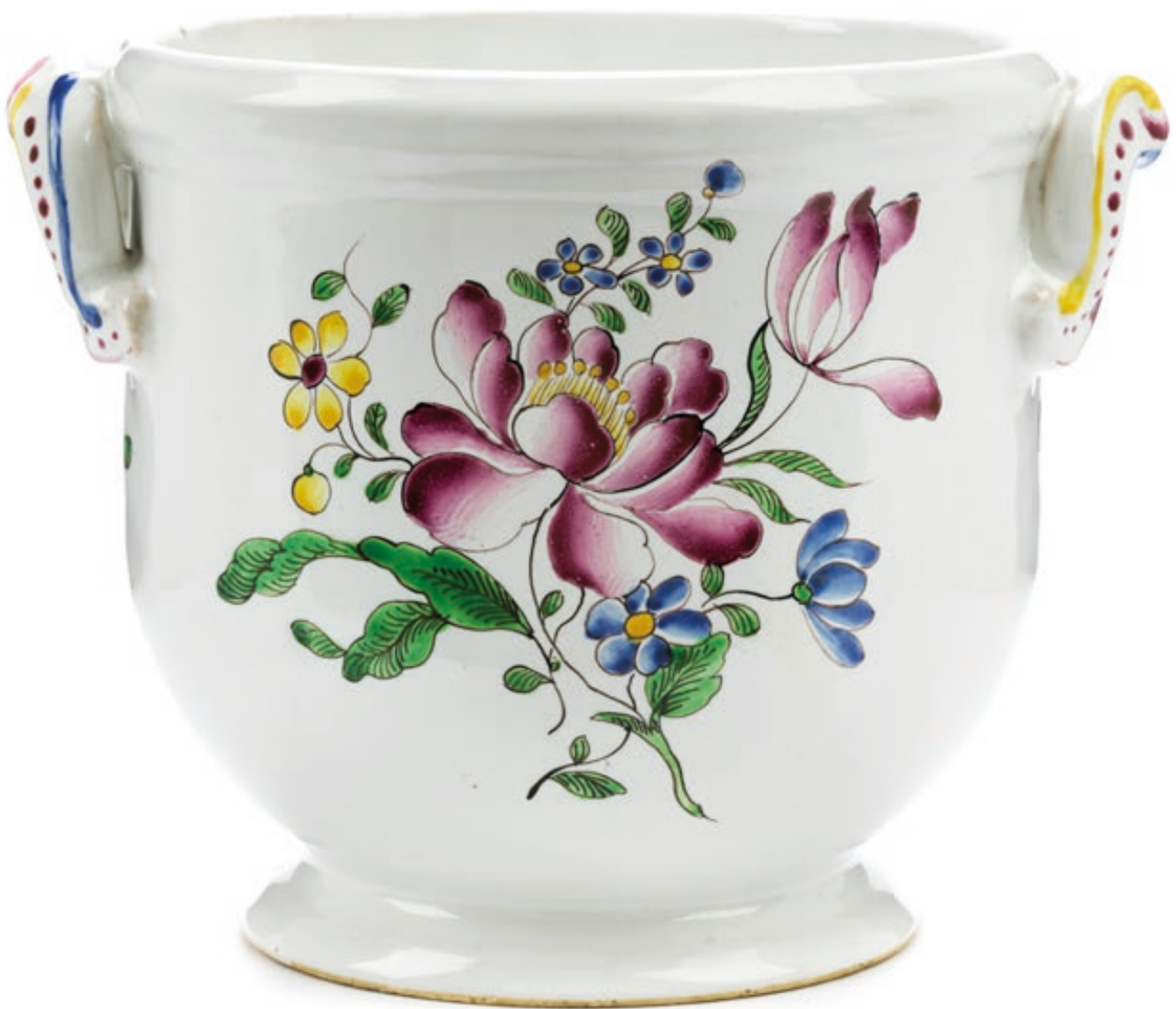
27A. Straßburger Cachepot um 1770, Periode Joseph Hannong, Marke „JH“ und „T2“, H. 13 cm