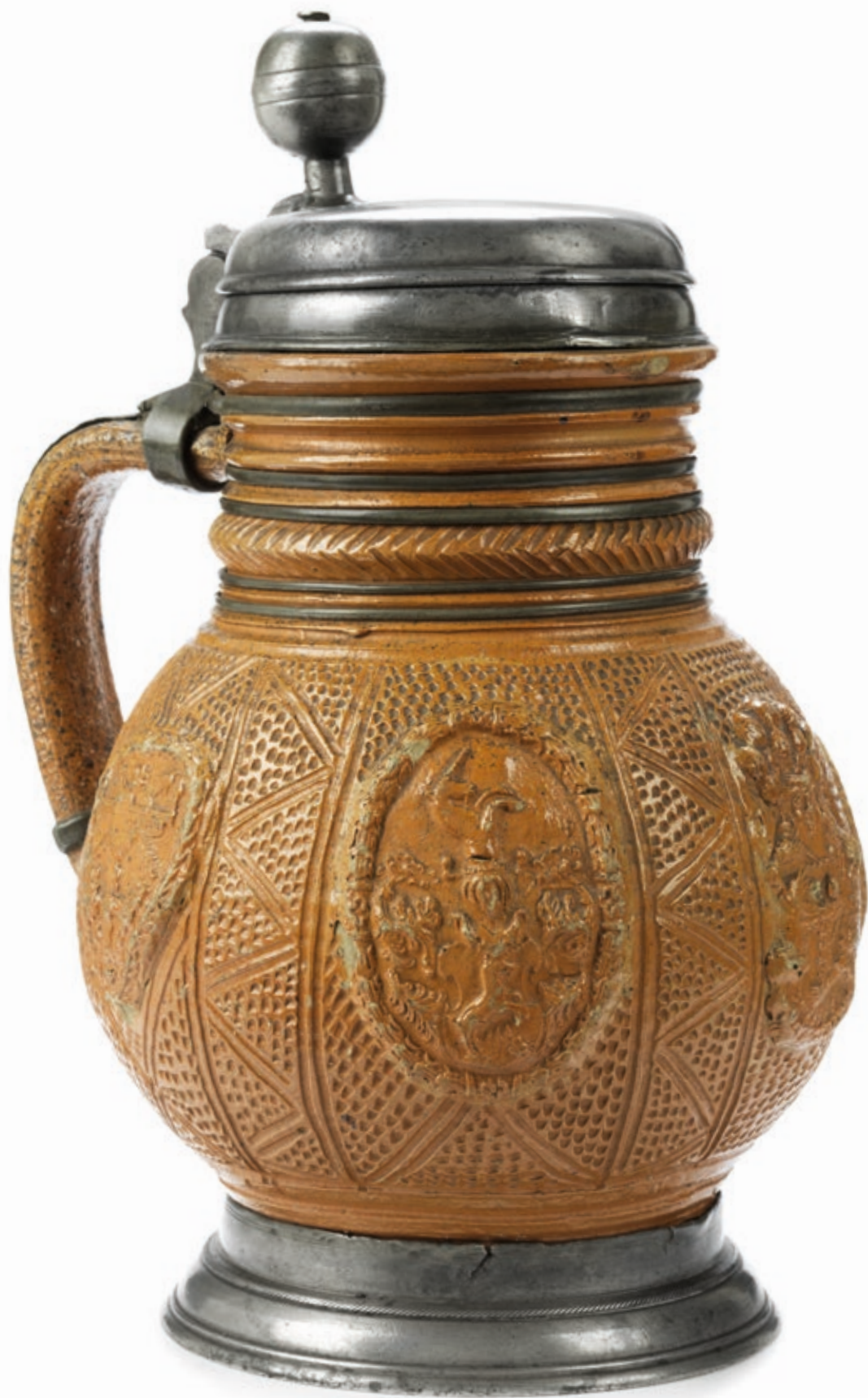
33. Altenburger Kugelbauchkrug um 1680, der mit Reliefaufgaben verziert ist, H. 26 cm