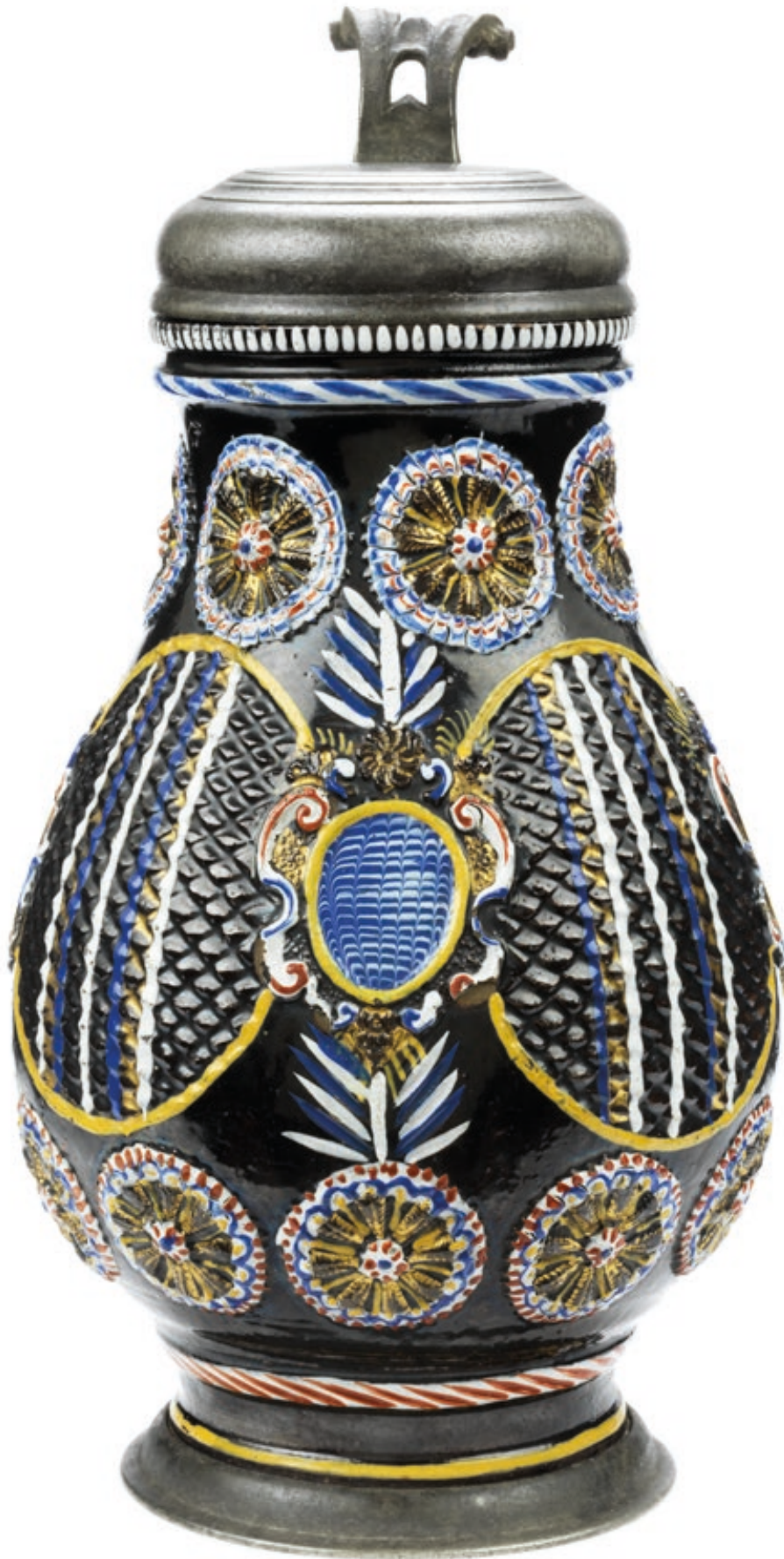
38. Dippoldiswalder Birnenkrug um 1680, der mit bunten Emailfarben bemalt ist, H. 26 cm