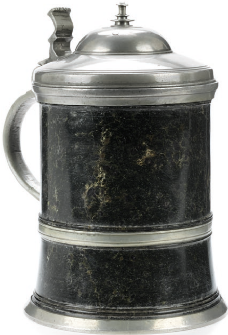
28. Zöblitzer Serpentinbecher um 1670, mit einer Marienberger Zinnmontierung, H. 16 cm