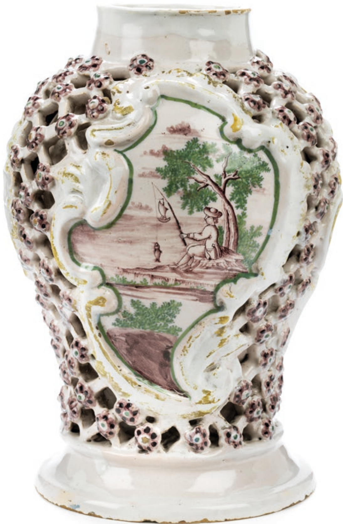
19. Magdeburger Netzvase um 1770, die mit bunten Scharffeuerfarben bemalt ist, H. 24 cm