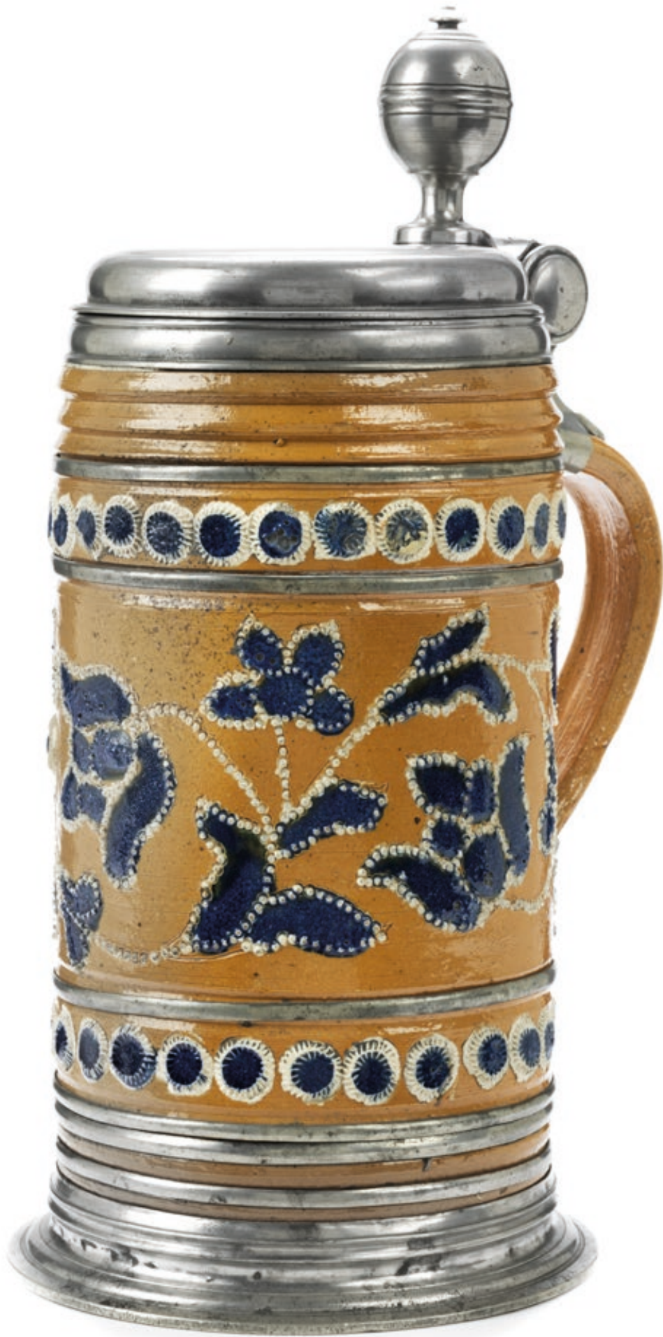
34. Altenburger Perlkrug mit blauer Bemalung, die Zinnmontierung ist 1723 datiert, H. 29 cm