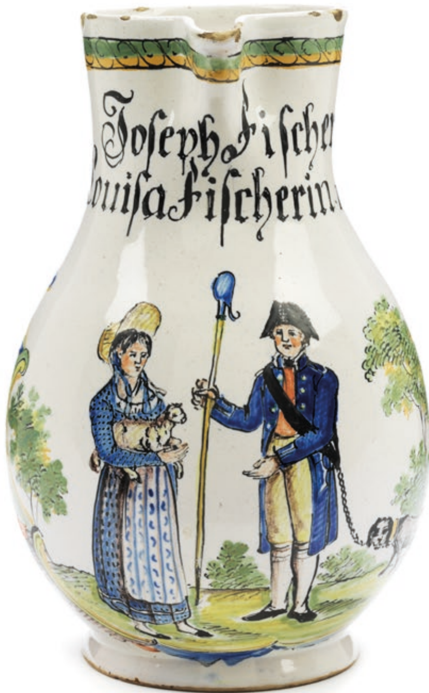
10. Durlacher Hochzeitskrug 1820 datiert, der mit bunten Scharfffeuerfarben bemalt ist, H. 17 cm