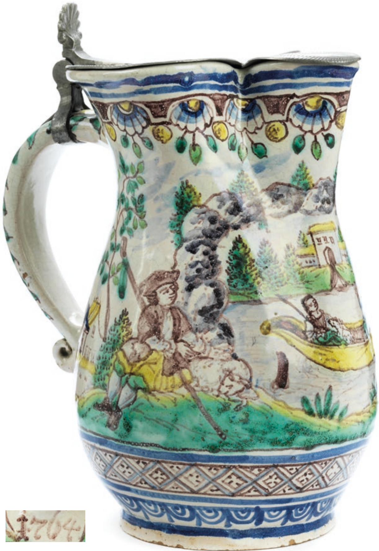
13. Gmundener Hochzeitskanne 1764 datiert, die mit bunten Scharfffeuerfarben bemalt ist, die Bemalung wird Gottfried Sauber dem Älteren zugeschrieben, H. 27 cm