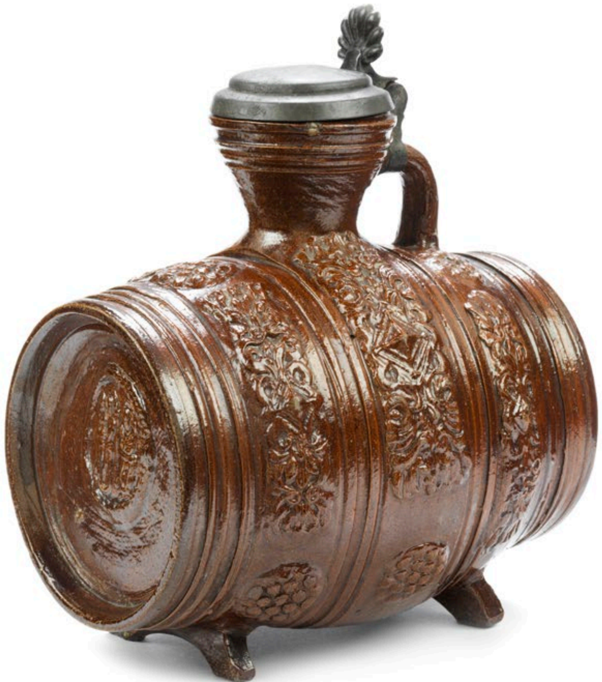
40. Waldenburger Steinzeugfaß um 1650, das mit Reliefauflagen verziert ist, H. 19 cm