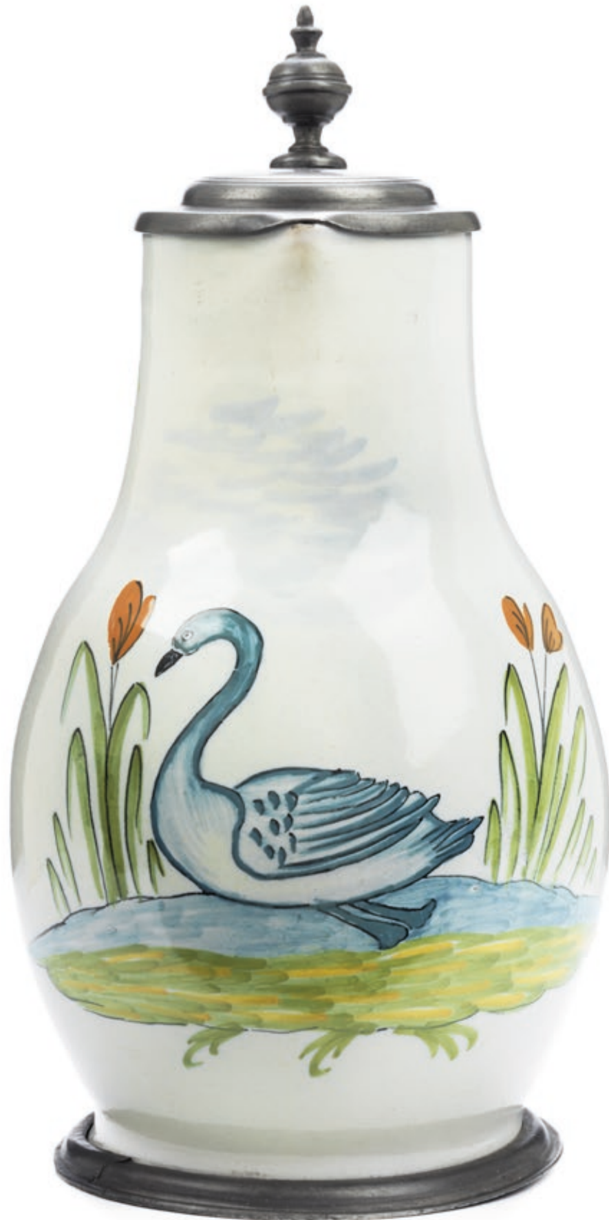
22. Offenbacher Fayencekrug um 1780, der mit bunten Scharfffeuerfarben bemalt ist, H. 25 cm