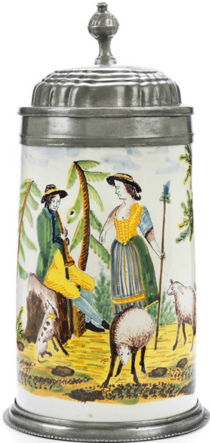
8. Crailsheimer Schäferkrug um 1796, der „Gelben Familie“ in Scharfffeuermalerei, H. 24 cm