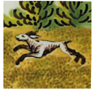
6. Crailsheimer Hasenjagdkrug um 1780, der „Gelben Familie“ in Scharffeuermalerei, H. 24 cm