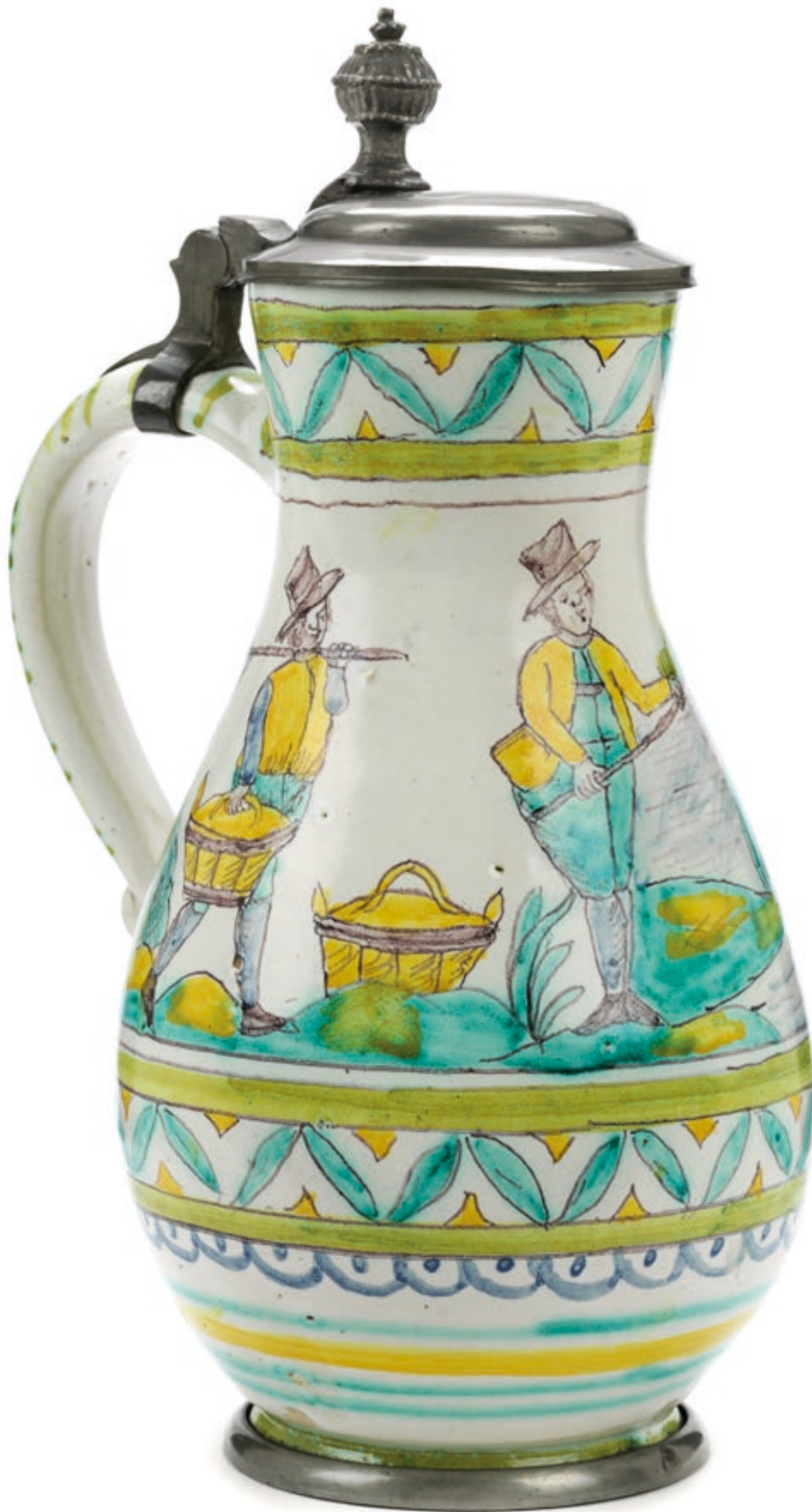
14. Gmundener Fischerkrug um 1800, der mit bunten Scharfffeuerfarben bemalt ist, H. 27 cm