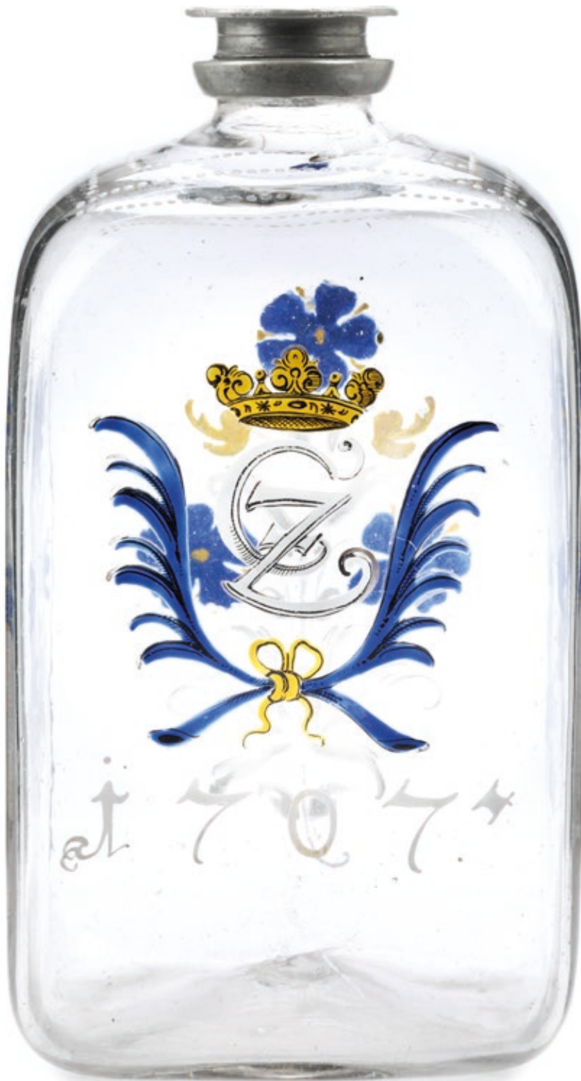
31. Sächsische Glasflasche 1707 datiert, die mit bunten Emailfarben bemalt ist, H. 21 cm