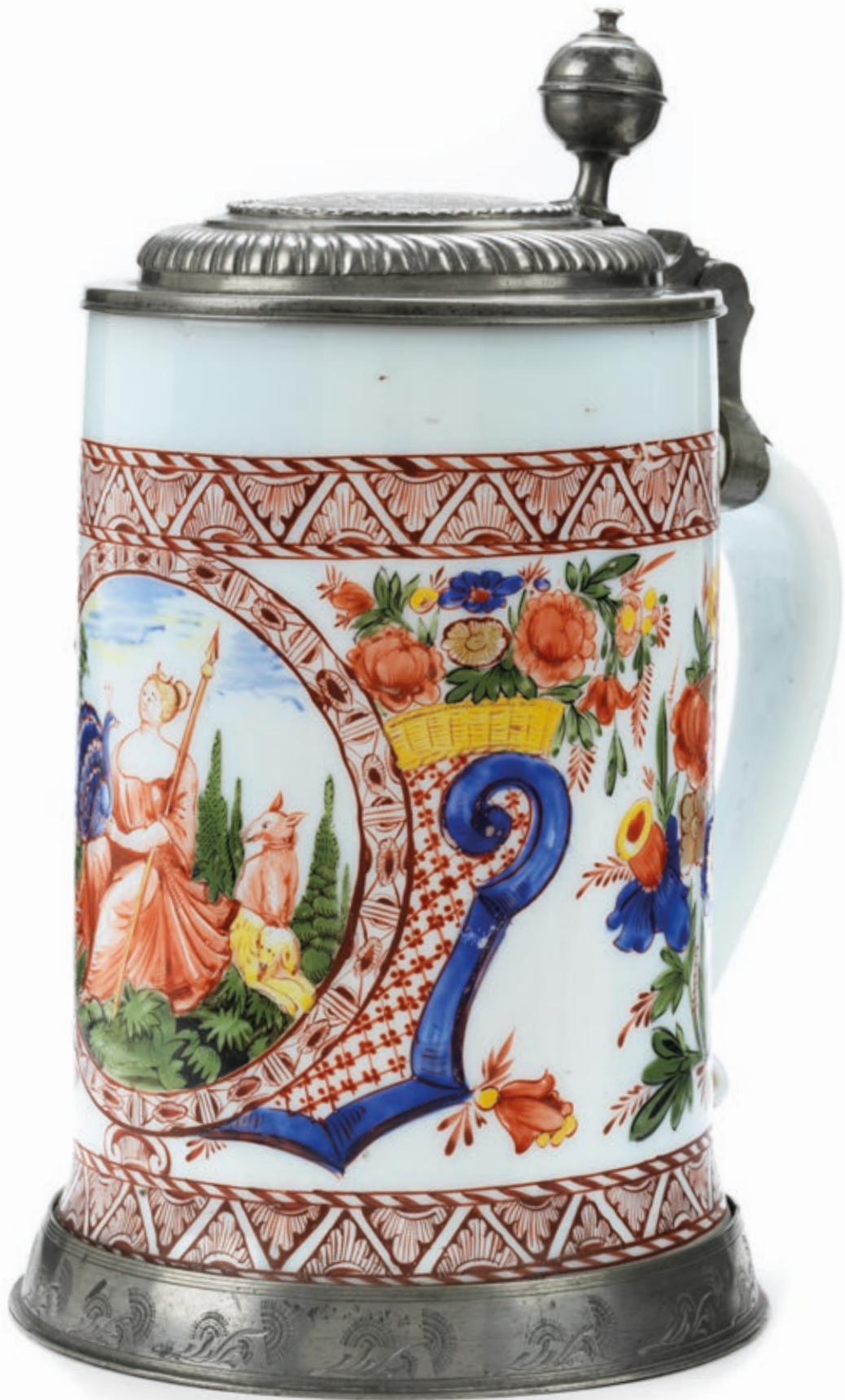
30. Böhmischer Milchglaskrug um 1750, der mit bunten Emailfarben bemalt ist, H. 22 cm