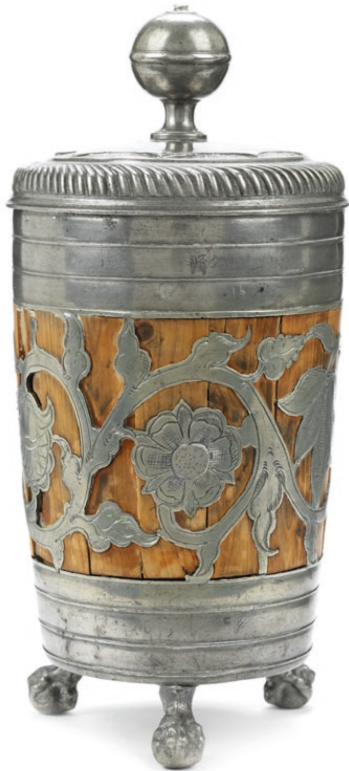
29. Kulmbacher Kugelfußbecher mit Deckel um 1730, mit Zinn eingefasste Holzdauben, H. 20 cm