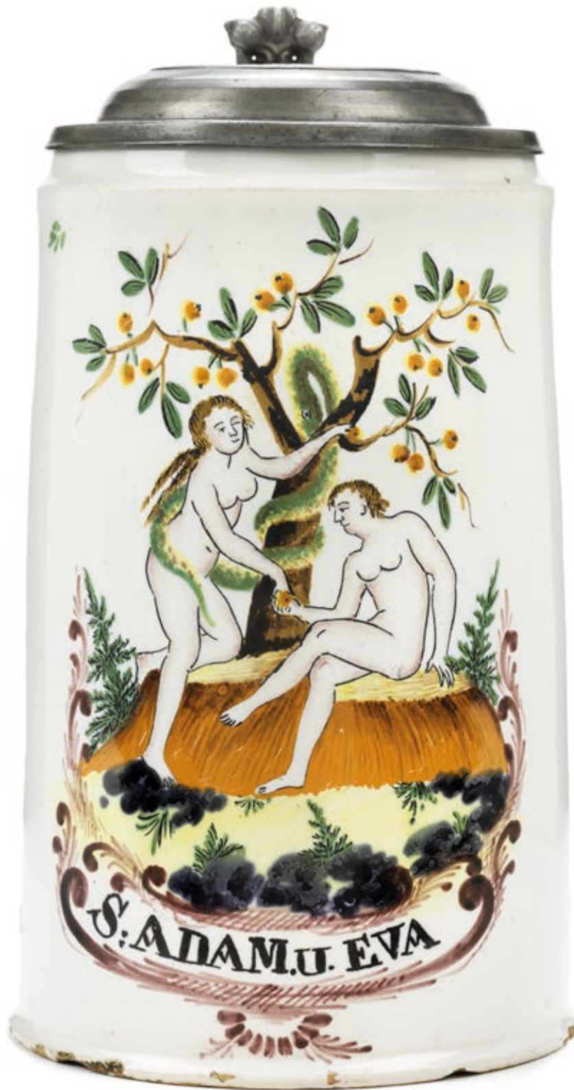
24. Poppelsdorfer Walzenkrug um 1800, auf dem Boden Ankermarke, H. 19 cm