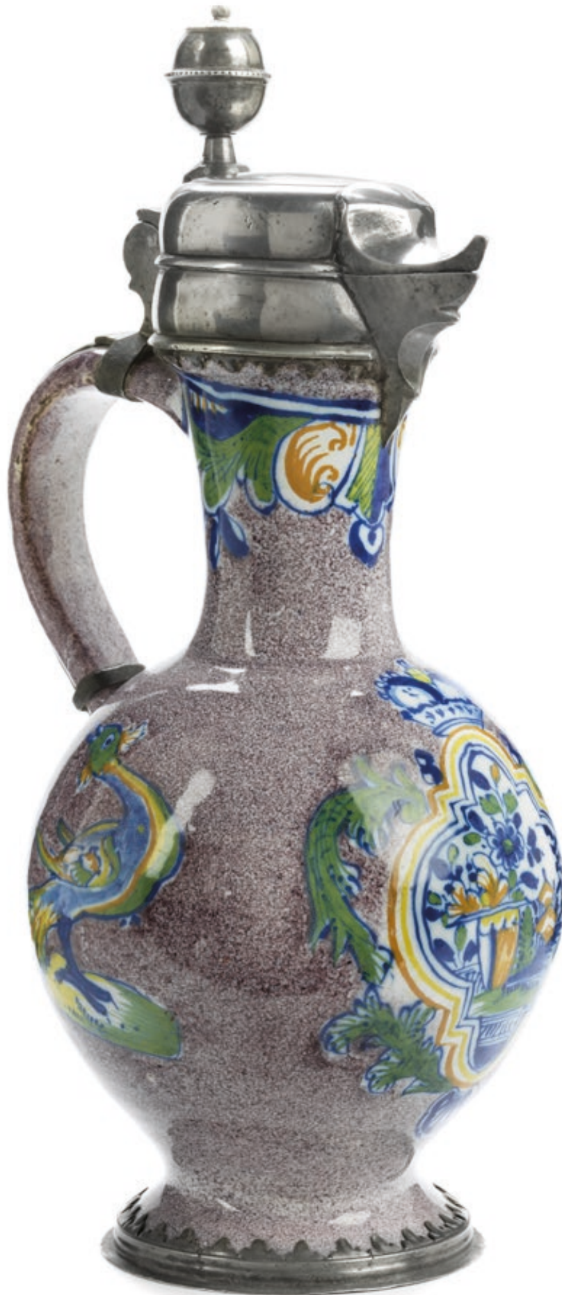
9. Dorotheenthaler Enghalskrug um 1740, der mit bunten Scharfffeuerfarben bemalt ist, H. 29 cm