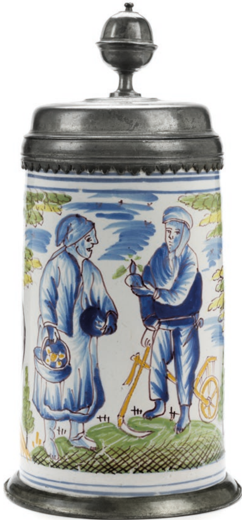
4. Bayreuther Fayencewalzenkrug um 1745, auf dem Boden Manufakturmarke „BFS“, H. 25 cm