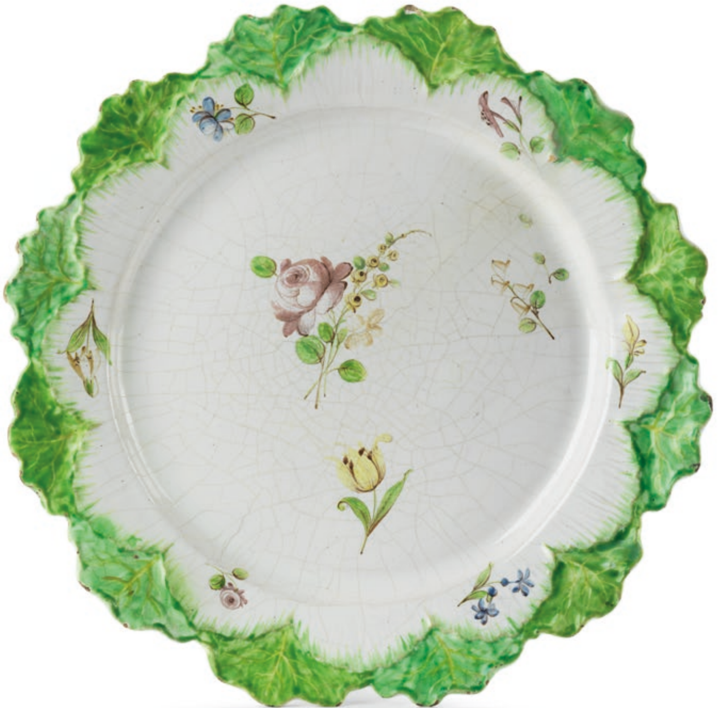
26. Ein Paar Krautkopfterrinen mit Platten aus Sceaux um 1765, Periode Chapelle, polychromer Muffelbranddekor, Wappenlilie als Manufakturmarke, H. 18 cm