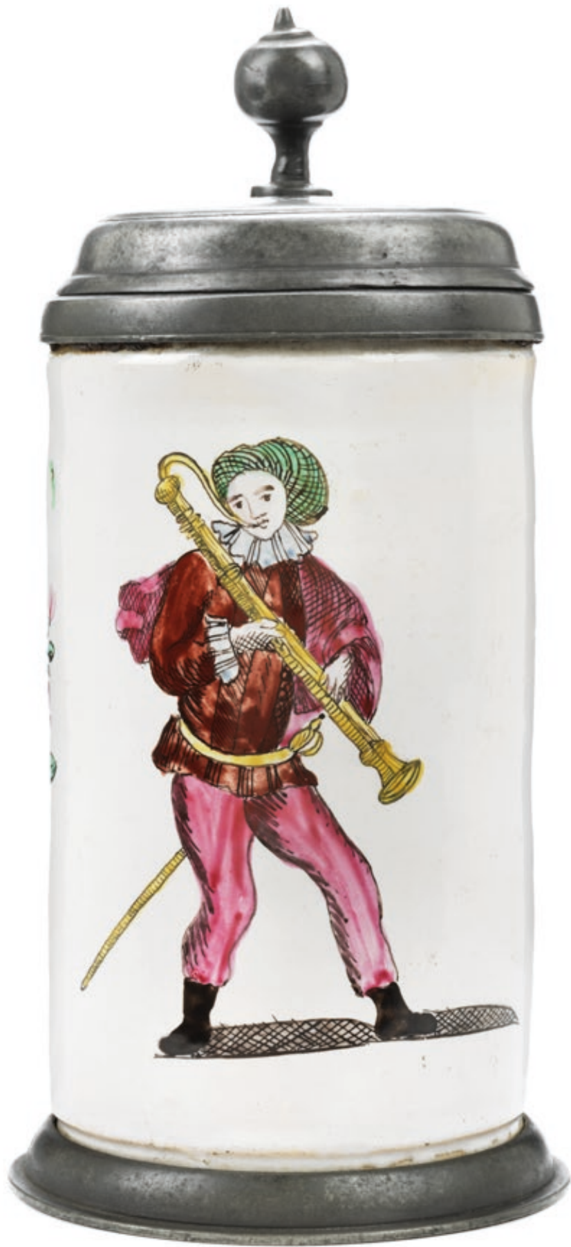
25. Proskauer Musikantenkrug um 1822, der mit bunten Muffelfarben bemalt ist, H. 22 cm