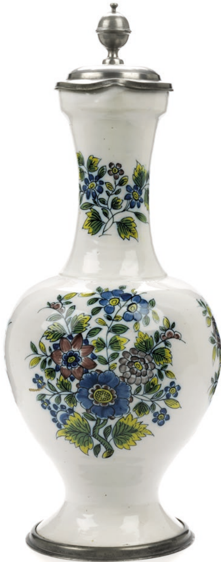
18. Künersberger Enghalskrug um 1750, der mit bunten Scharfffeuerfarben bemalt ist, H. 36 cm