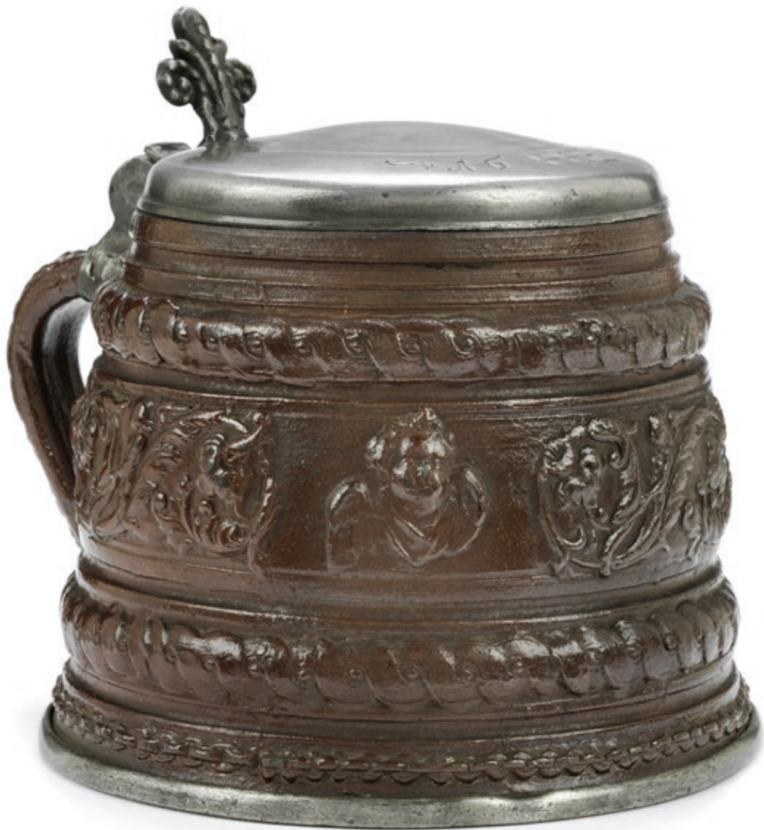
35. Creußener Steinzeughumpen mit Reliefauflagen, die Zinnmontierung ist 1658 datiert, H. 14 cm