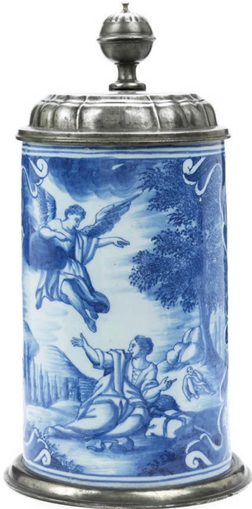
21. Nürnberger Walzenkrug um 1770, der mit blauen Scharfffeuerfarben bemalt ist, H. 23 cm