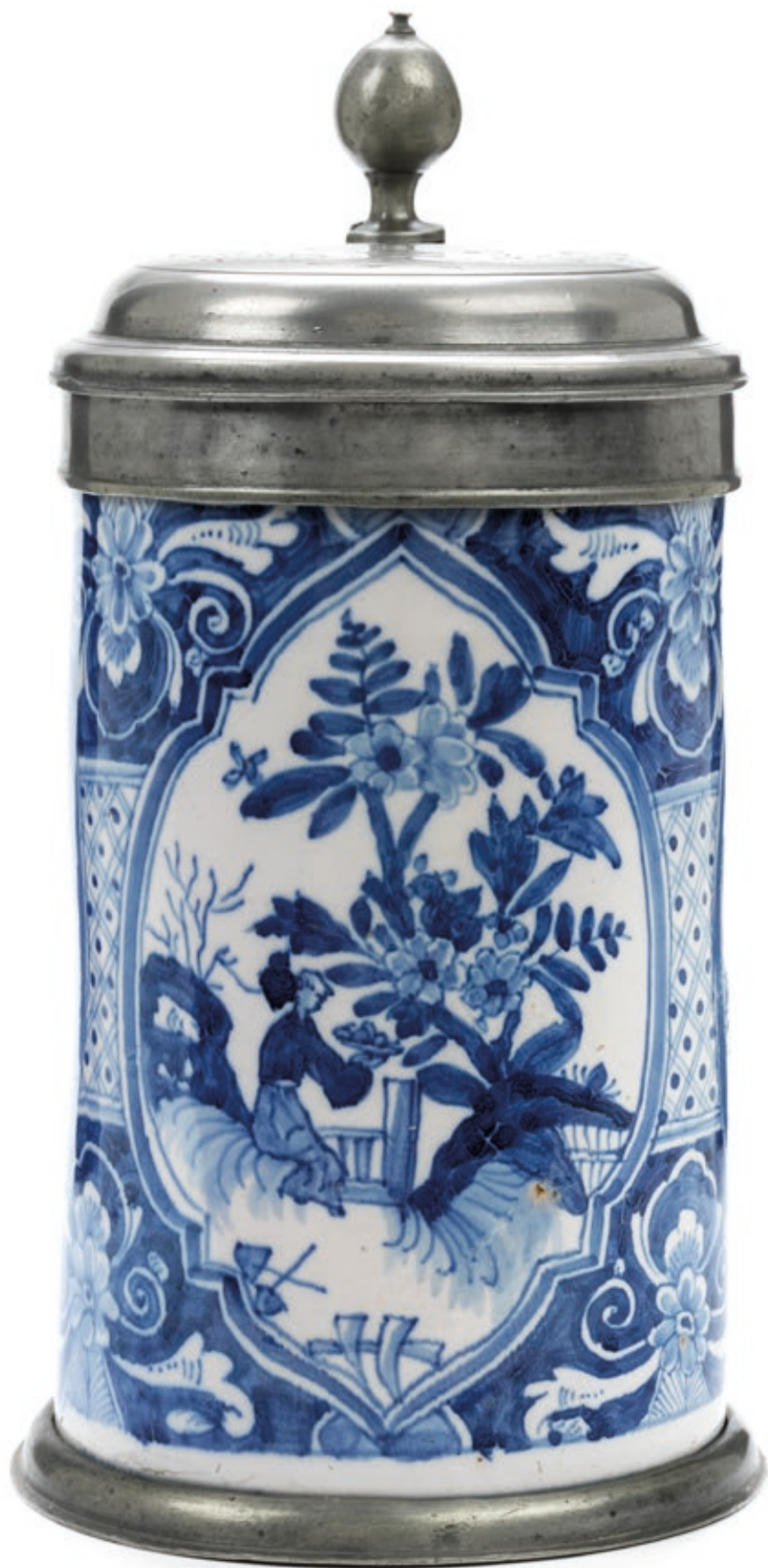
17. Künersberger Walzenkrug um 1750, der mit blauen Scharfffeuerfarben bemalt ist, H. 23 cm