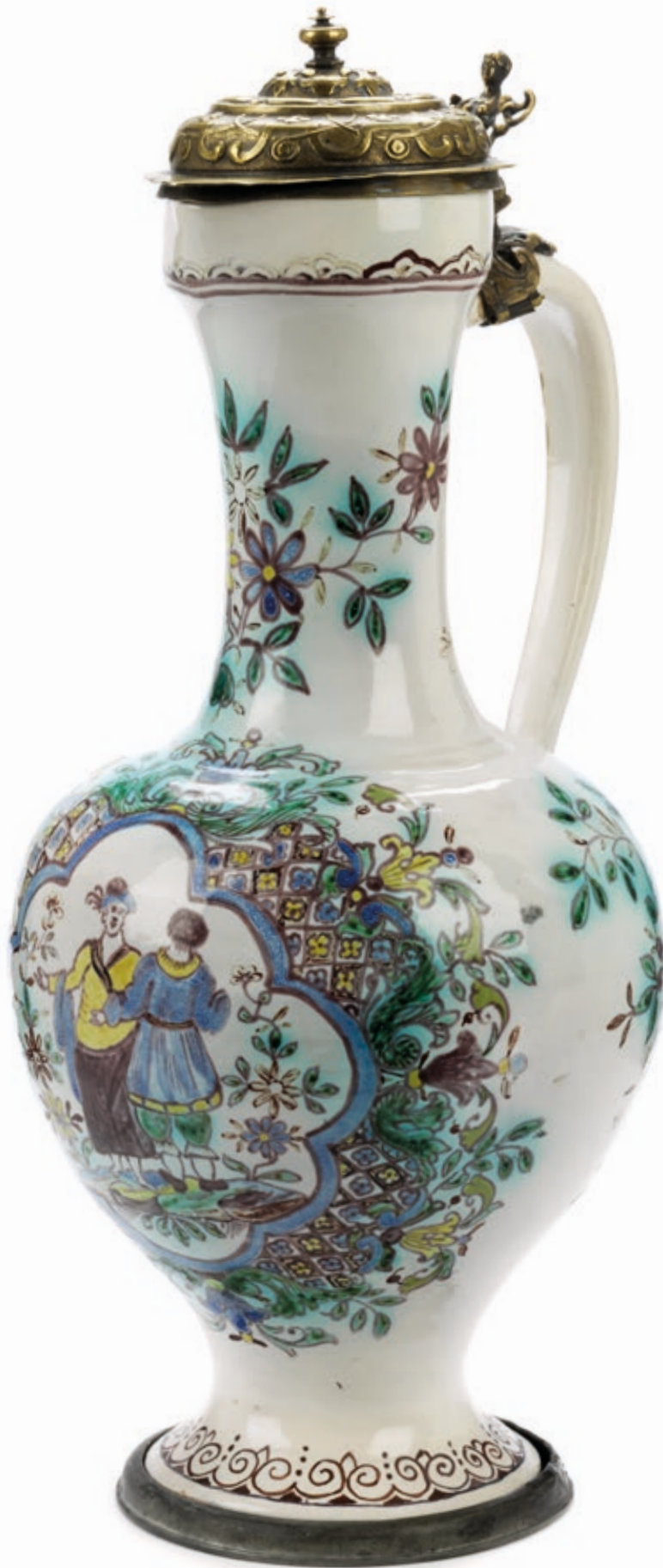
1. Ansbacher Enghalskrug der „Grünen Familie“ um 1740, bunte Muffelmalerei, H. 30 cm Provenienz: Sammlung Igo Levi, Luzern und Sammlung Ulrich Seiler, Köln