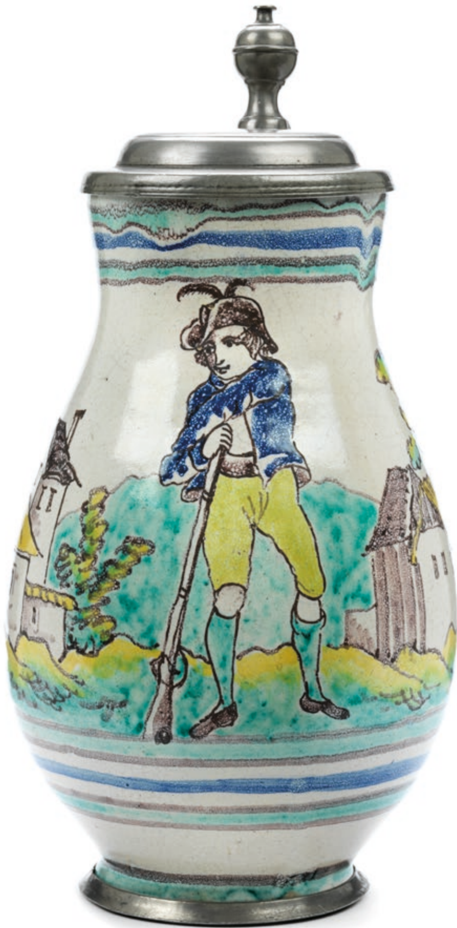
15. Gmundener Jagdkrug um 1800, der mit bunten Scharfffeuerfarben bemalt ist, H. 26 cm