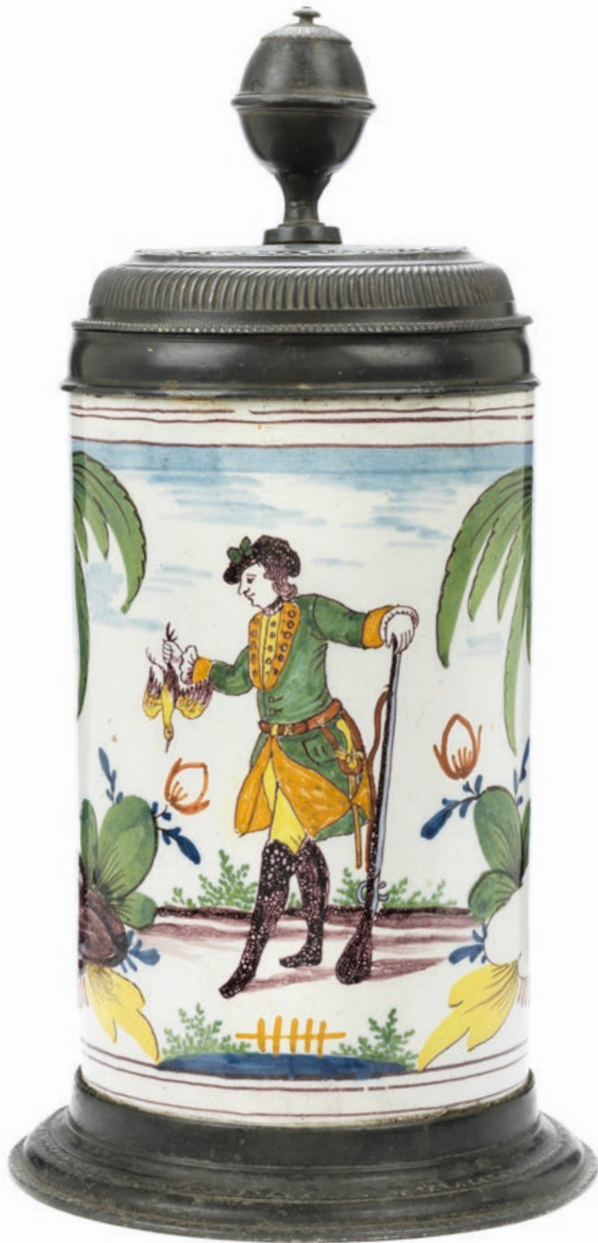
20. Magdeburger Jagdkrug um 1780, der mit bunten Scharffeuerfarben bemalt ist, H. 27 cm