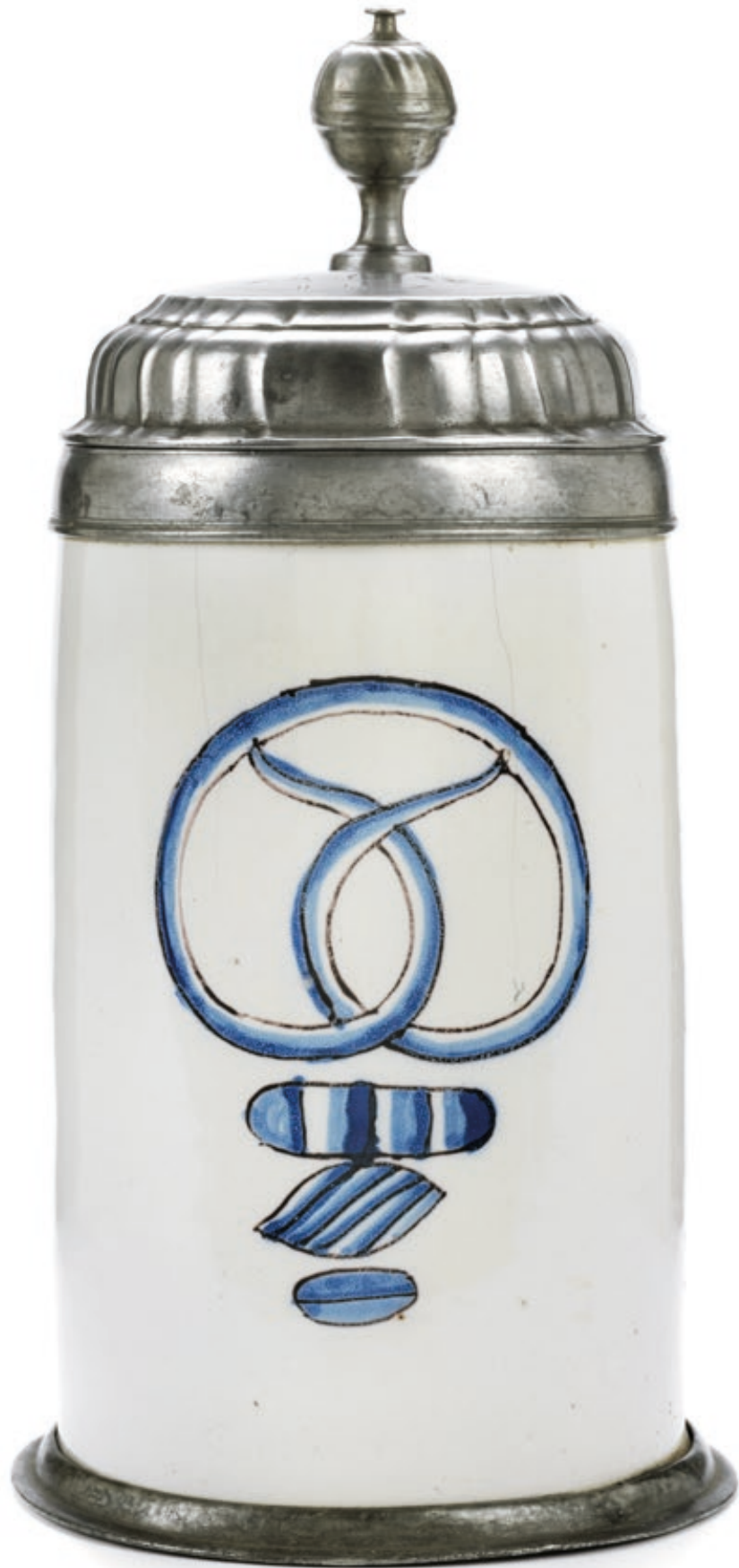
3. Bayreuther Bäckerzunftkrug um 1760, der mit blauen Scharffeuerfarben bemalt ist, H. 25 cm