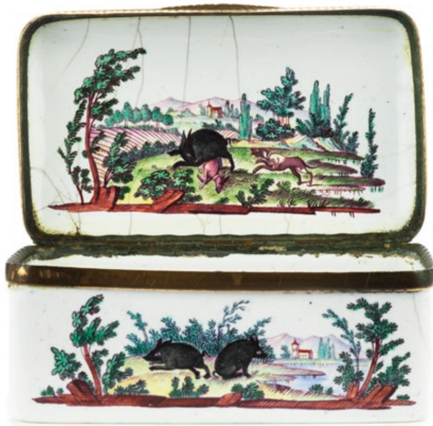
12. Ellwanger Emaildose mit Jagdmotiven um 1770, die von dem Haus- und Dosenmaler Johann Andreas Bechdolff in Ellwangen bemalt wurde, B. 8,5 cm