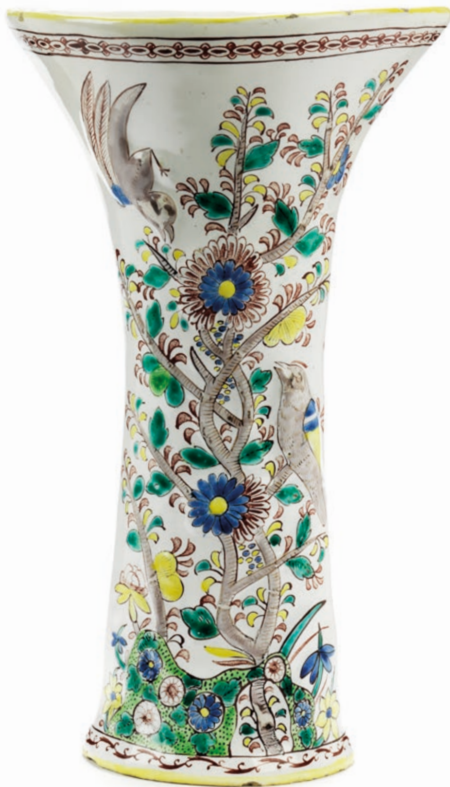
Provenienz: Sammlung Boxleidner, Bamberg und Sammlung Schmitz, Düsseldorf Abgebildet bei A. Bayer, Ansbacher Fayencen , 1928, Abb. 123 und 1959, Abb. 50