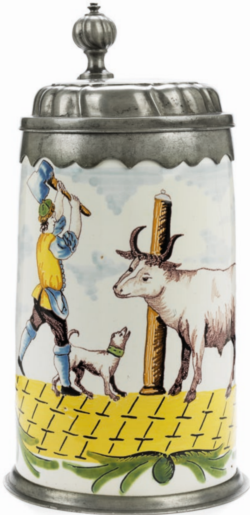
7. Crailsheimer Metzgerzunftkrug um 1780, der mit bunten Scharfffeuerfarben bemalt ist, H. 24 cm