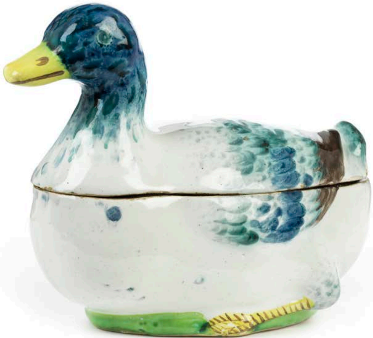
19. Künersberger Fayencedose in Form einer Ente um 1760, bunte Muffelmalerei, H. 13 cm