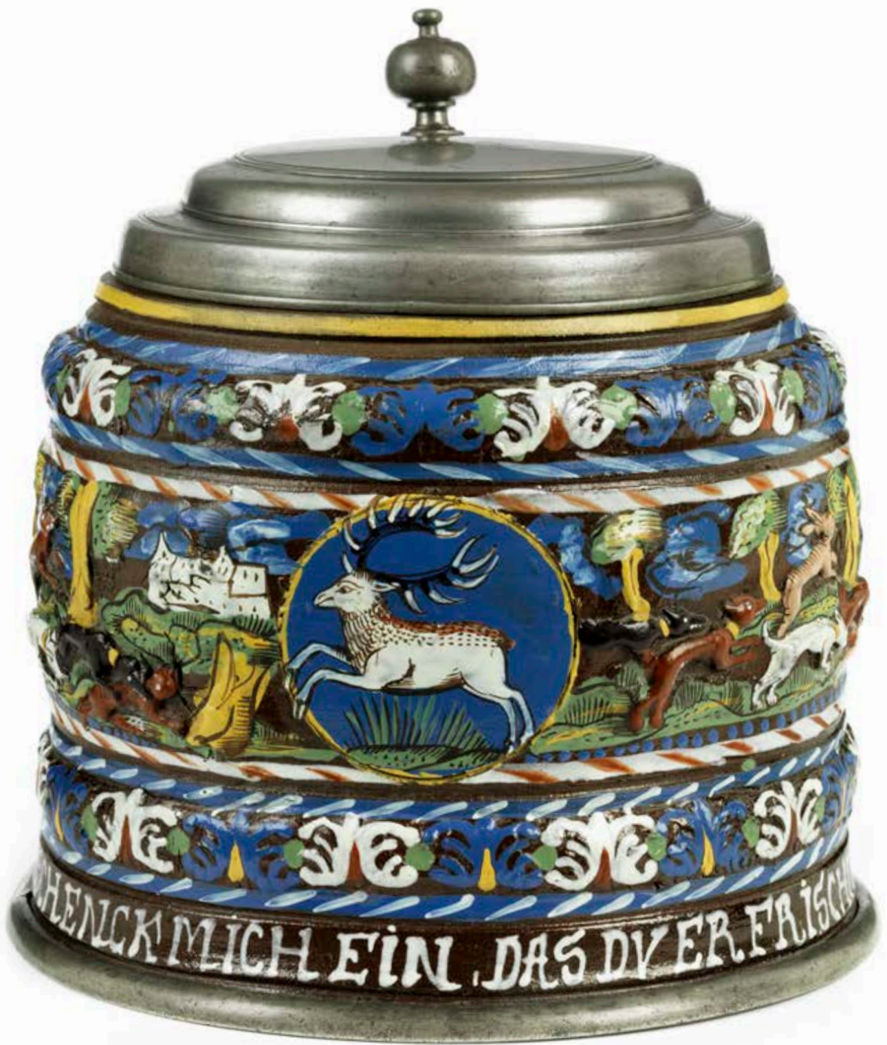
36. Creußener Hasenjagdhumpen 1689 datiert, der mit bunten Emailfarben bemalt ist, H. 18 cm