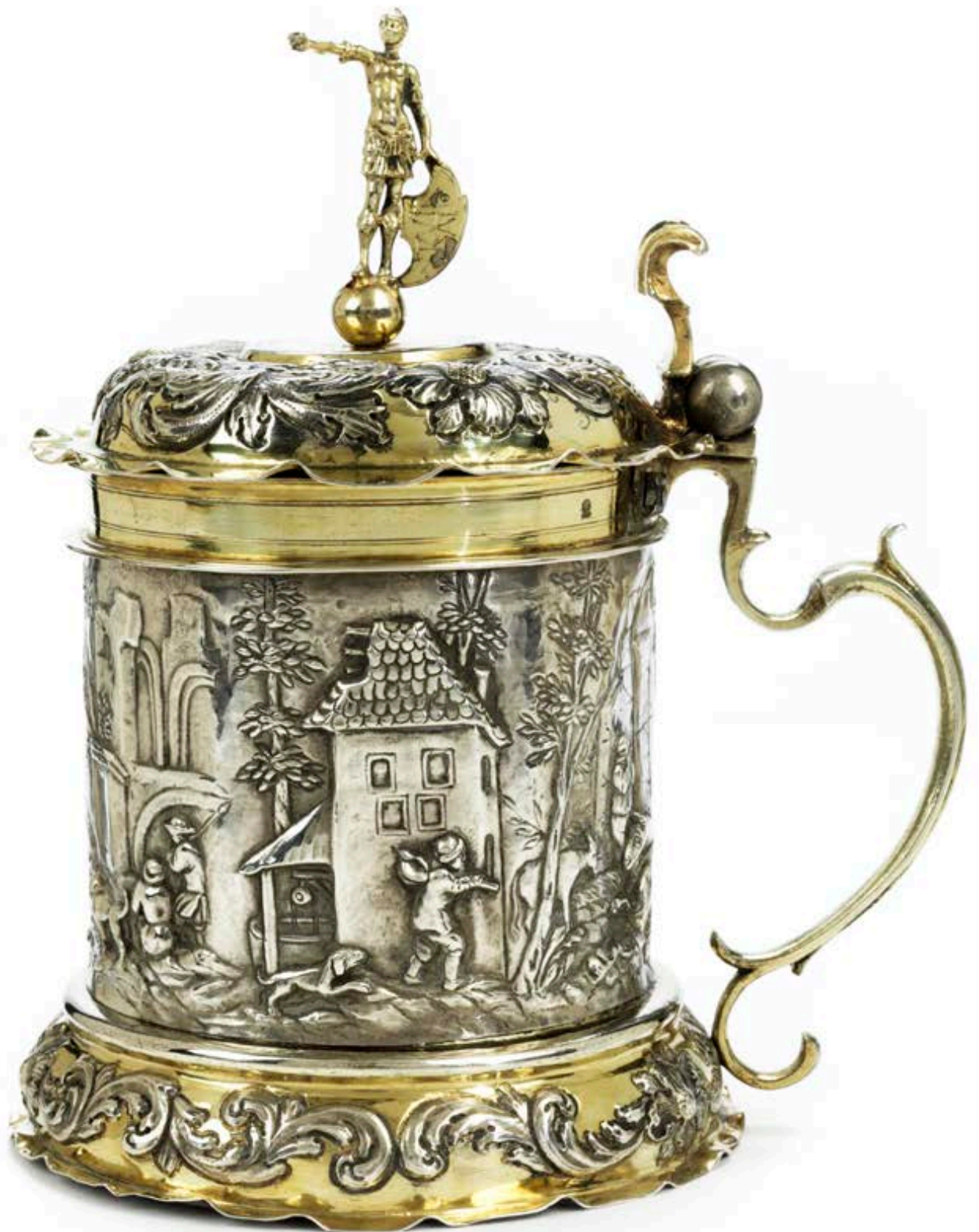
30. Augsburger Silberhumpen um 1670, von dem Meister David Schwestermüller, H. 22 cm