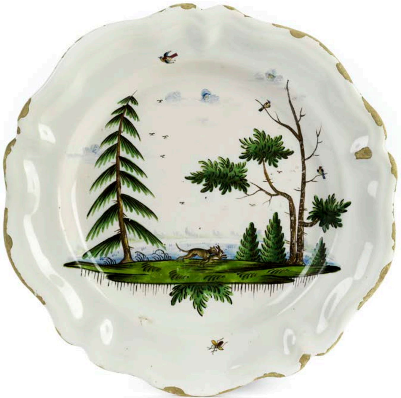
18. Künersberger Jagdteller um 1760, der mit bunten Muffelfarben bemalt ist, D. 24 cm