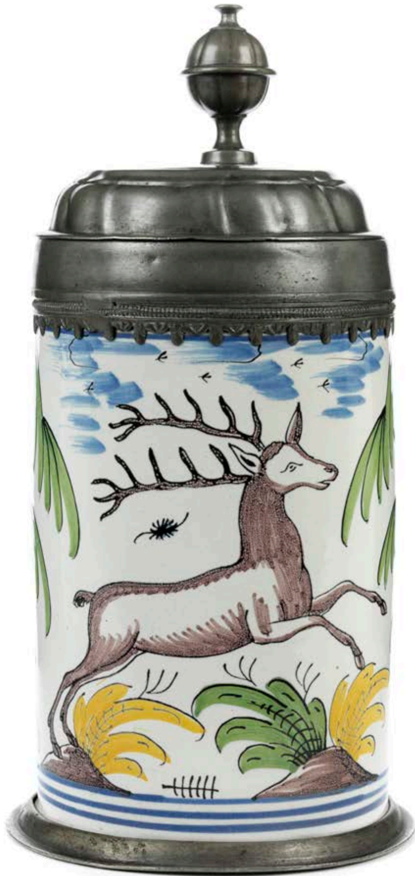
3. Bayreuther Jagdkrug um 1780, der mit bunten Scharfffeuerfarben bemalt ist, H. 24 cm