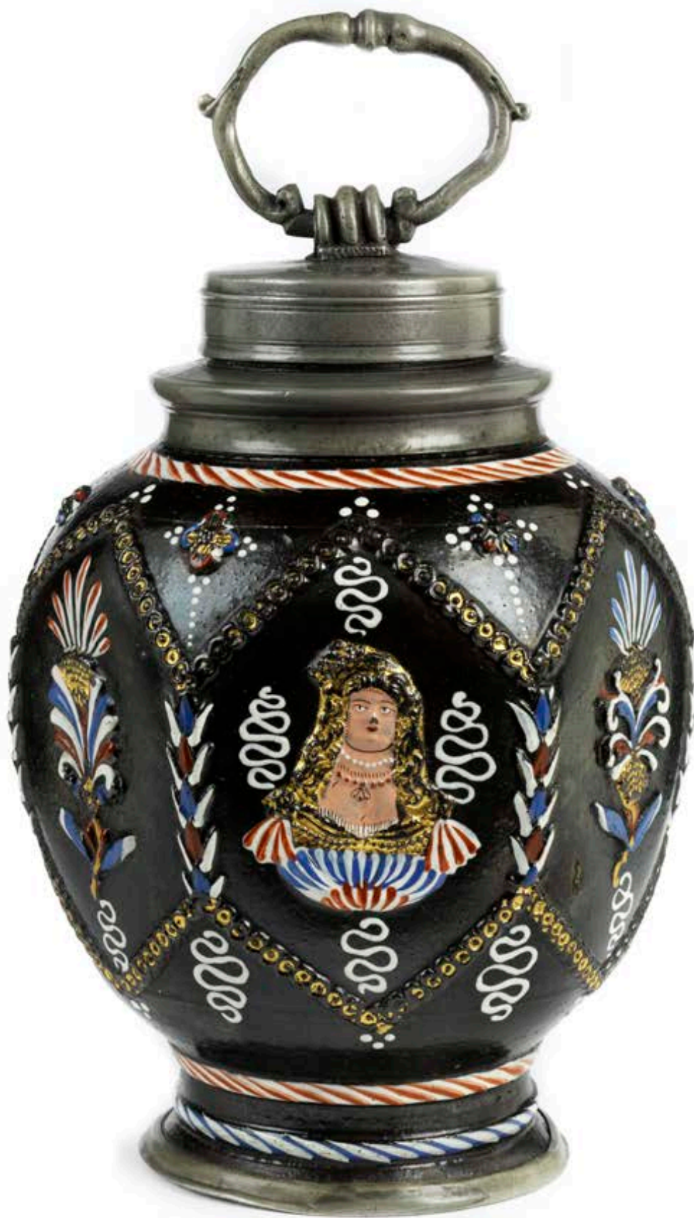
40. Dippoldiswalder Schraubflasche um 1670, Marienberger Zinnverschraubung, H. 21 cm