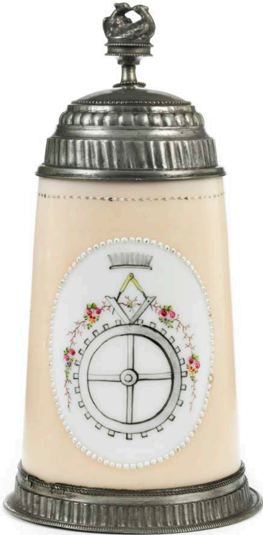
33. Böhmischer Müllerzunftkrug um 1800, Milchglas mit bunter Emailmalerei, H. 20 cm