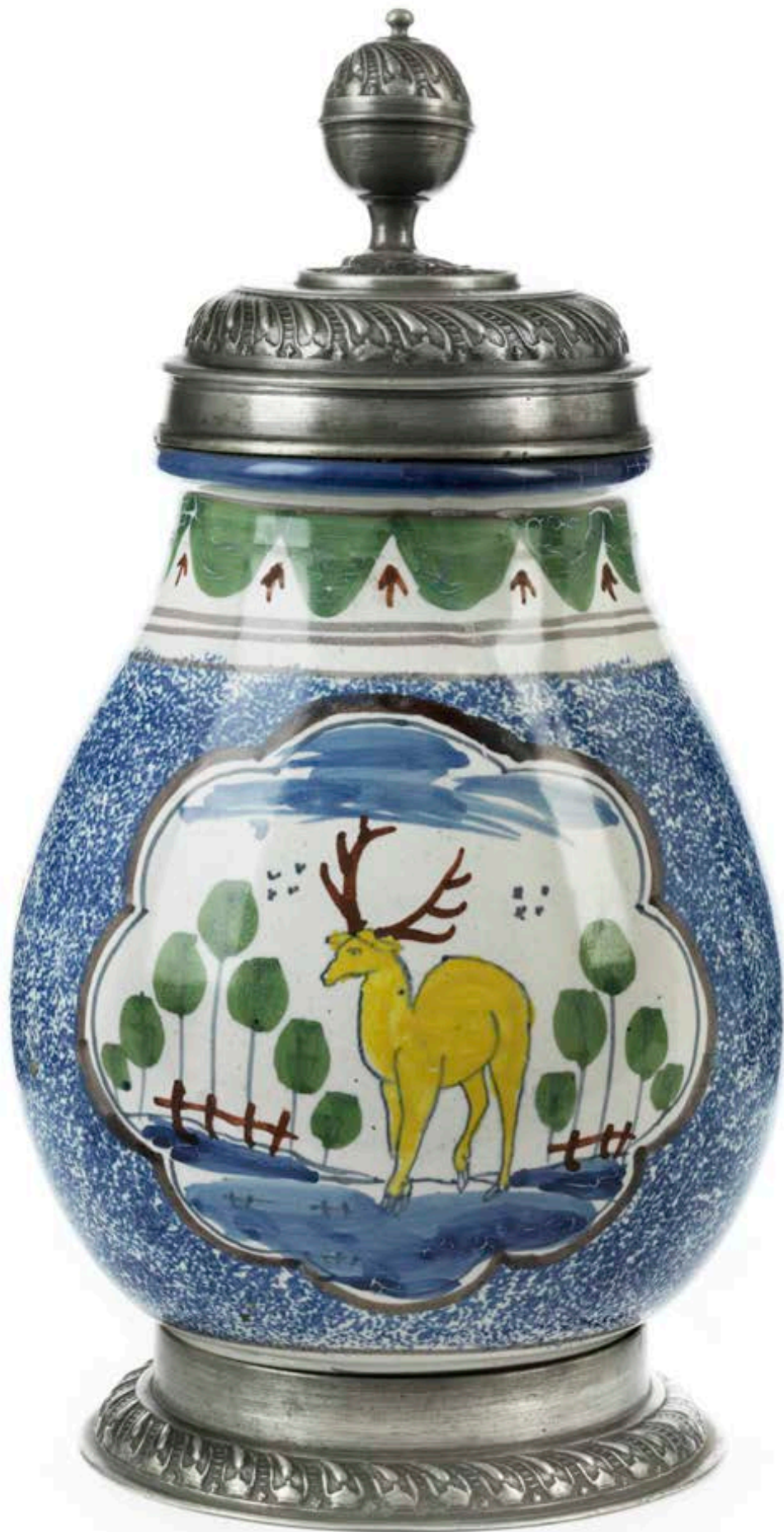
17. Hanauer Jagdkrug um 1750, der mit bunten Scharfffeuerfarben bemalt ist, H. 24 cm