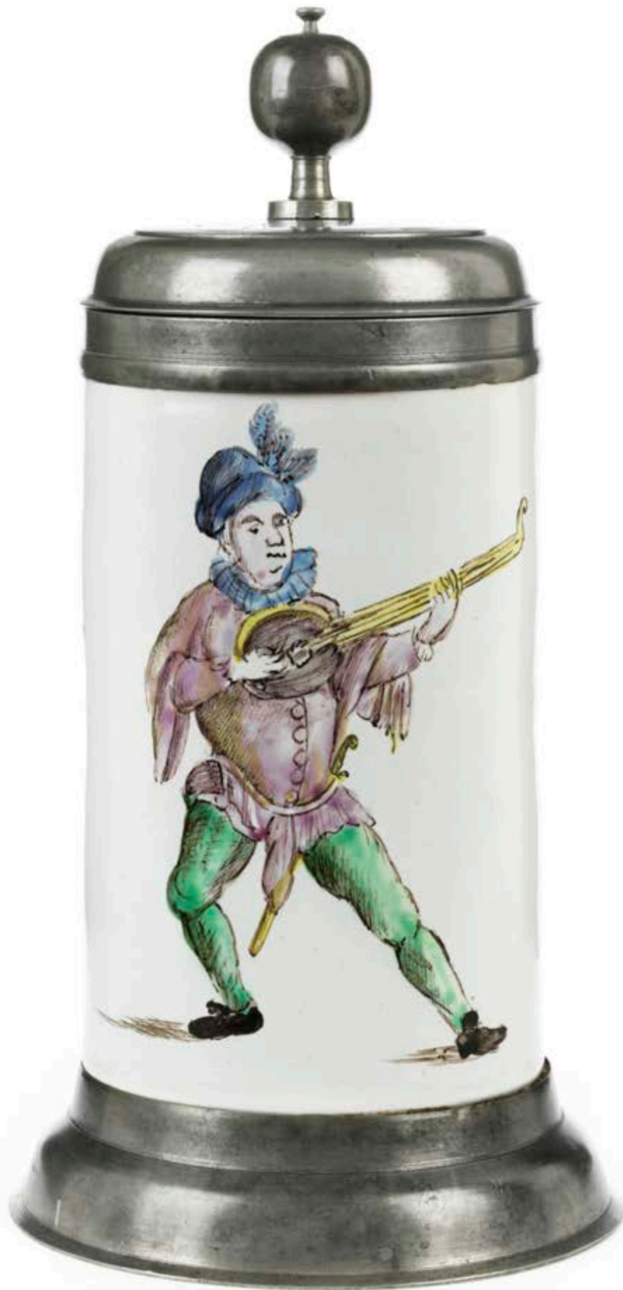
21. Proskauer Musikantenkrug um 1819, der mit bunten Muffelfarben bemalt ist, H. 25 cm