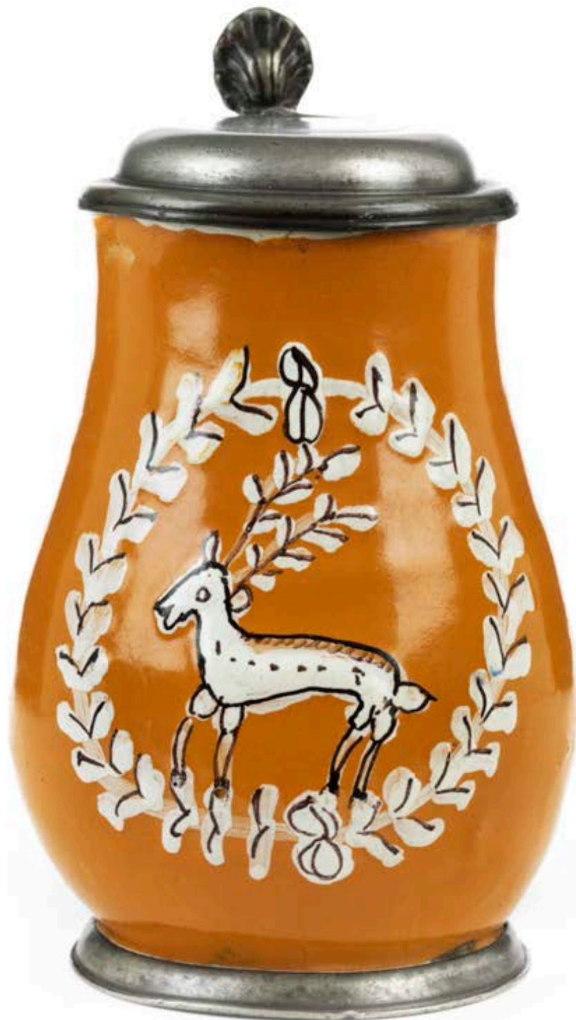
16. Habaner Jagdkrug um 1690, der mit Scharfffeuerfarben bemalt ist, H. 14 cm