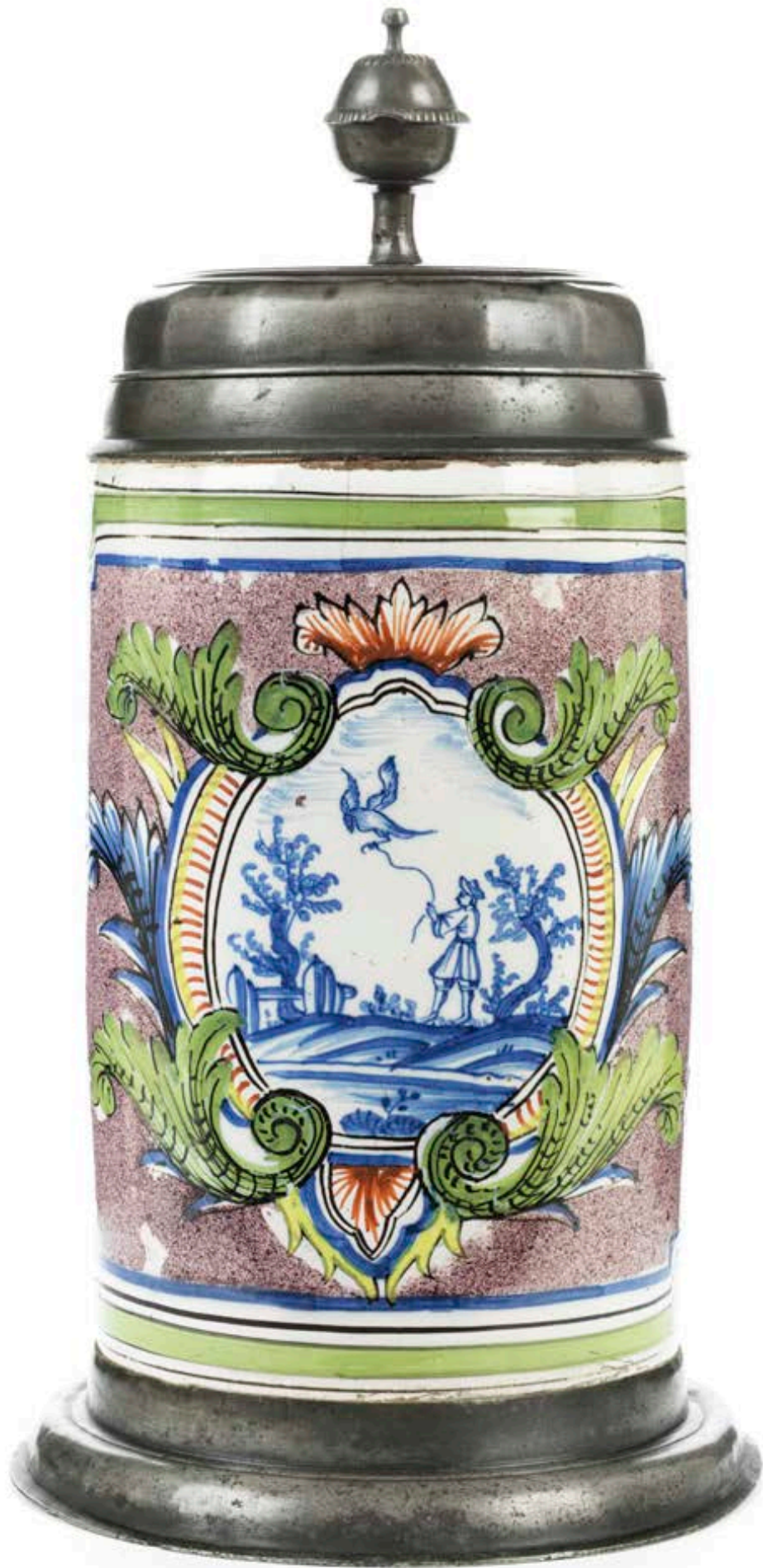
9. Dorotheenthaler Falkenjagdkrug um 1741, mit bunten Scharfffeuerfarben bemalt, H. 31 cm