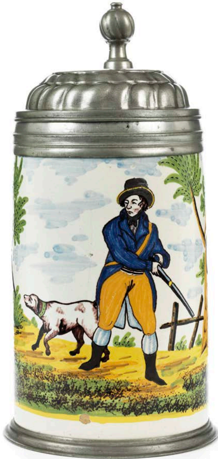
8. Crailsheimer Jagdkrug um 1800, der „Gelben Familie“ in Scharfffeuermalerei, H. 24 cm