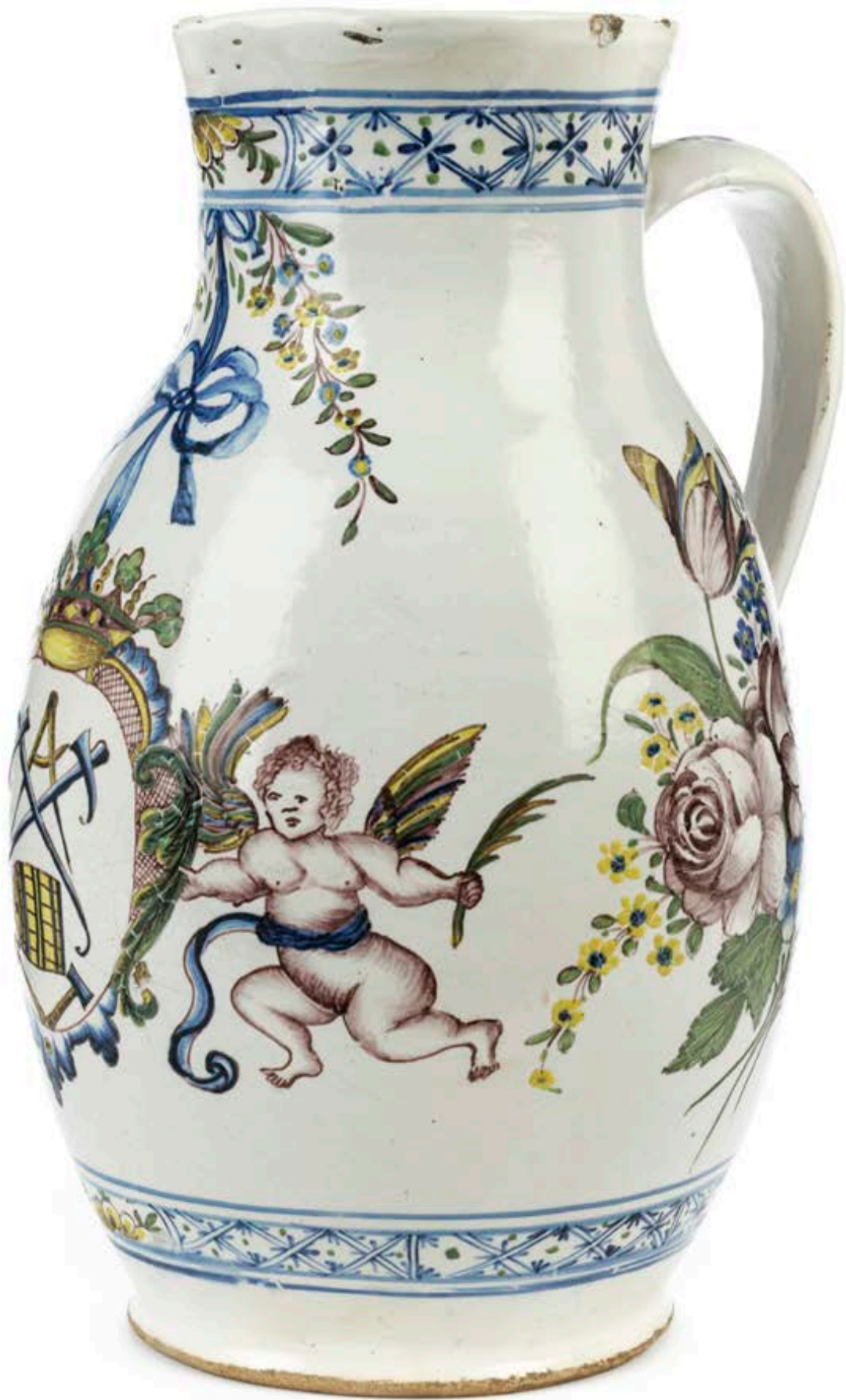
20. Ludwigsburger Zunftkanne eines Küfers um 1770, mit Manufakturmarke, H. 25 cm