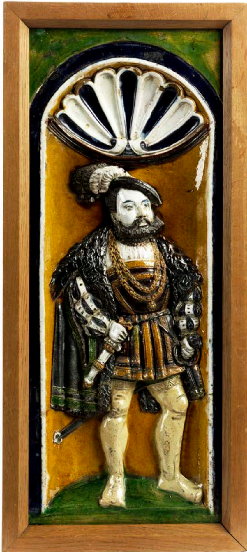
27. Nürnberger Ofenkachel um 1550, mit dem Kurfürsten Johann Friedrich von Sachsen, H. 63 cm