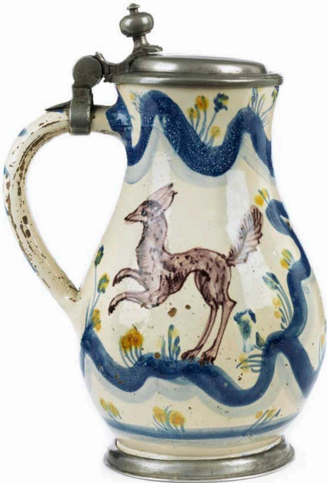
25. Salzburger Jagdkrug um 1690, aus der Fayence-Werkstatt Thomas Obermillner, H. 19 cm