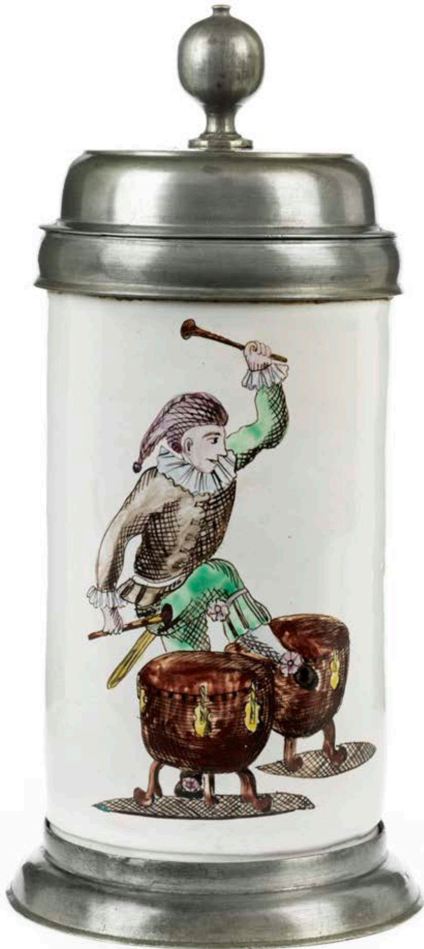
22. Proskauer Musikantenkrug um 1833, der mit bunten Muffelfarben bemalt ist, H. 25 cm