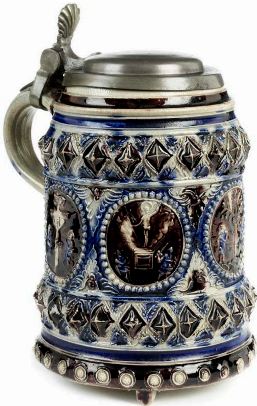
43. Westwälder Steinzeugkrug um 1700, der mit Reliefaufgaben verziert ist, H. 18 cm