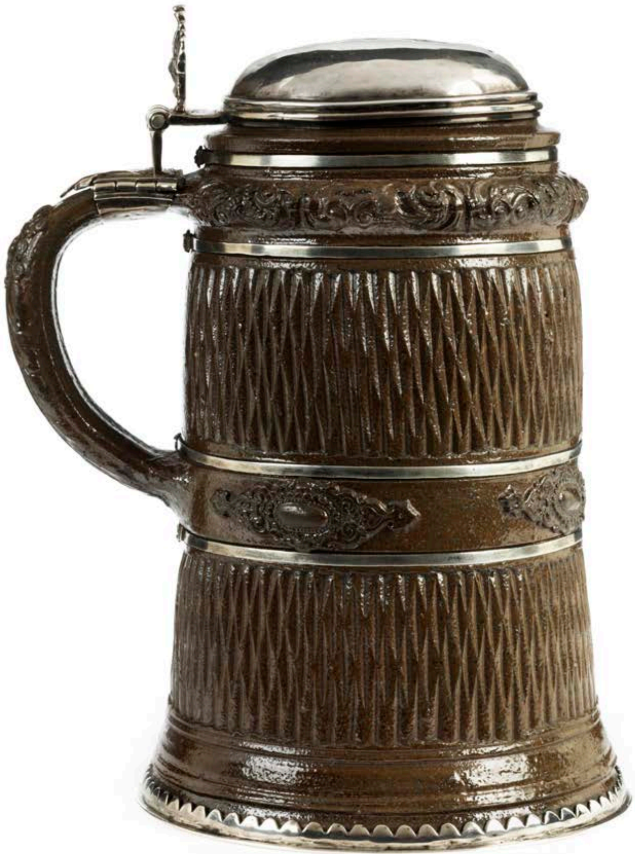
34. Creußener Steinzeugkrug um 1640, mit Reliefauflagen und Kerbschnitt, H. 18 cm