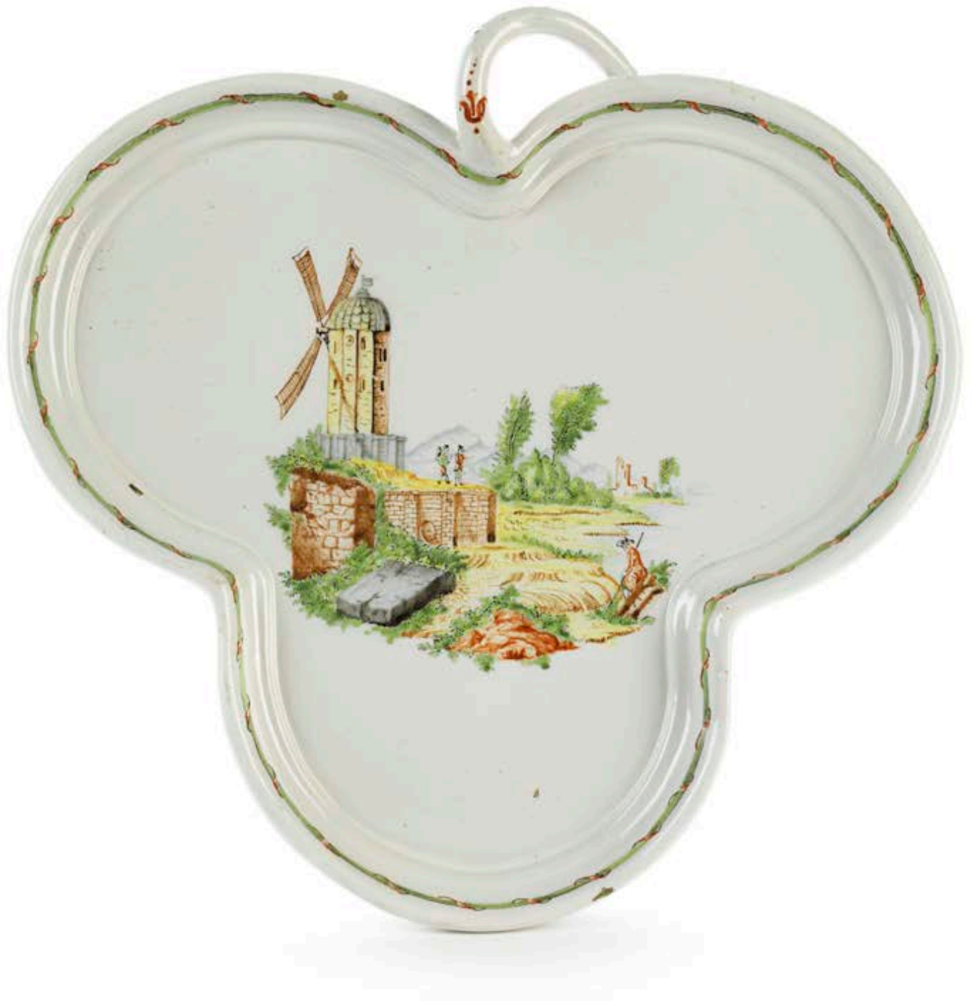
10. Durlacher Fayenceplatte um 1770, die mit bunten Scharfffeuerfarben bemalt ist, H. 27 cm