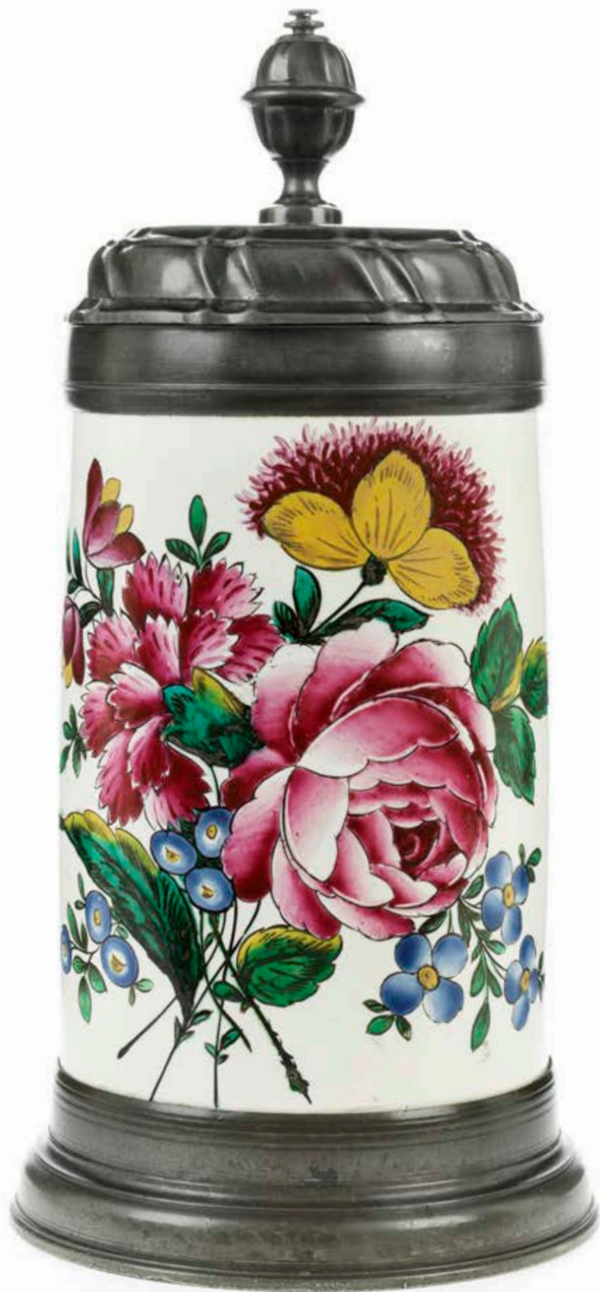
6. Crailsheimer Fayencekrug um 1780, der mit bunten Muffelfarben bemalt ist, H. 25 cm