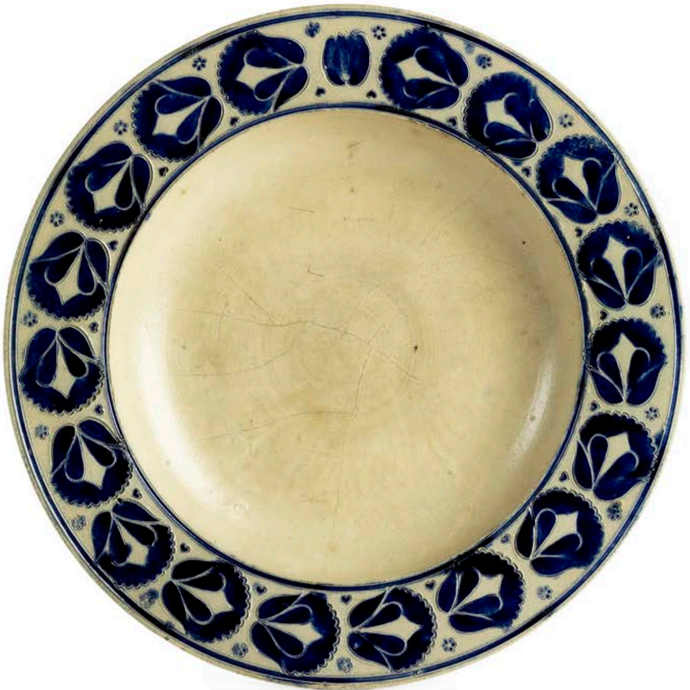
44. Westerwalder Steinzeugplatte um 1720, die mit Stempeldekoren verziert ist, D. 38 cm