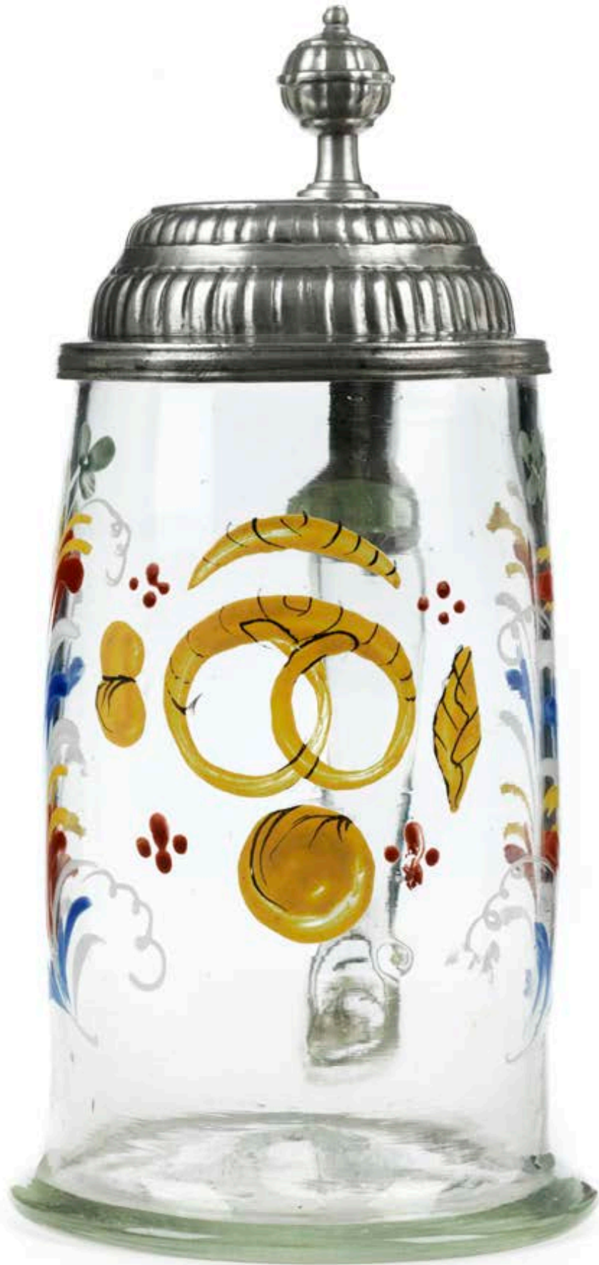
32. Böhmischer Bäckerzunftkrug um 1780, Glas mit bunter Emailmalerei, H. 19 cm