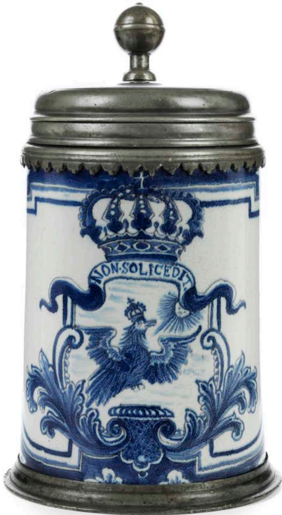
4. Berliner Fayencewalzenkrug um 1730, aus der Manufaktur Cornelius Funcke, H. 22 cm