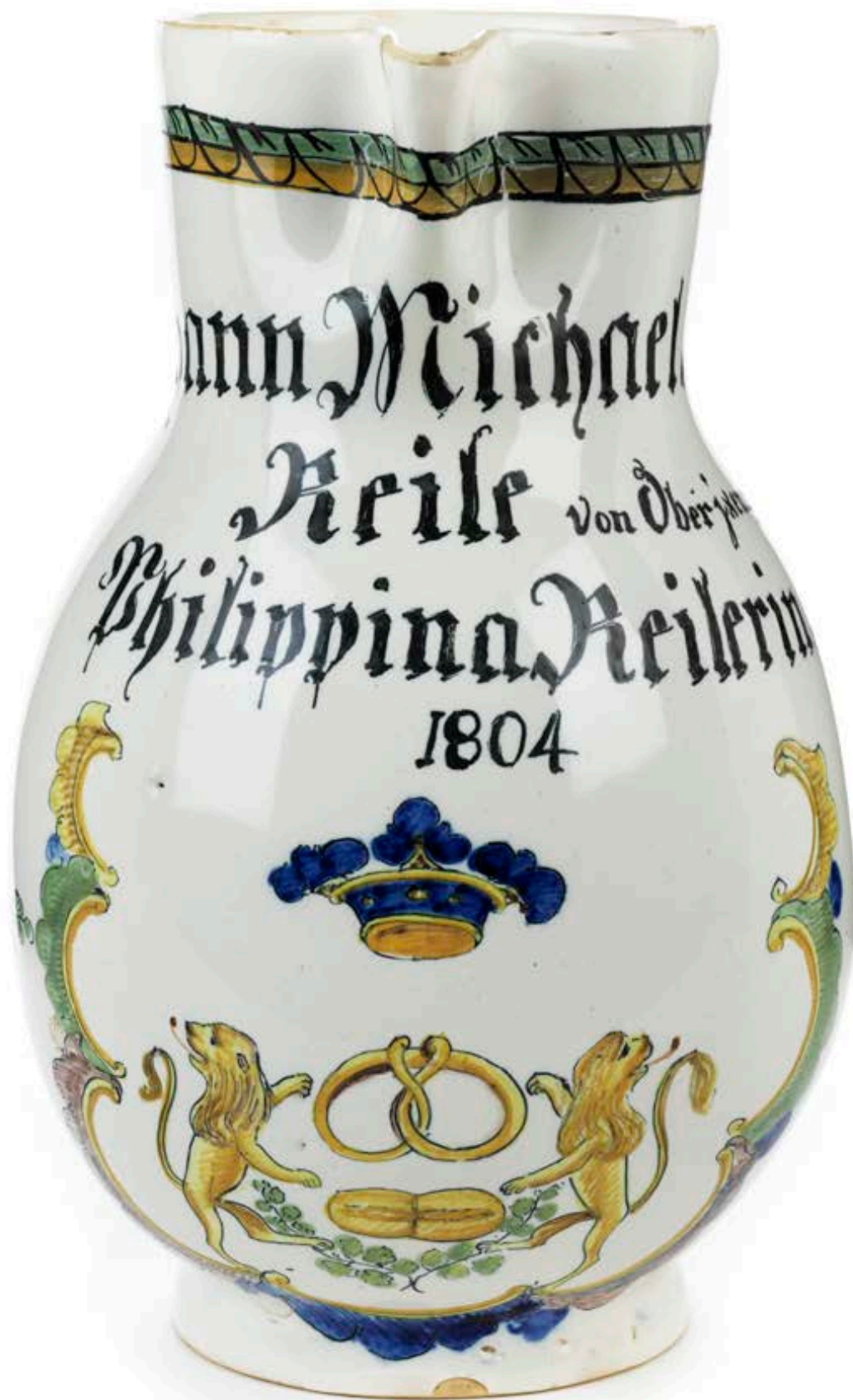
11. Durlacher Bäckerkanne 1804 datiert, die mit bunten Scharfffeuerfarben bemalt ist, H. 22 cm