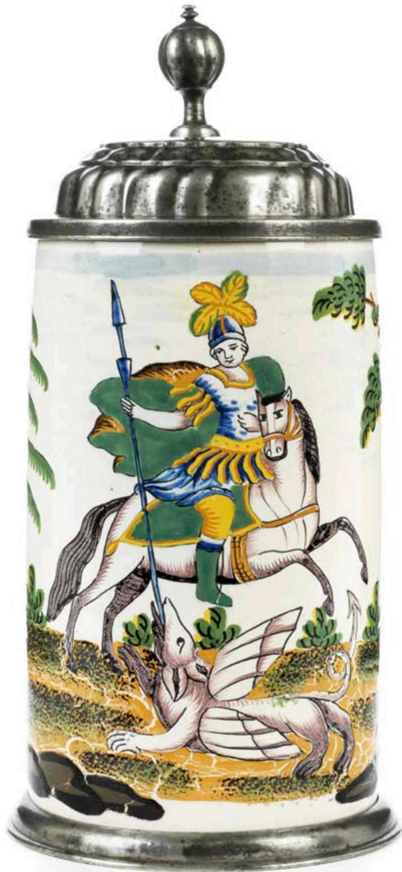
7. Crailsheimer Fayencekrug um 1790, der „Gelben Familie“ in Scharfffeuermalerei, H. 23 cm