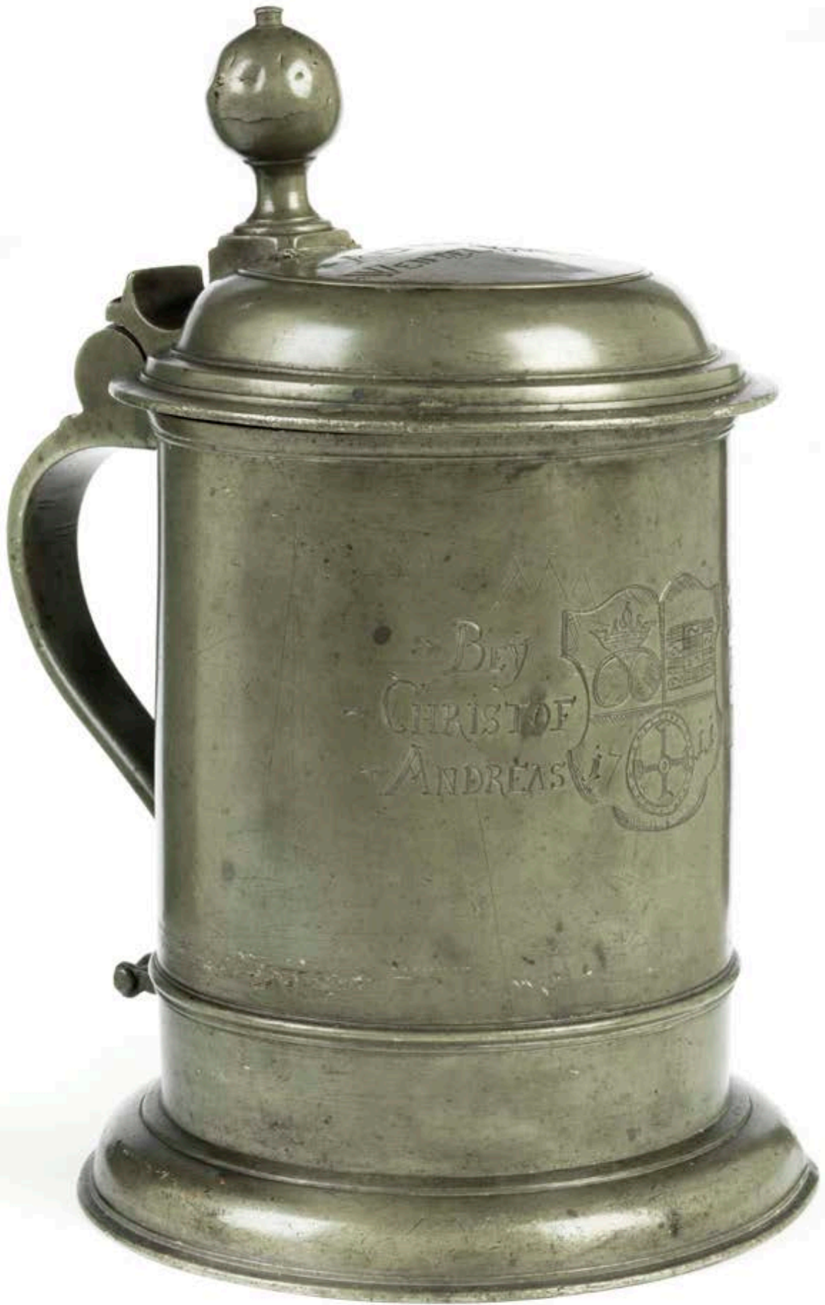
45. Bäckerzunftkrug aus Böhmisches Leipa 1711 datiert, Meister Anton Bartel, H. 28 cm