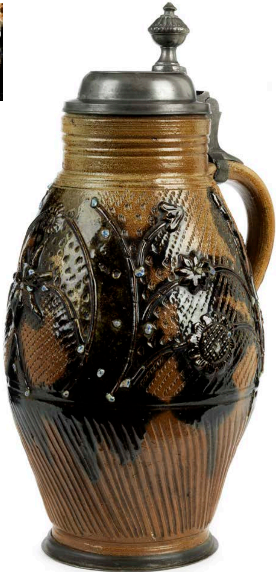
42. Muskauer Steinzeugkrug 1811 datiert, mit Auflagen und Quarzsteinen verziert, H. 32 cm