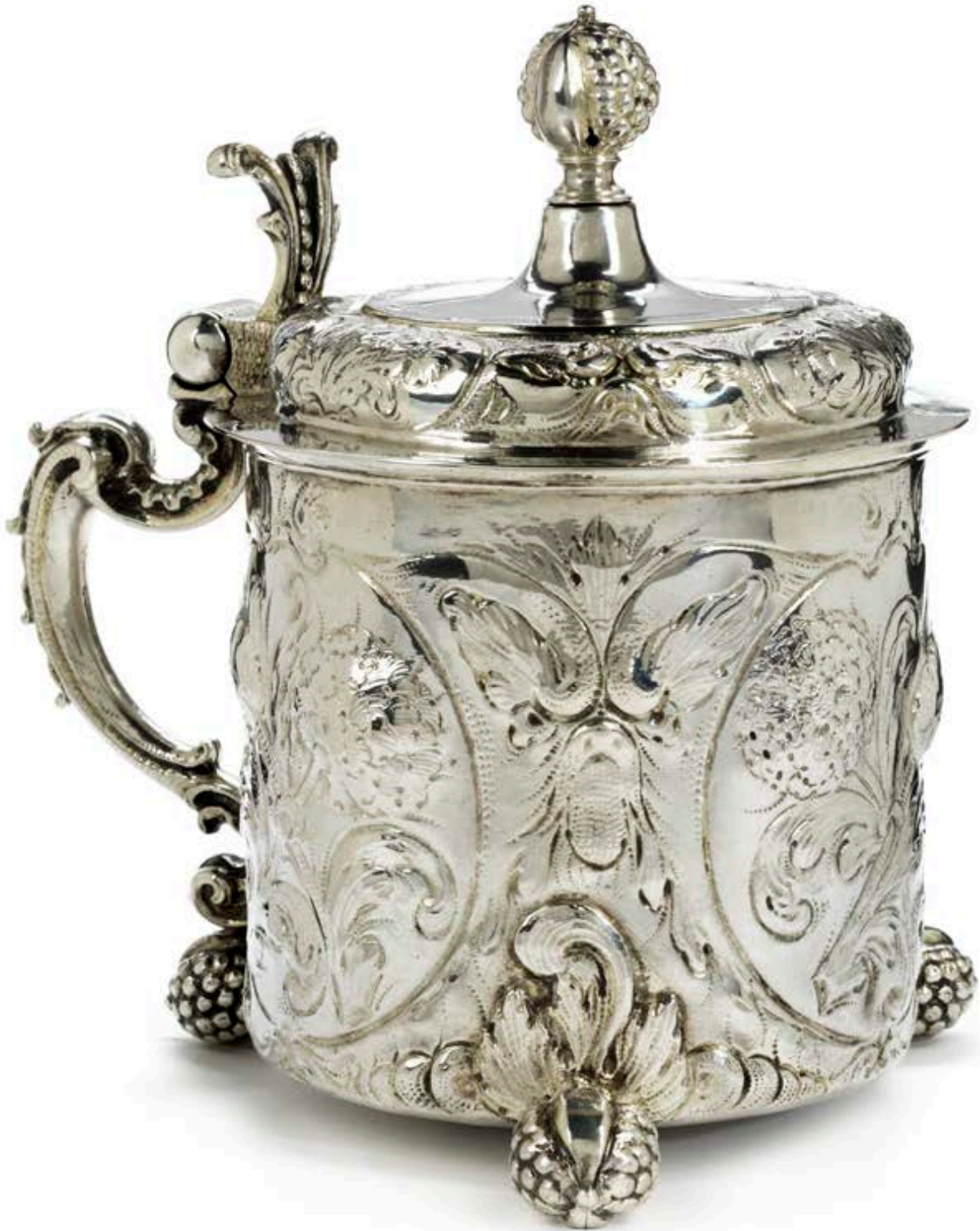
29. Göteborger Silberhumpen um 1710, Meister Abraham Pedersson Wirgman, H. 20 cm