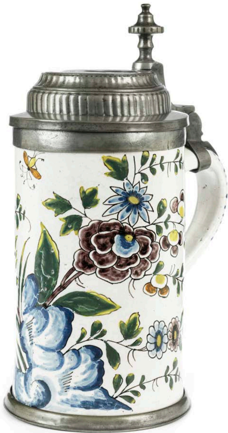
13. Friedberger Walzenkrug um 1760, mit schwarzer Manufakturmarke „C.B.“, H. 25 cm