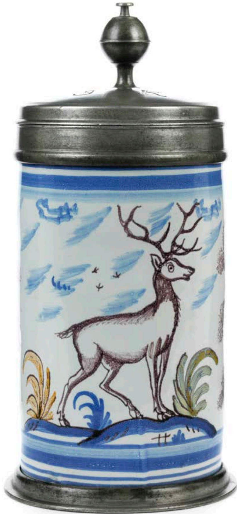
2. Bayreuther Jagdkrug um 1780, der mit bunten Scharfffeuerfarben bemalt ist, H. 23 cm