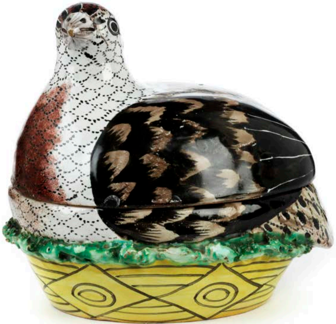
24. Proskauer Fayencedose in Form einer Wachtel um 1800, bunte Muffelmalerei, H. 12 cm