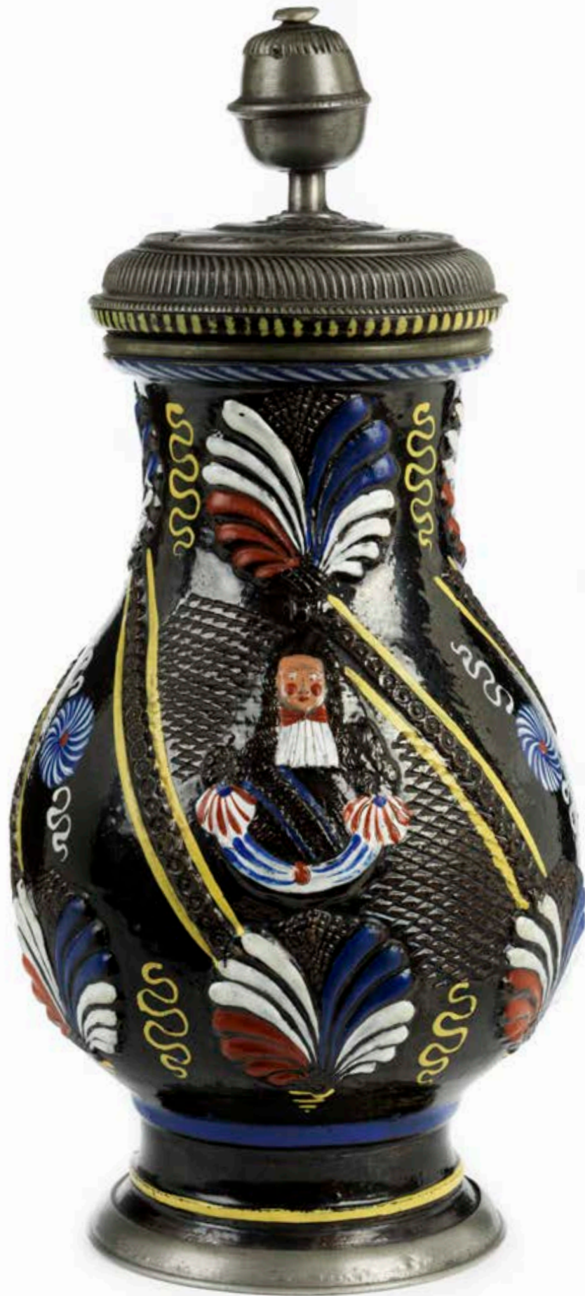
39. Dippoldiswalder Birnkrug um 1700, der mit bunten Emailfarben bemalt ist, H. 25 cm