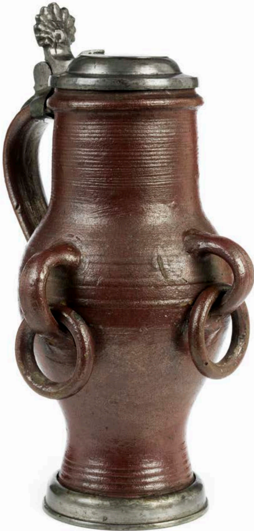
37. Dreihäusener Ringelkrug um 1780, auf der Wandung drei Ösen mit Ring, H. 23 cm