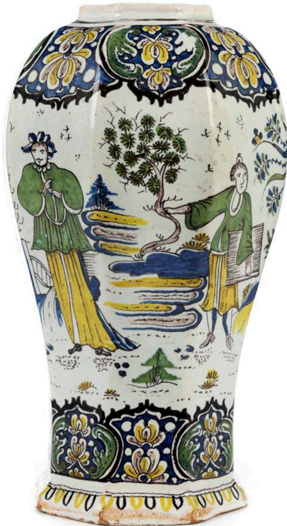
5. Berliner Fayencevase um 1730, aus der Manufaktur Cornelius Funcke, H. 23 cm