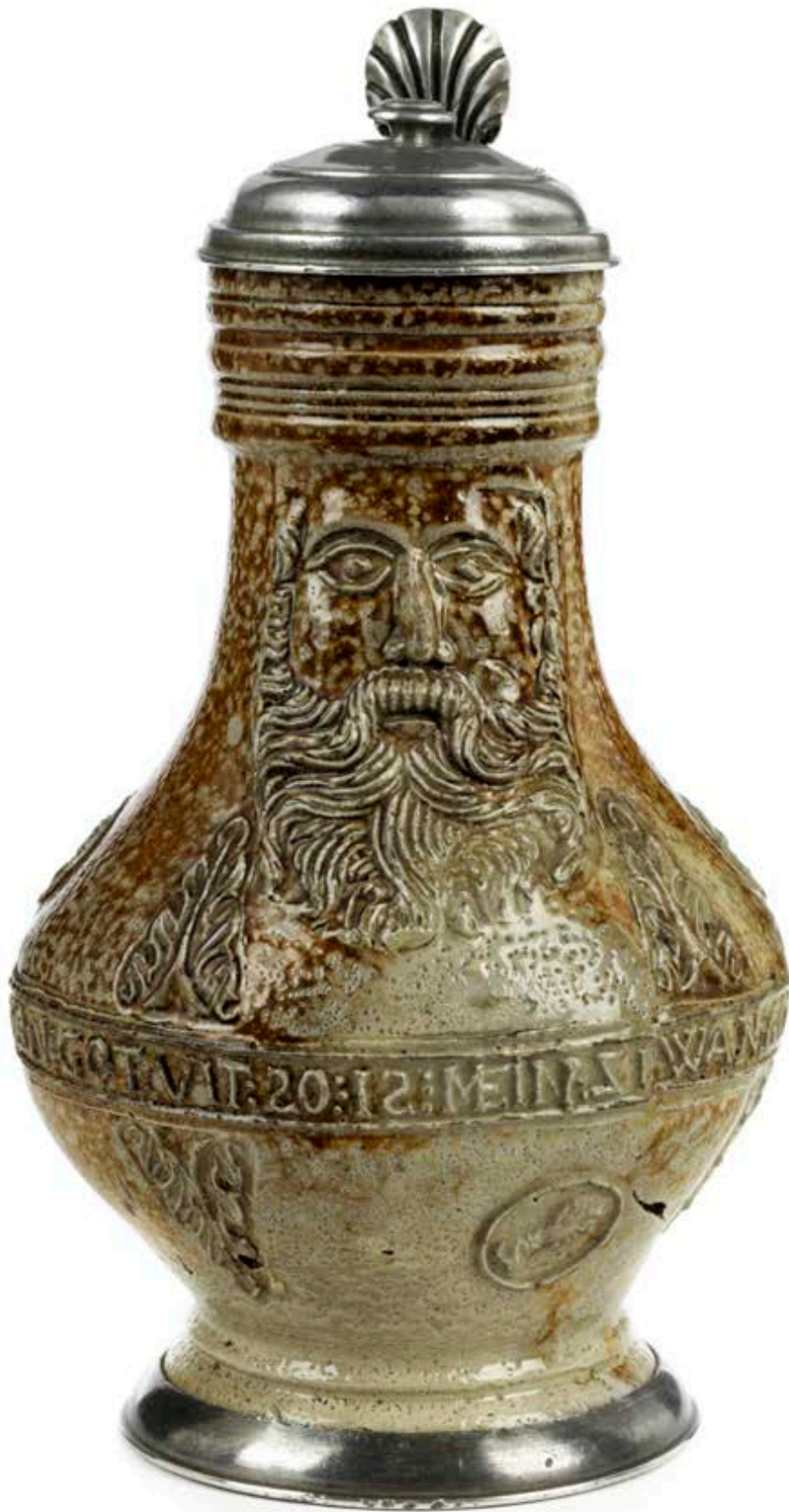
38. Kölner Bartmannskrug um 1580, der mit Reliefaufgaben verziert ist, H. 18 cm