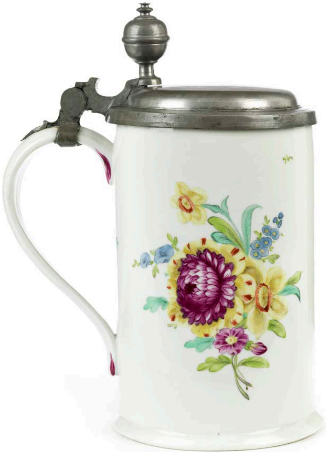
31. Wallendorfer Porzellankrug um 1770, Zinnmontierung mit Nürnberger Marke, H. 22 cm