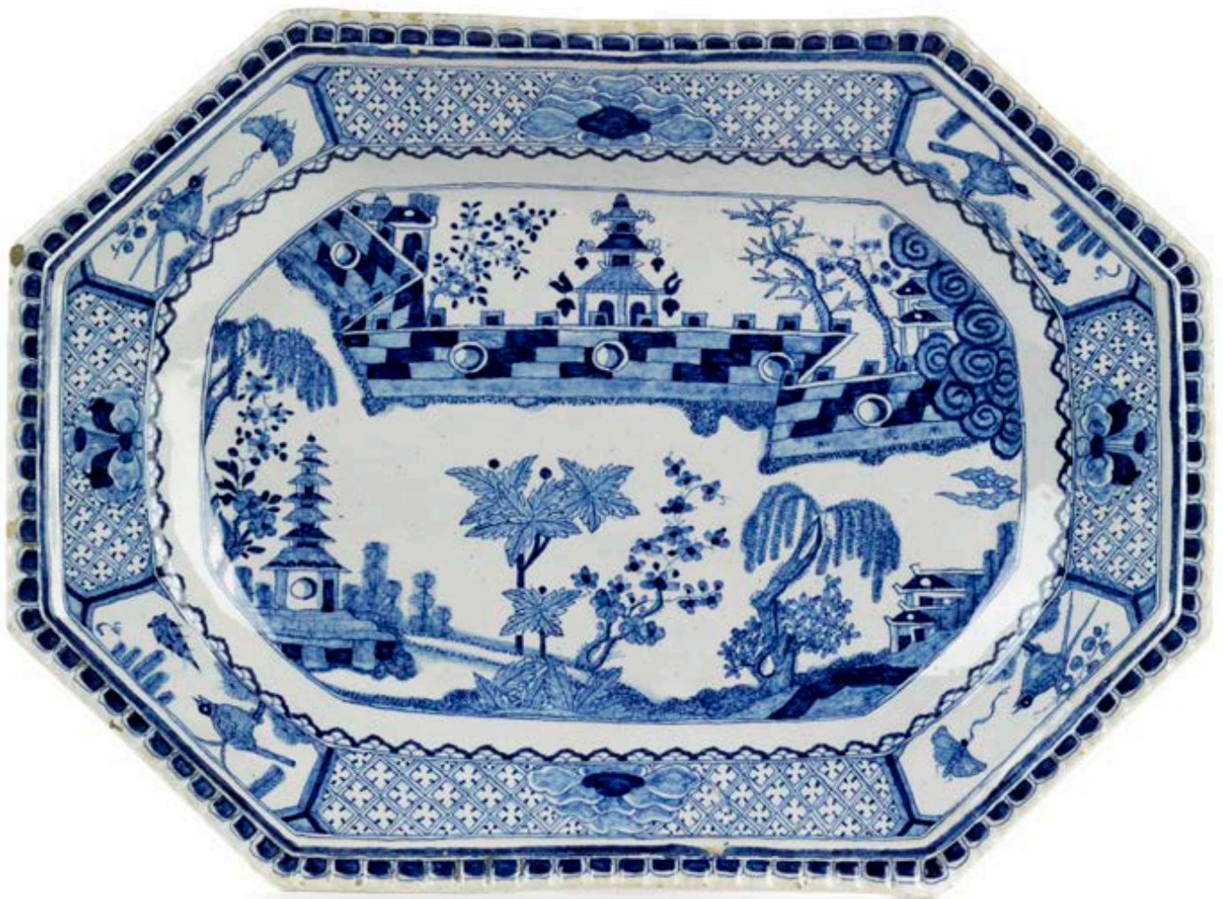
1. Ansbacher Fayenceplatte um 1730, die mit blauen Scharfffeuerfarben bemalt ist, B. 39 cm