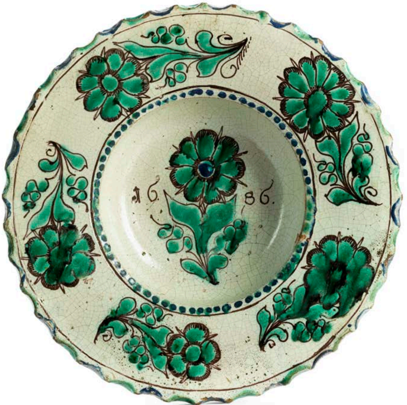
28. Zittauer Fayenceplatte 1686 datiert, die mit bunten Scharfffeuerfarben bemalt ist, D. 29 cm