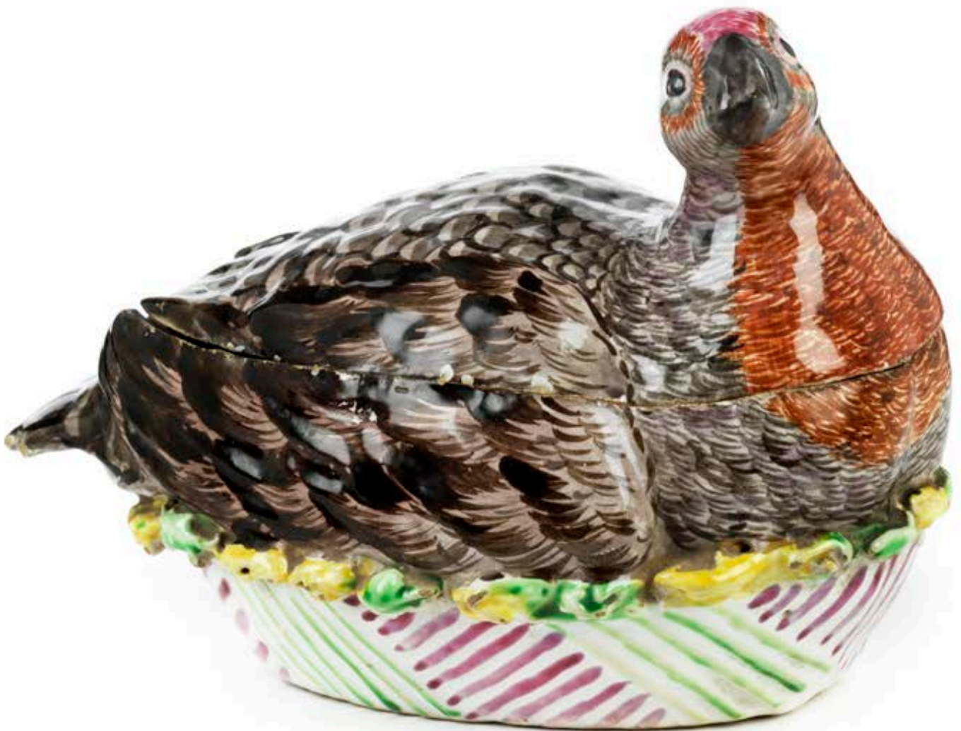
23. Proskauer Fayencedose in Form eines Rebhuhnes um 1770, bunte Muffelmalerei, H. 11 cm