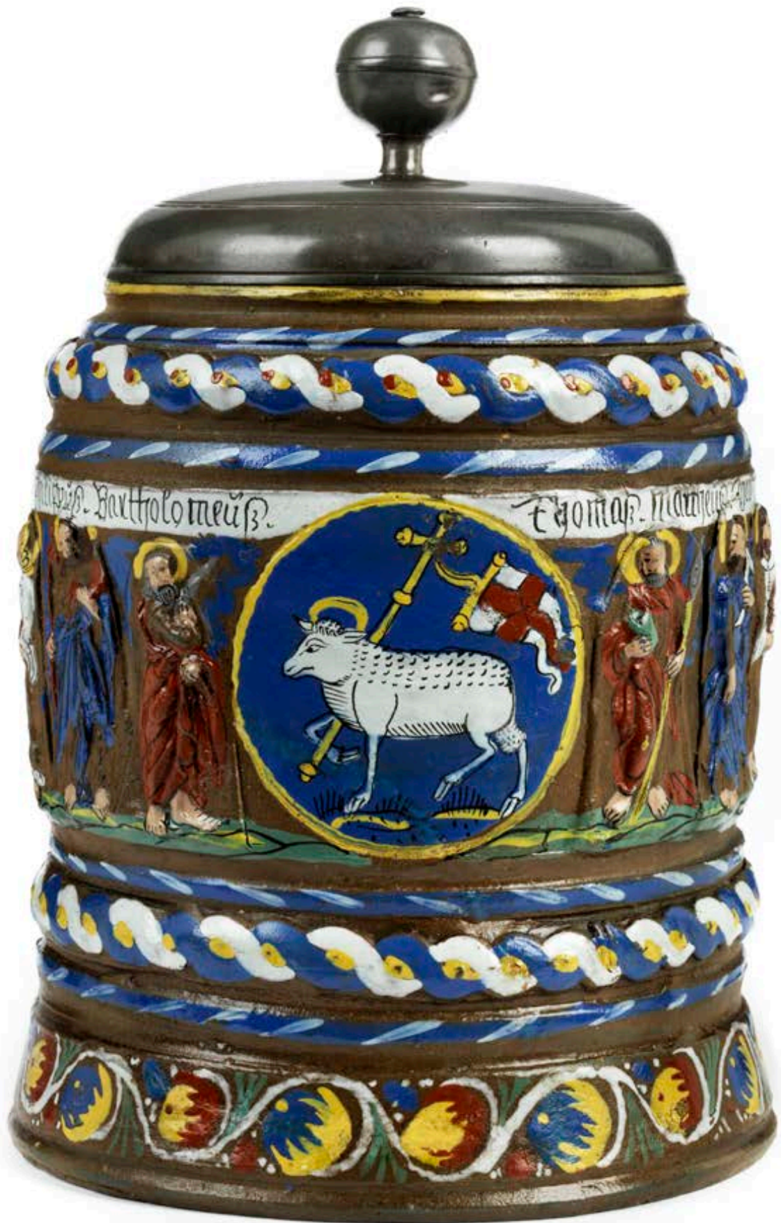
35. Creußener Apostelkrug um 1690, der mit bunten Emailfarben bemalt ist, H. 20 cm