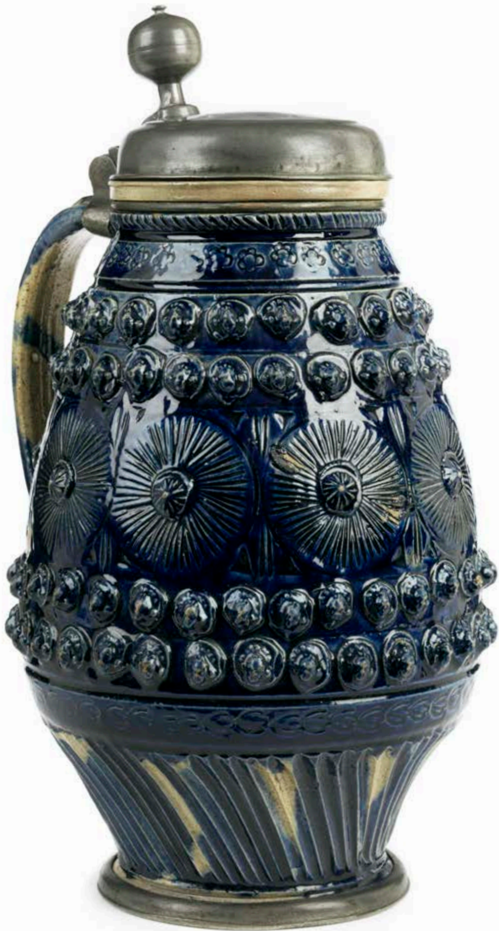
41. Muskauer (Region Triebel) Krug um 1680, blau glasiertes Steinzeug, H. 28 cm